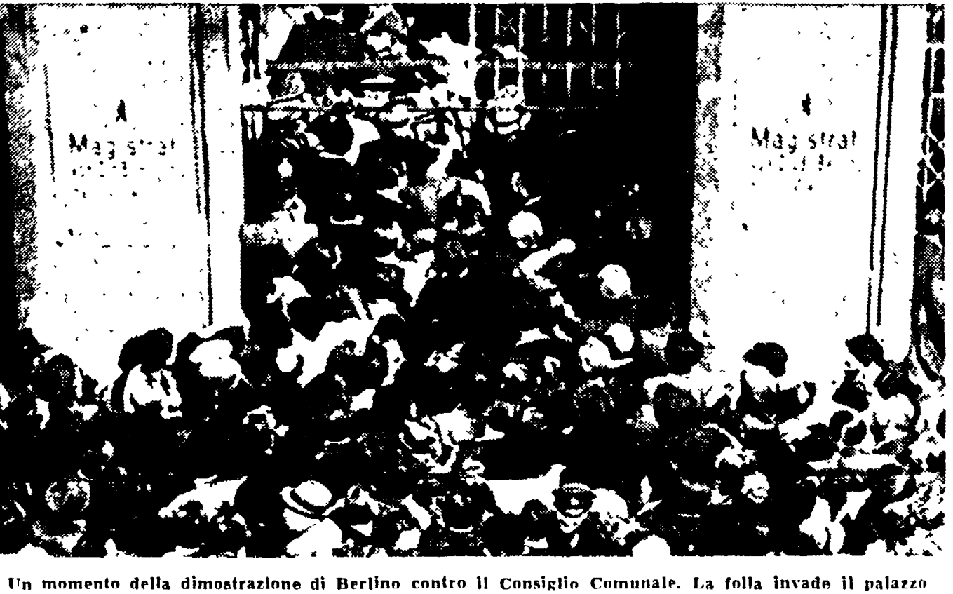
Un momento della dimostrazione di Berlino contro il Consiglio Comunale. La folla invade il palazzo