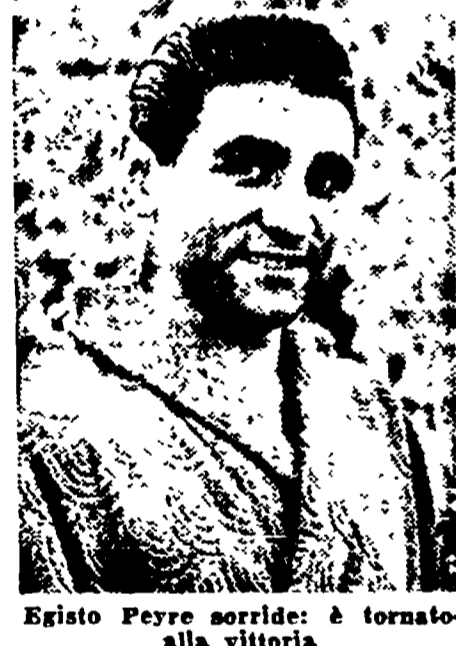
Egisto Peyre sorride: è tornato alla vittoria

MILANO, 17. — Corre insistente la voce negli ambienti sportivi milanesi che Gino Bartali intende dar vita nel prossimo anno ad una nuova casa di biciclette, cui darebbe il proprio nome. Lo spunto di queste voci è stato dato da una visita del fiorentino alla redazione del quotidiano sportivo milanese. In tale occasione Bartali ha parlato dei propri progetti per il 1949, ha detto tra l'altro che la sua somma aspirazione per il prossimo anno sarà quella di vincere il Giro d'Italia, ha aggiunto che parteciperà alla massima corsa a tappe nazionale con una squadra fortissima comprendente anche il campione svizzero Kurt Steiner, che corrisponde alla Divisione Nazionale italiana, serie A e serie B. Il fatto che non abbia citato la casa alla quale è legato da quasi quindici anni è molto significativo: egli conta di correre l'anno venturo su biciclette «Bartali». Molti ricordano del resto che il campione ha già ad occuparsi tempo addietro dell'industria del ciclo, e precisamente un paio d'anni fa fondò una ditta che si chiamava «Bartali» e che si occupava di qualche corsa ciclistica su marca «Tebag». La «Tebag» era una bicicletta dotata, la quale si celava appunto il suo nome. La notizia, che in un primo tempo era apparsa non completamente fondata, ha trovato piena conferma negli ambienti della Casa «Legnano», i cui dirigenti hanno