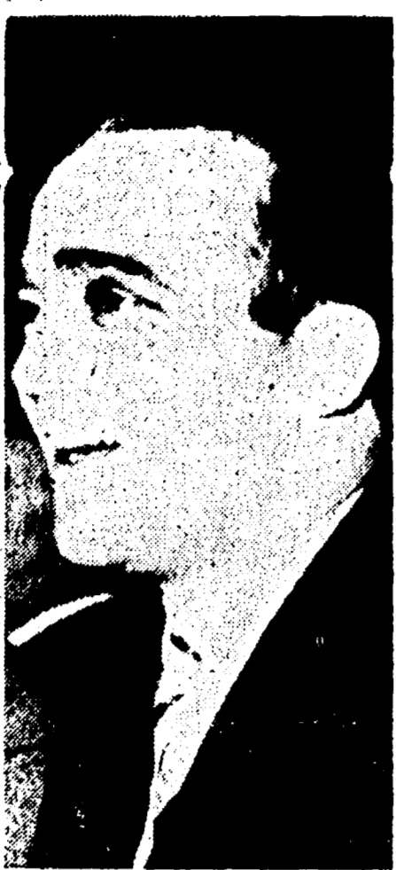
Marcel Cerdan, campione del mondo dei pesi medi, è giunto in America, dove forse si batterà nuovamente con Tony Zale, da lui spodestato dal titolo.