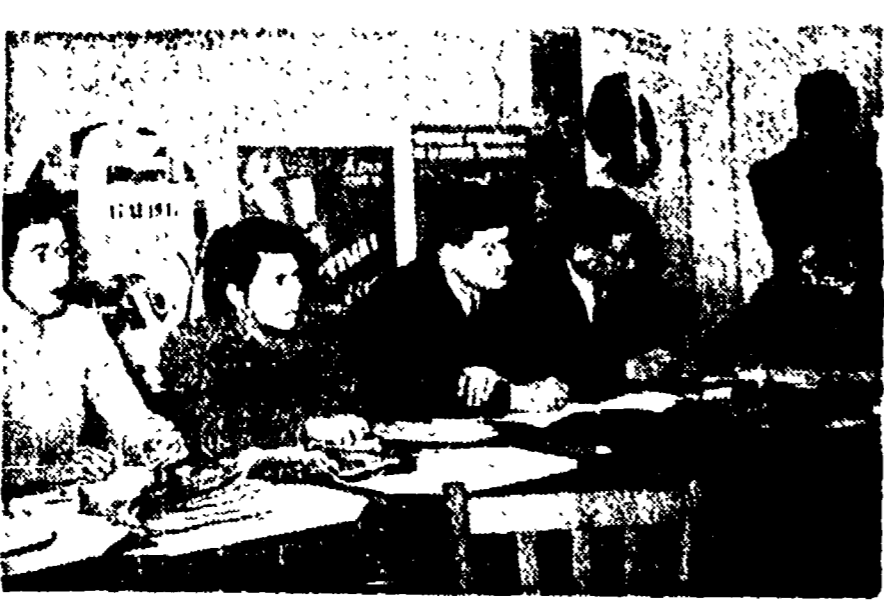
Il giorno 23 dicembre 1948 nel locale dell'Amministrazione Centrale del P. C. I. a Roma in via delle Botteghe Oscure, si è svolto il sorteggio dei premi assegnati per il 1948 al sottoscrittore del prestito "Per la vittoria della Democrazia" emesso nel 1946, e dei 34 premi assegnati alla sottoscrizione "Per la Ricostruzione e il consolidamento della Repubblica" lanciata nel 1947.