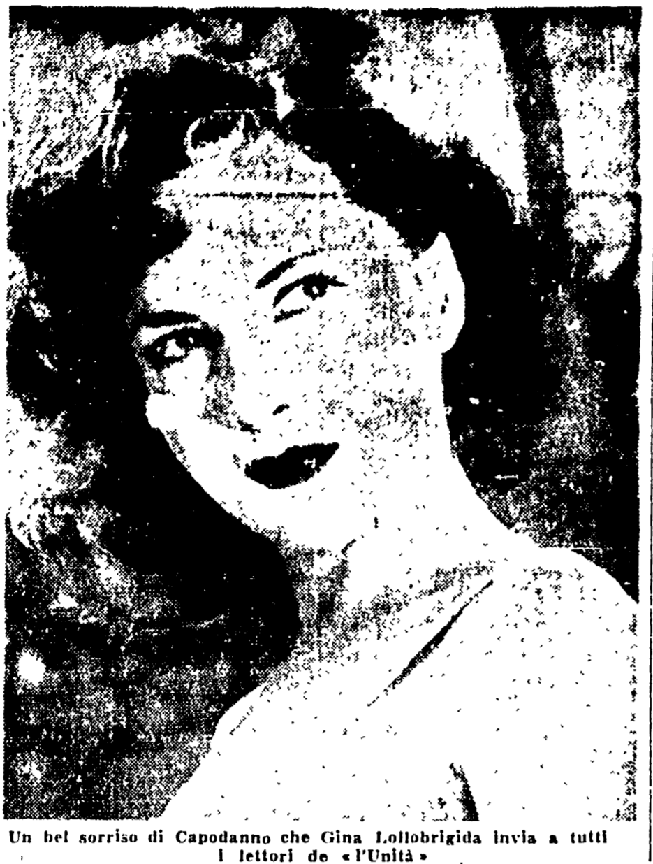
Un bel sorriso di Capodanno che Gina Lollobrigida invia a tutti i lettori de "L'Unità"