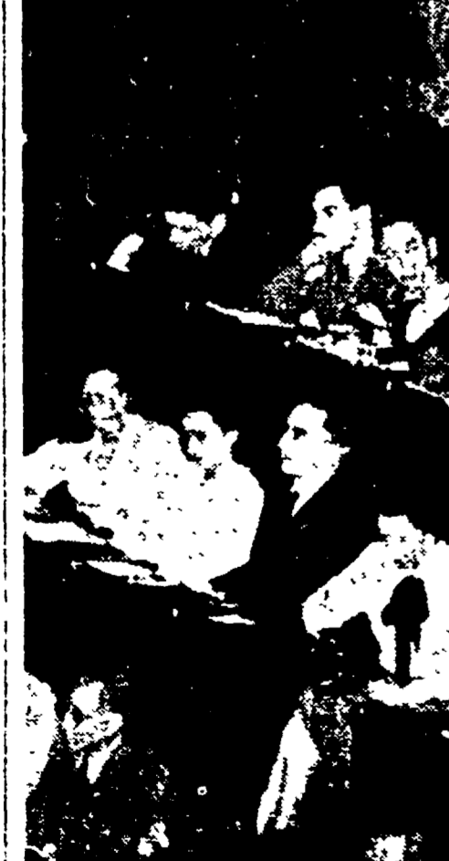
12 OTTOBRE 1948 - Il compagno Togliatti, dalla tribuna di Montecitorio...