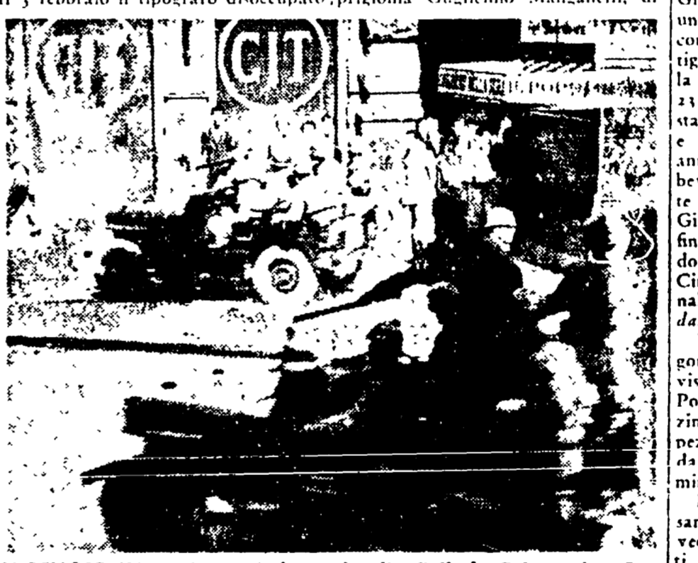
14 LUGLIO 1948 - Roma. Nel presì della Galleria Colonna la «Celere» carica brutalmente i cittadini romani...