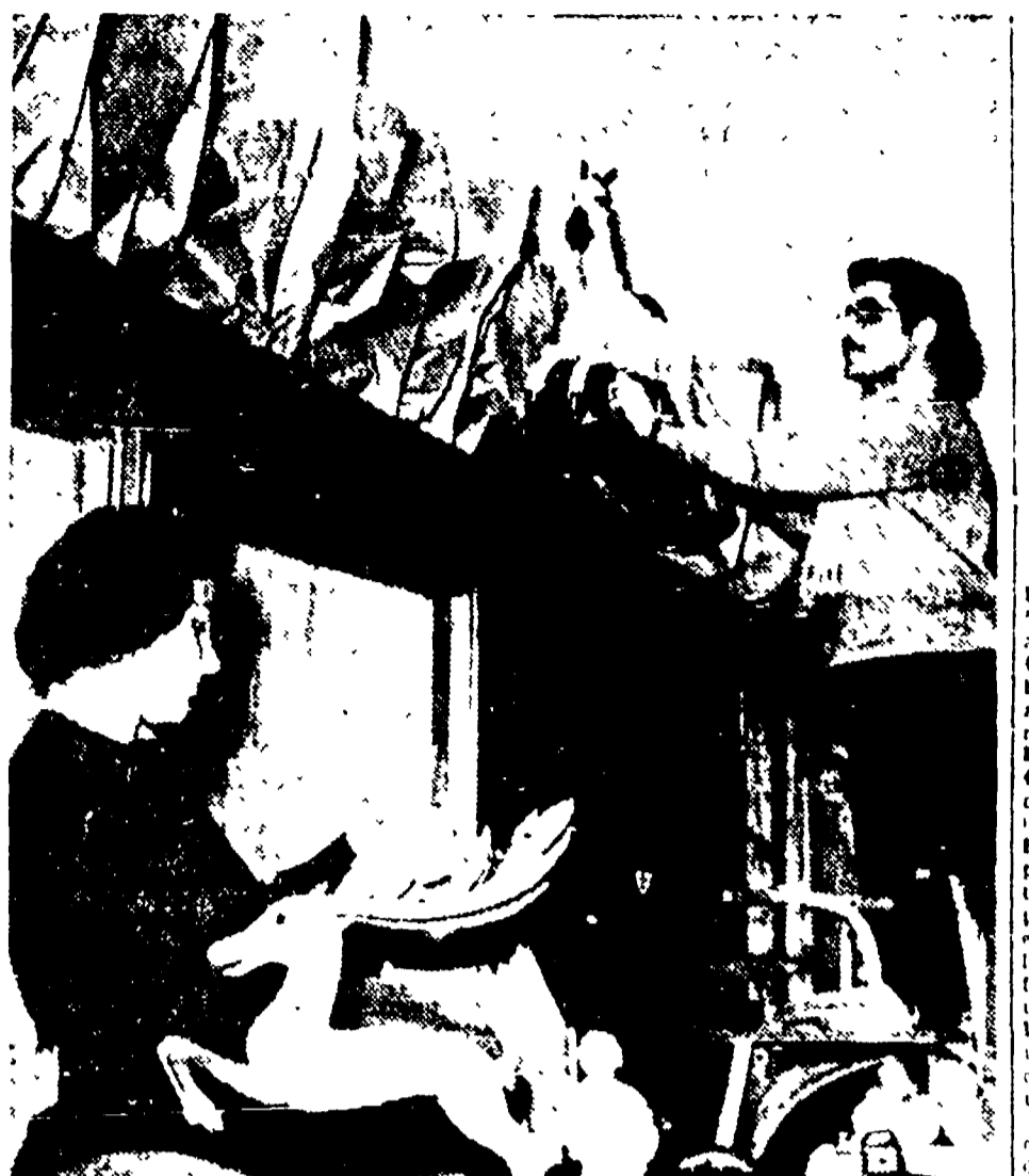
I parchi sono quasi tutti profitti. Ecco due compagni al lavoro: è un po' difficile convincere un cavallo a dondolo e un cervo a entrare nella busta

TELEFONO DEL SUICIDIO - Il telefono del suicidio, che era stato smontato, è stato ripristinato. Il numero è il 199.