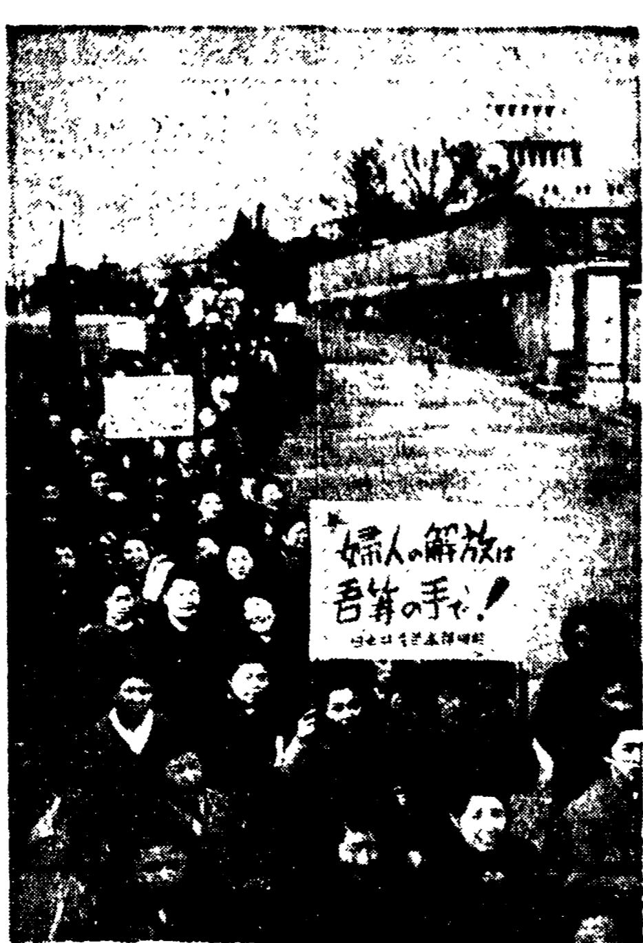
TOKIO - «L'emancipazione della donna dev'essere compiuta con le nostre mani» è scritto sui cartelli recati da un gruppo di comuniste giapponesi...