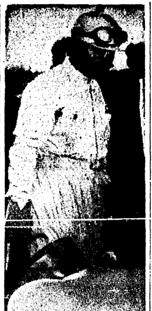
PIERO TARUFFI ha battuto venerdì i primati mondiali dei 5 chilometri e delle 5 miglia. Eccolo uelcro soddisfatto dal suo «doppio siluro», dopo il felice tentativo

Allo Stadio Nazionale è oggi di scena il Palermo, la squadra che nella prima fase del campionato seppero, insieme alla Lucchese, movimentare il torneo e che anche in seguito, pur non marciando più con lo stesso ritmo, riuscì a ottenere risultati sorprendenti da ricordare, fra i recenti il pareggio con il Torino, la vittoria a Livorno e il successo, casalinghi contro Inter e Fiorentina.