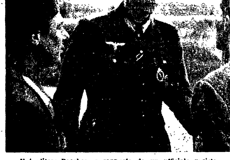
Il traditore Borghese a rapporto da un ufficiale nazista

Un grave fatto che suona insulto ai sentimenti antifascisti del popolo romano e che non potrà non suscitare la più viva indignazione a Roma e in Italia è accaduto ieri sera al Consiglio Comunale: i consiglieri democristiani e monarchici sono uniti ai rappresentanti fascisti nel rifiutare il loro voto ad un ordine del giorno di condanna per la scabrosa scarcerazione del traditore Borghese.