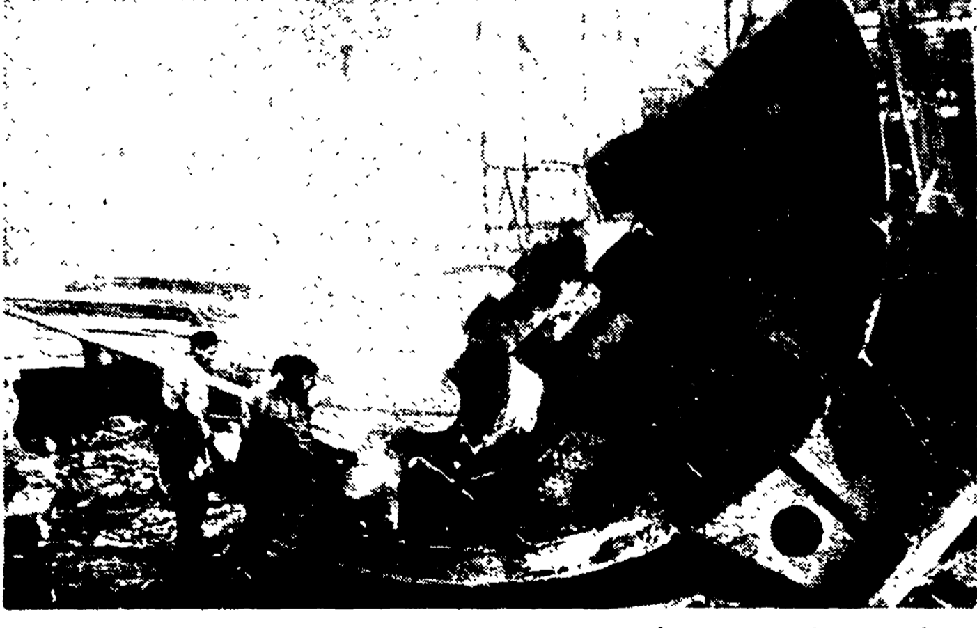
TARANTO - Gli operai della "Tosi" continuano, nonostante l'assedio padronale a lavorare nel cantiere. Il recupero del materiale ferreo ha raggiunto limiti quali non s'erano mai visti. Ecco un rottame il sommergibile mentre viene sezionato con la fiamma ossidrica.