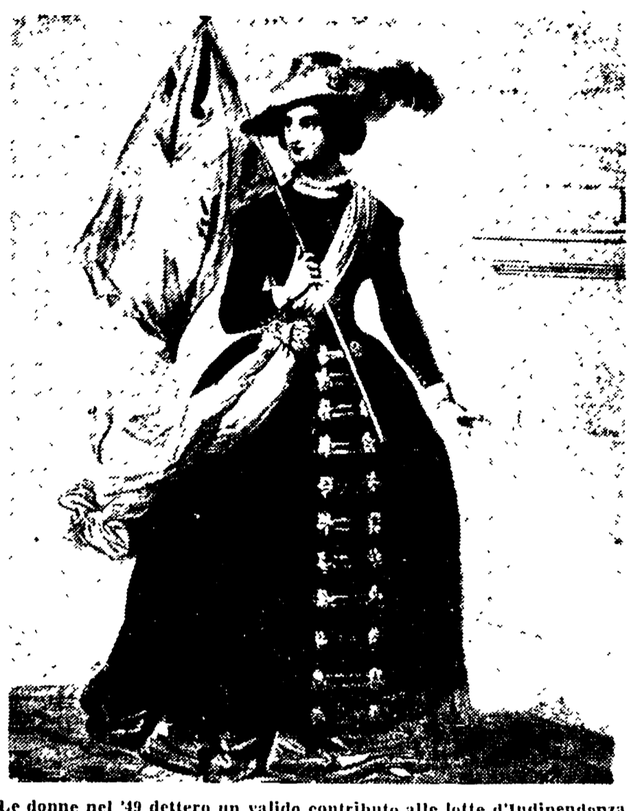
Le donne nel '49 dettero un valido contributo alle lotte d'indipendenza. Ecco una patriota in una stampa del Risorgimento.