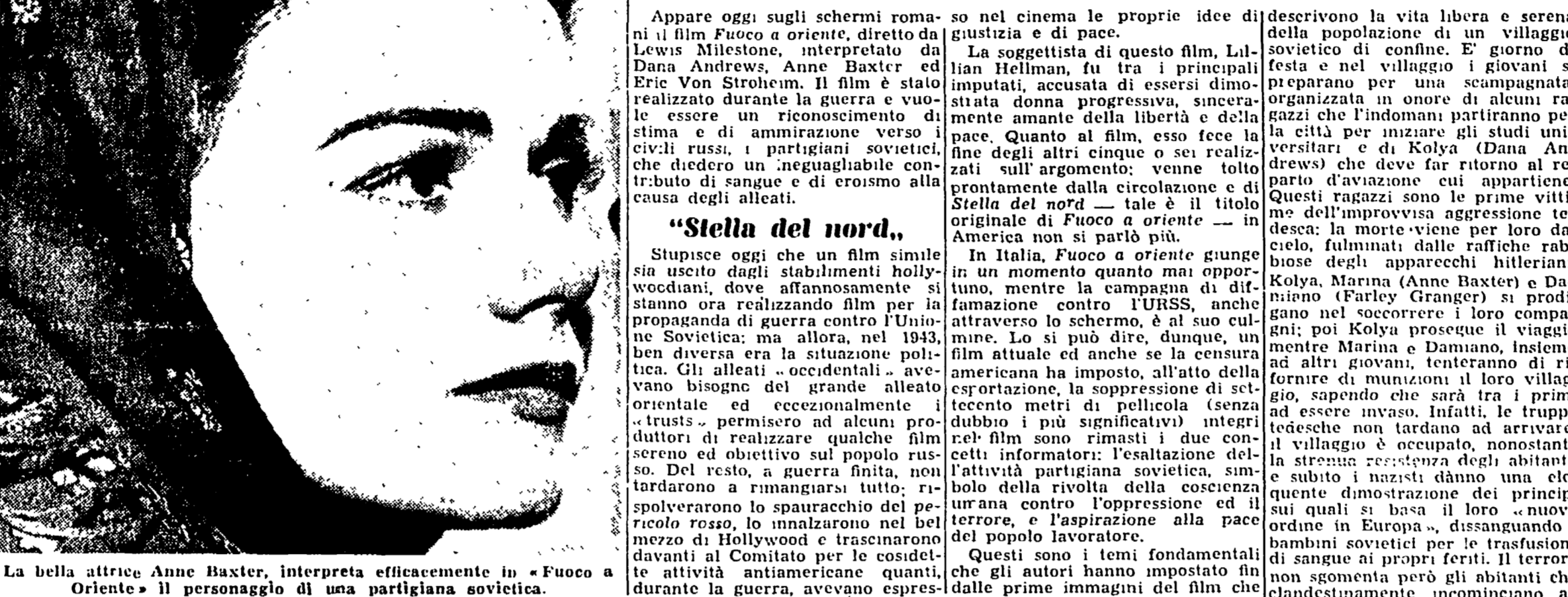
La bella attrice Anne Baxter, interpretata efficacemente in «Fuoco a Oriente» il personaggio di una partigiana sovietica.

Un film americano sui partigiani sovietici - La volontà di pace del popolo russo chiaramente espressa nel film - 700 metri tagliati