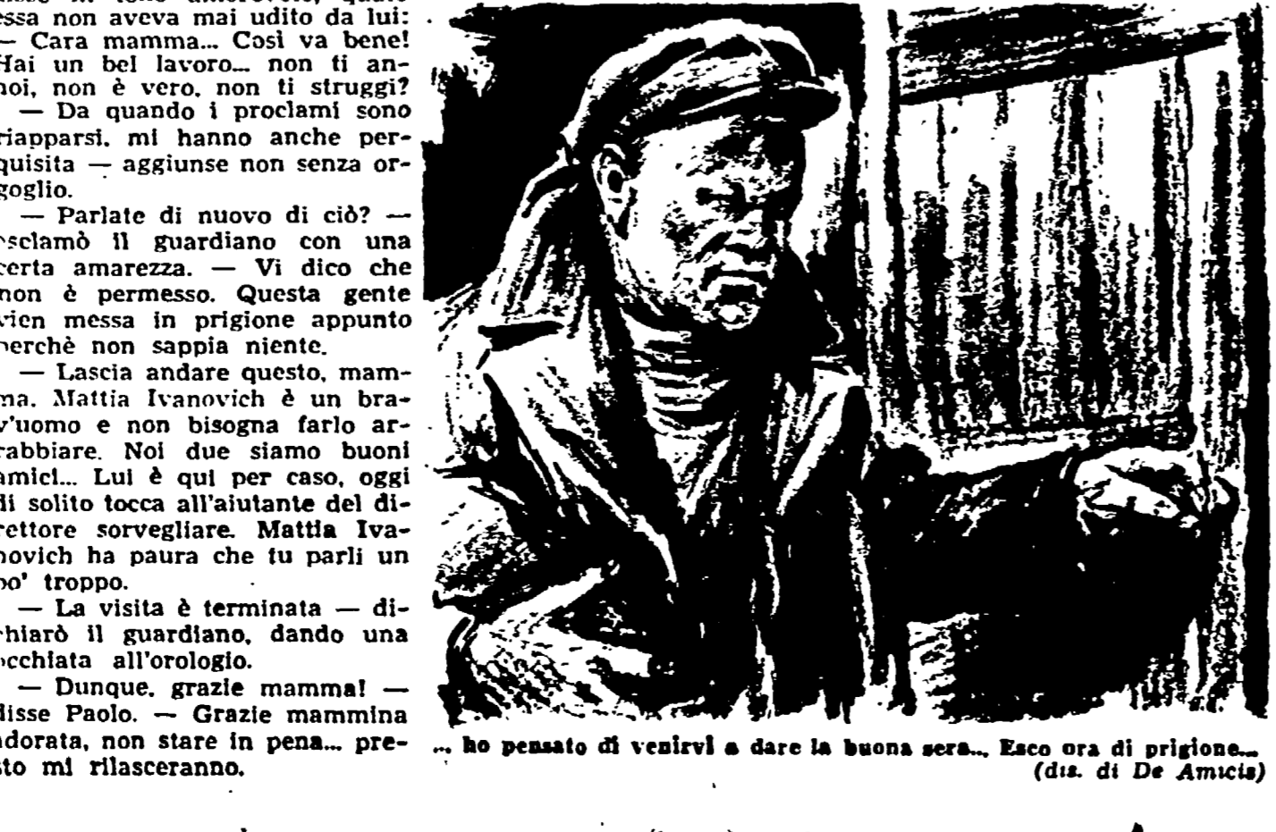
...ho pensato di venirlvi a dare la buona sera... Ecco ora di prigione... (da De Amicis)

In un villaggio onirico della Russia zarista vive la famiglia del fabbro Michele Vlassov, composta di lui, della moglie e del figlio Paolo. Dopo la morte del padre, Paolo si mette a studiare e diviene un intellettuale.