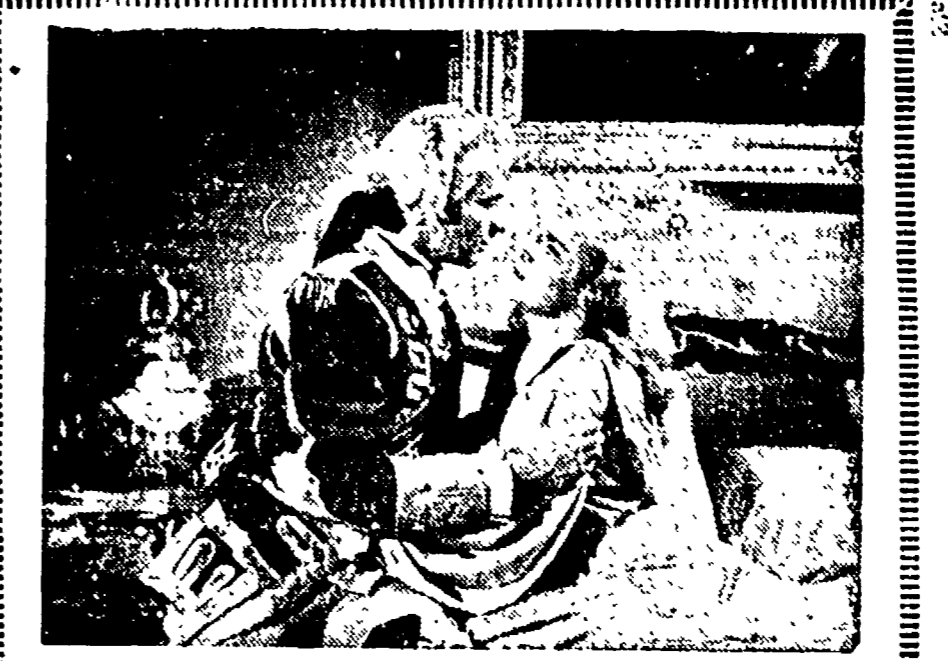
Nancy Guild e Frank Latimore in una passionale scena di «CAGLIO STRO», tratto da un famoso romanzo di Dumas e diretto da Gregory Ratoff. Come è noto, il protagonista dell'importantissimo film, che è il primo film americano girato in Stabilimenti Italiani, è Orson Welles. (Produz. E. Smal - Esclusività Scatena Film).

Ieri mattina, al Ministero del Lavoro tra i dirigenti della Breda, la Cgil, le Cisl e il Sindacato Unitario, si è svolta una riunione sindacale, alla presenza del Sottosegretario La Pira, è stato firmato l'accordo per i licenziati della Breda. In base a tale accordo, i lavoratori licenziati non dovranno superare un numero di 410 e si dovrà loro corrispondere una indennità supplementare, oltre quella contrattuale, di 1500 ore di retribuzione globale di fatto. Per coloro che hanno superato i limiti di licenziamento, si dovrà versare maggiorata del 50% e sarà corrisposta la metà delle indennità. Dopo tale termine le parti si incontreranno per studiare le ulteriori provvidenze a loro favore.