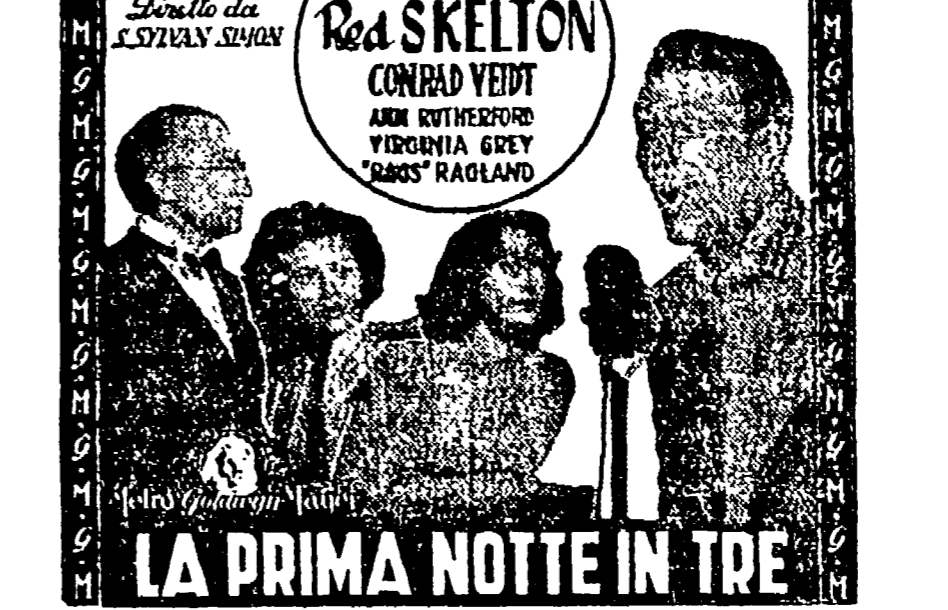
LA PRIMA NOTTE IN TRE

OGGI «PRIMA» AI CINEMA QUIRINALE - BERNINI - SPLENDORE