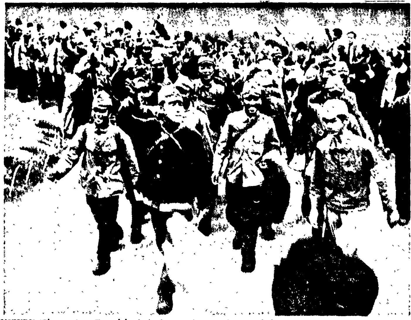
MIZURU (Giappone) - Ex prigionieri giapponesi nell'Unione Sovietica sono sbarcati dalle navi cantando l'Internazionale e l'inno della Gioventù comunista