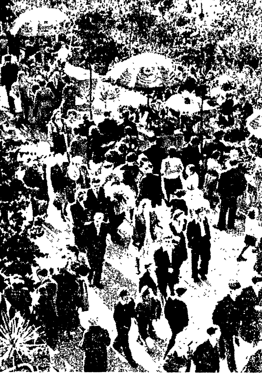
MOSCA. — Durante la stagione estiva, particolarmente nei giorni di festa, i parchi e i giardini si affollano di lavoratori in cerca di svago e di ristoro dalla calura.