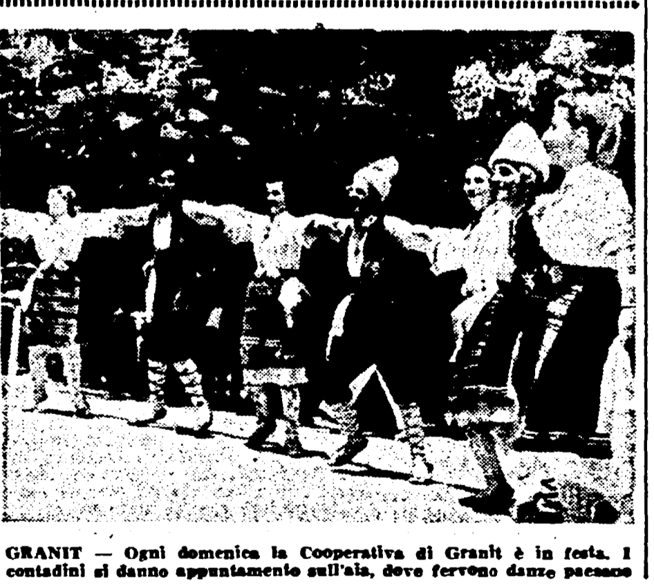
GRANIT - Ogni domenica la Cooperativa di Granit è in festa. I contadini si danno appuntamento sull'aria, dove fervono danze paesane

«Con la proprietà della terra frazionata più che in ogni altro paese d'Europa - egli dice - da noi il problema non era quello della nazionalizzazione, sebbene quella della collettivizzazione collettiva della terra. Ecco perché abbiamo dato grande sviluppo alla conduzione cooperativa...»