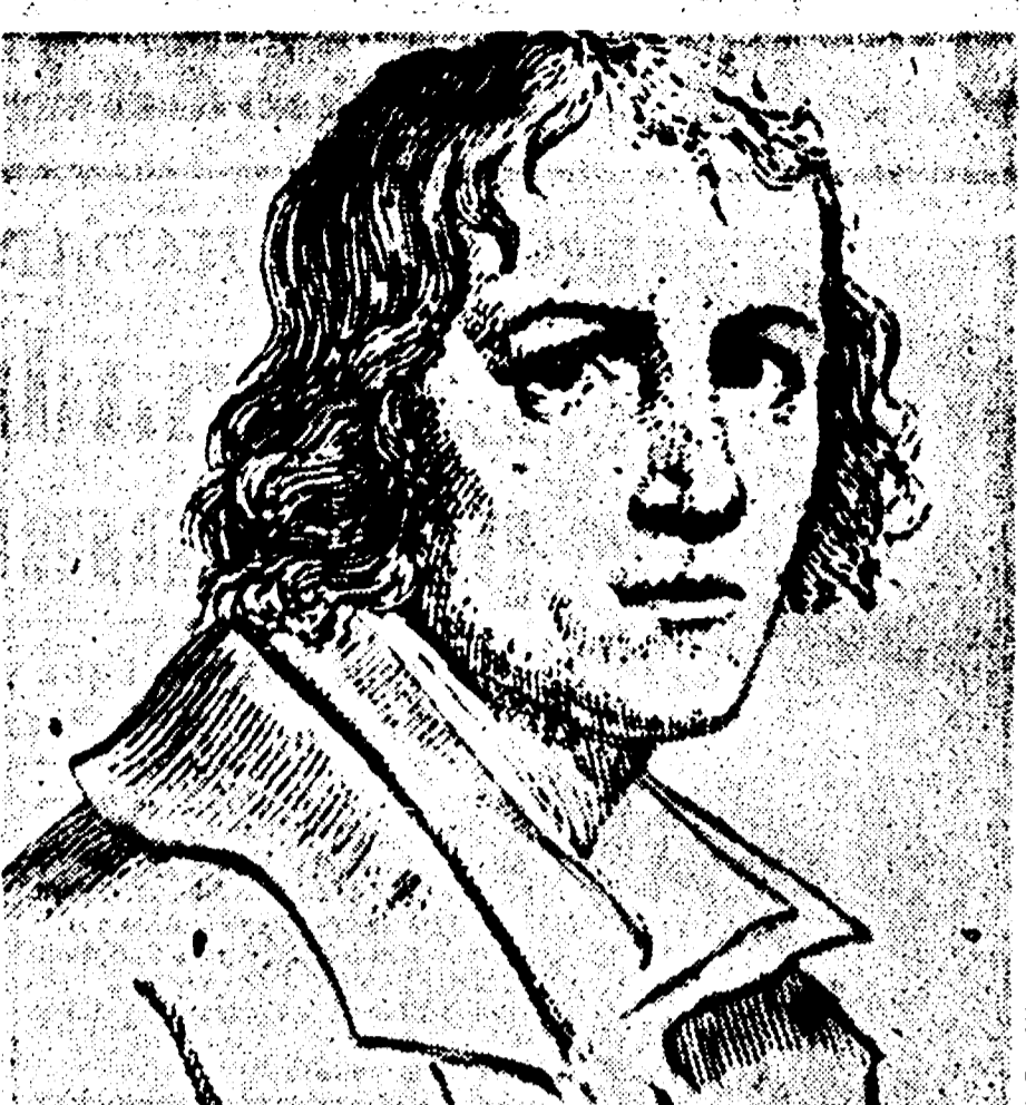
Or sono cent'anni, veniva feucitato a bottega dall'austro-papalini il padre baraballo Ugo Bassi, cappellano dei garibaldini. Nato a Creola nel 1801 Bassi entrò a fare parte dell'ordine dei barnabiti ma l'idea di un'Italia diversa lo aveva affascinato ben presto.

«Non c'è male, Bassotto. Appena un migliaio di miglia lontano...» «Una cava, allora?», «Cino come il muschio e le patate...» «Aspetta, lasciami indovinare, mi par d'indovinare...»