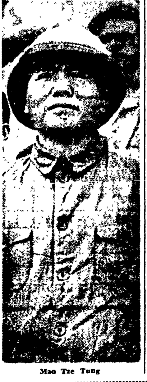
Mao Tze Tung

La stampa reazionaria fa finta di meravigliarsi e di essere obiettiva quando scrive: «Indubbiamente i governi comunisti cinesi, i quali sanno fare la guerra...» e i prigionieri comunisti cinesi sono dis-