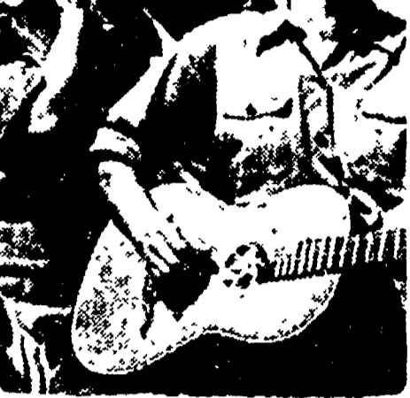
Studentesse ungheresi salutano con canti popolari l'arrivo delle delegazioni... per il II Festival della Gioventù

Il principale attentatore è stato arrestato a Marsiglia - L'altro è ancora latitante