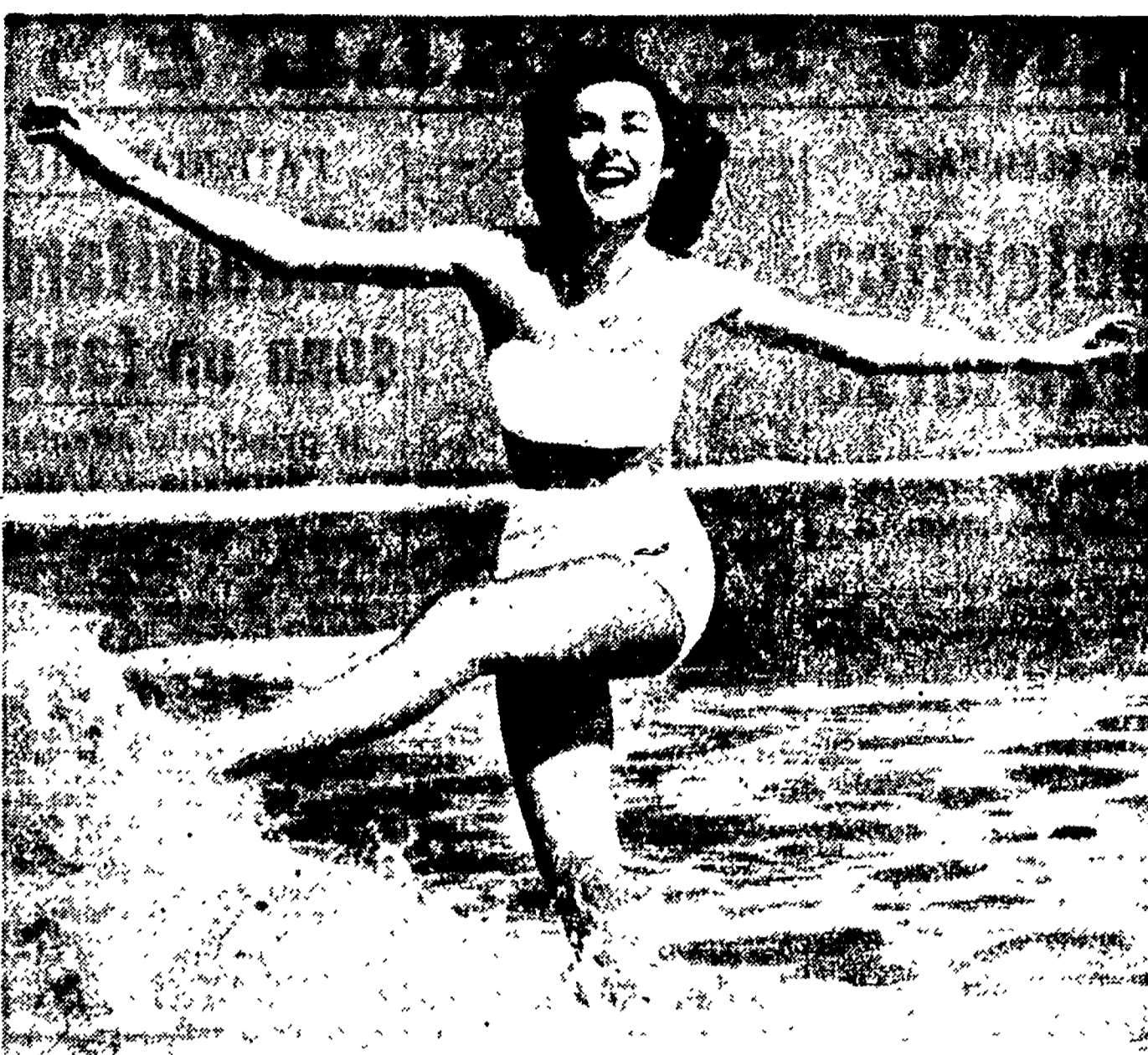
Invito al mare

Erano quelli i suoi ultimi mesi di libertà, perché, poco dopo, nell'estate del 1937 fu arrestato a Bologna e condannato dal Tribunale speciale a 24 anni di carcere e liberato solo dopo il luglio del 1943.