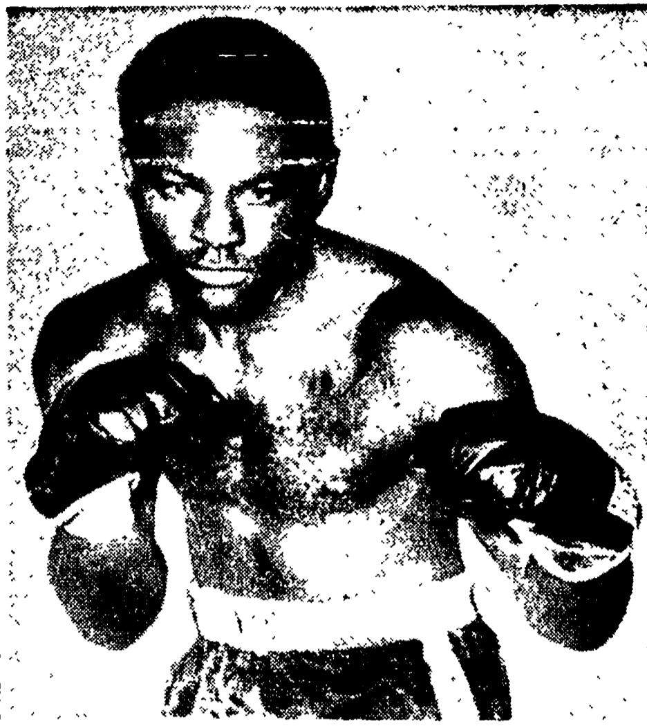
Esard Charles, il "gigante d'ebano", ha conquistato il massimo titolo contro Jersey Joe Walcott e lo ha difeso vittoriosamente mercoledì notte contro Lesnevich