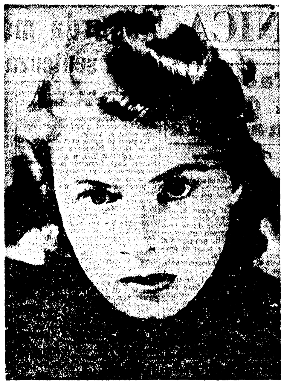
Ecco Ingrid Bergman in una inconsueta espressione

IL GIARDINETTO pubblico, meschino e polveroso, in quel torrido pomeriggio d'agosto, era quasi deserto. Tuta vi entrò, col bambino in braccio. Su un sedile in ombra, un vecchio macero, perduto in un abito grigio d'alpaga, teneva in capo un fazzoletto. Sul fazzoletto il cappelluccio di paglia ingiallito. Aveva rimboccato diligentemente le maniche sui polsi e leggeva un giornale.