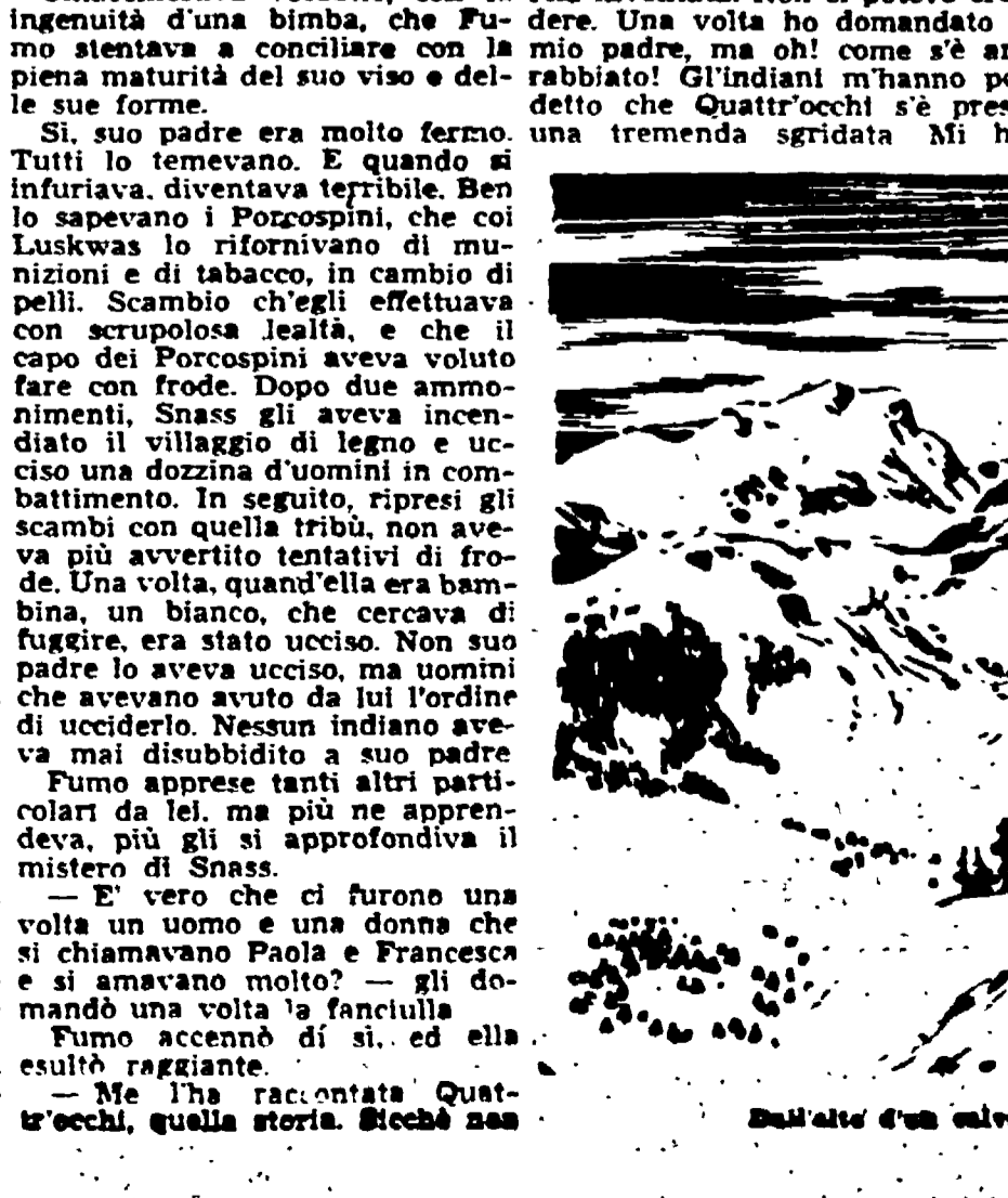
Dall'alto d'un altro spero guardavano...