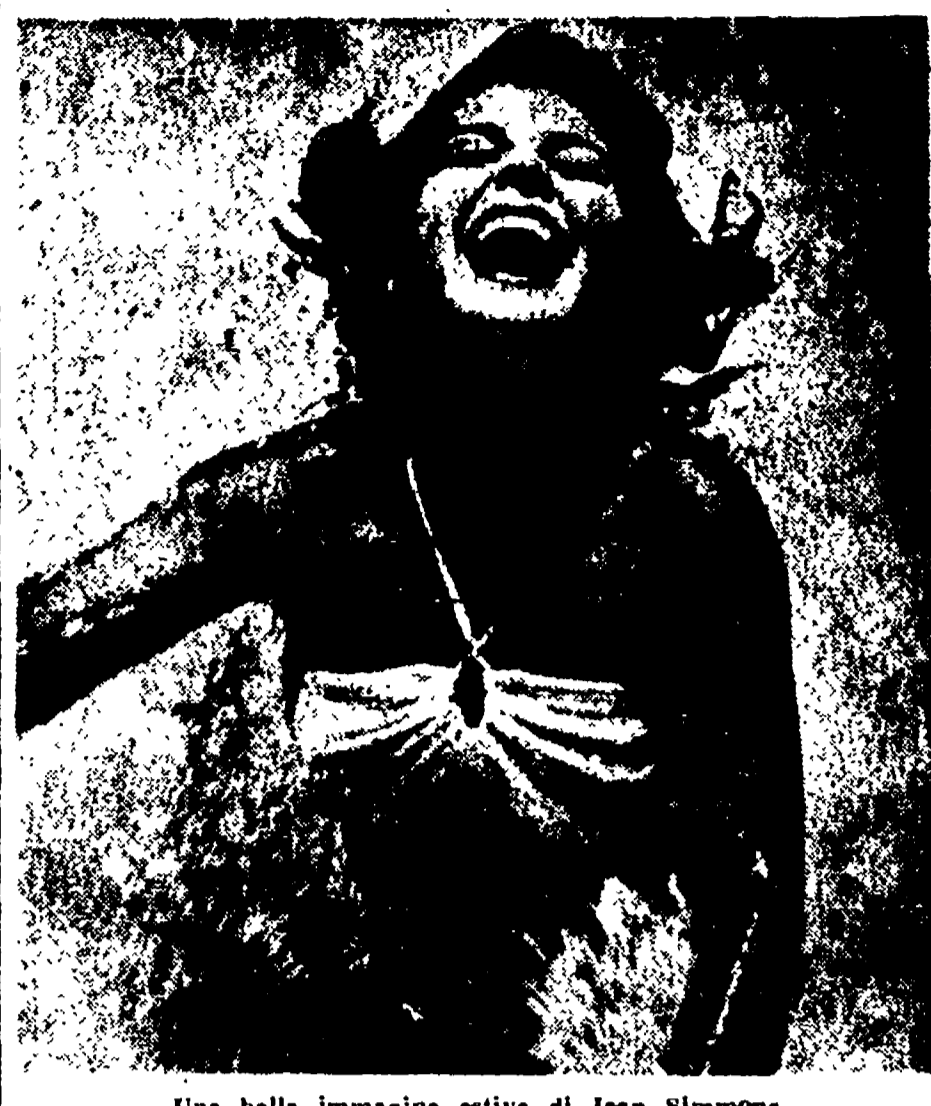
Una bella immagine estiva di Jean Simmons