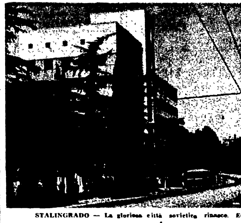
STALINGRADO - La gloriosa città sovietica rimase. Ecco un palazzo riedificato.