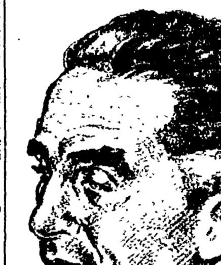
Il signor Prefetto telefonò a Roma. Proibito il cinema per i ragazzi pugliesi - A Corato, Ruvo, Terlizzi, Giovinazzo, Bitonto - La bandiera aspetta sulla strada maestra

Oplo. Appartiene alla serie delle cronache criminali filmate ed è dedicato, con tutte le referenze d'autenticità possibili, alla lotta contro gli stupefacenti organizzata dagli uffici in-