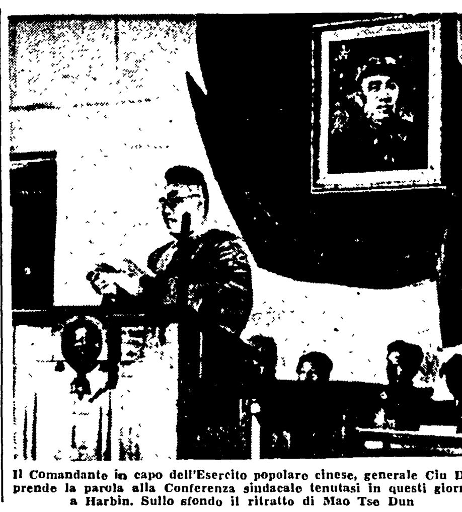
Il Comandante in capo dell'Esercito popolare ceco, generale Cio Di

LA CONFEDERAZIONE SINDACALE... solo se la Conferenza si deciderà a operare nei binari della normale prassi sindacale, secondo la stipulazione di un accordo è valido solo se stipulato da tutte le organizzazioni rappresentative della categoria. Il preteso accordo raggiunto dalla Conferenza è stato invece stipulato con organizzazioni che rappresentano solo la minoranza degli interessati.