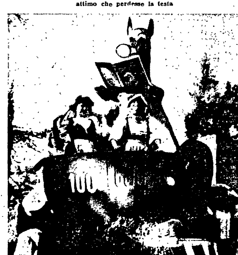
Uno strano animale fu visto per i viali. Era il canguro emulante della «Universale Economica». Leggeva con attenzione, muovendo curiosamente testa e occhi, mentre dalla sua pancia uscivano i volumi che venivano offerti ai passanti da alcuno graziose ciociere in costume. Sempre dal suo ventre capace uscivano anche musiche allegre, che colorivano il divertente spettacolo.