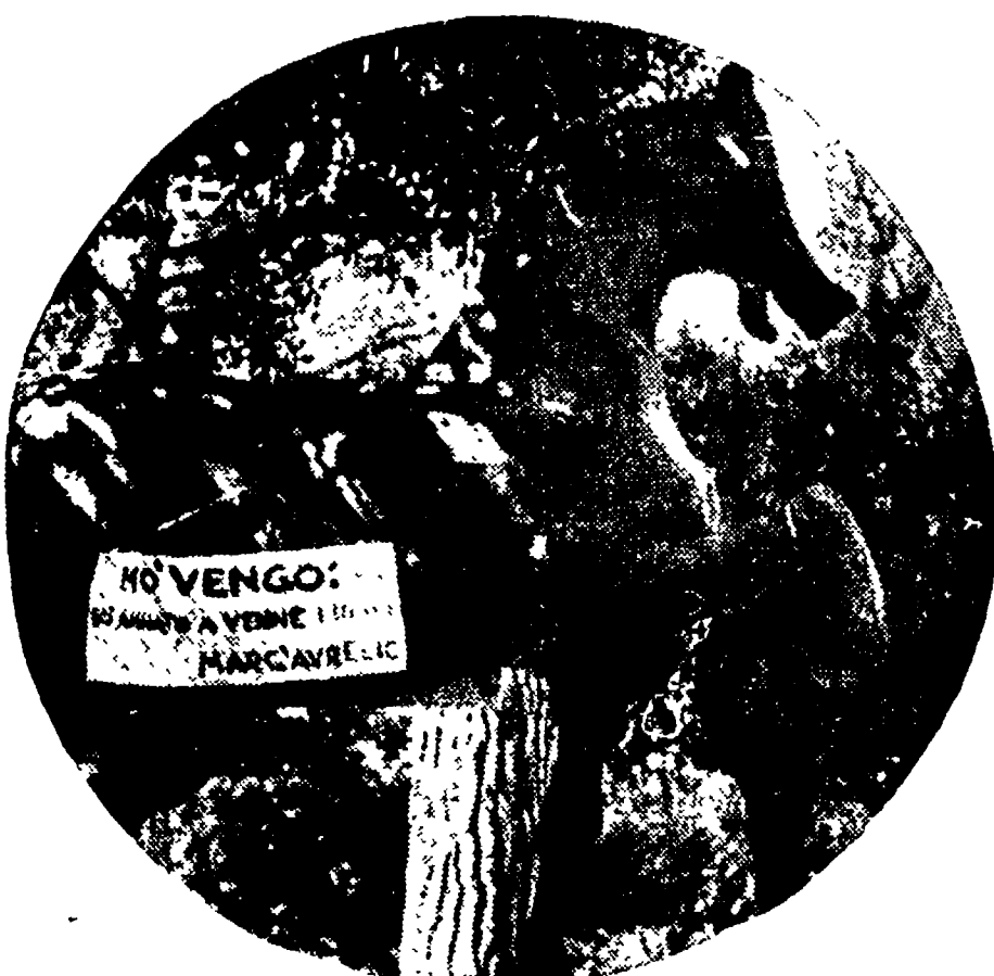
Anche il cavallo di Marco Aurelio è voluto venire alla Passeggiata Archeologica: però è rimasto solo, perché a un certo punto l'imperatore se ne è andato fra i ruderi a vedere «L'Unità».

150.000 romani hanno affollato domenica i viali della Passeggiata Archeologica uniti in una grande festa Popolare nel nome de «L'Unità». All'insegna della gioia e dell'entusiasmo, essi hanno portato un'altra pietra all'edificio ormai grandioso di una nuova tradizione: il «Mese della Stampa Comunista».