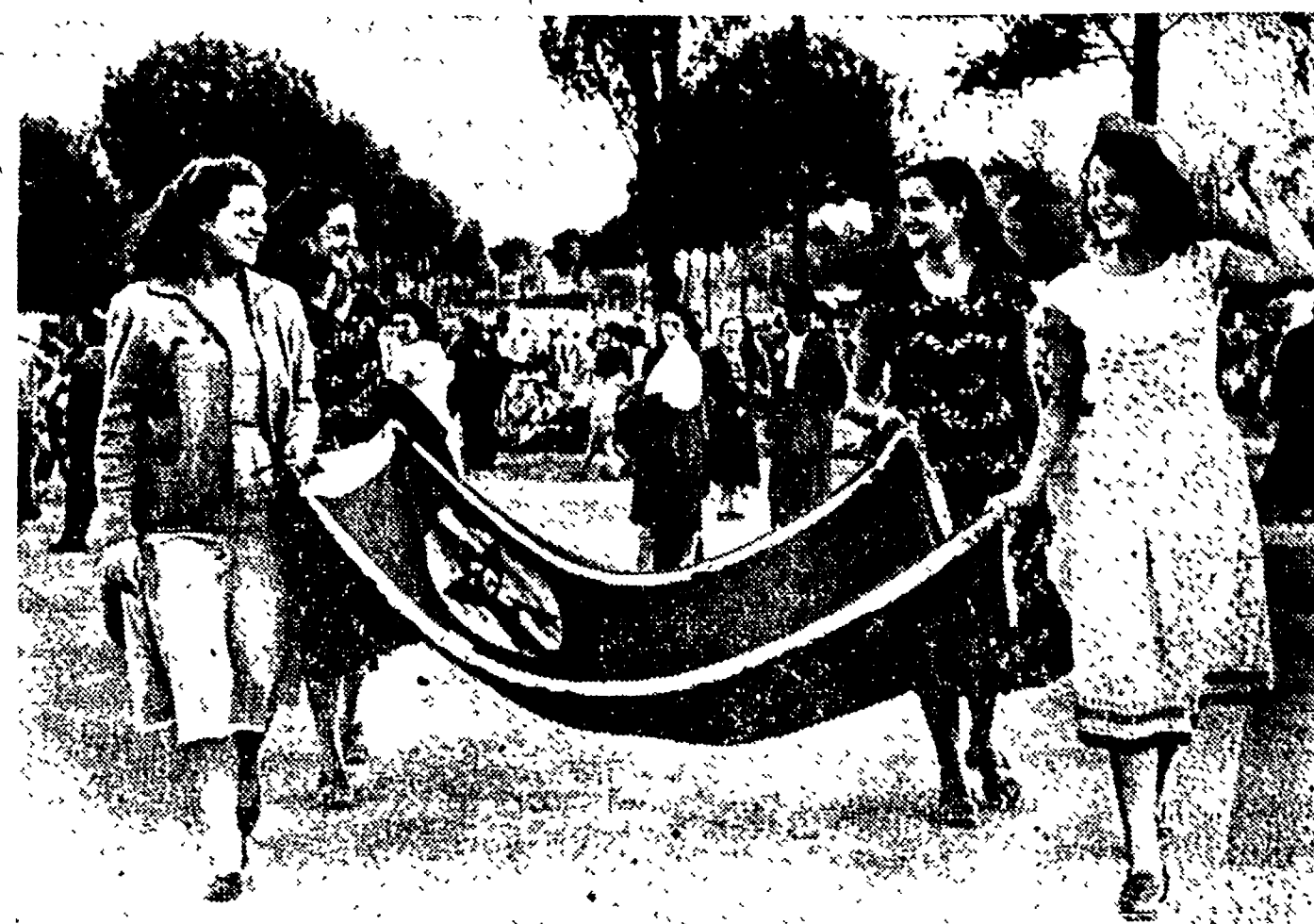
S'è iniziata la raccolta: piovano nei variopinti drappi le carte da dieci, cento, mille lire. Nessun compagno ha resistito all'invito e al sorriso di queste belle ragazze che sono tornate alla base piena di rol'i.

150.000 romani hanno affollato domenica i viali della Passeggiata Archeologica uniti in una grande festa Popolare nel nome de «L'Unità». All'insegna della gioia e dell'entusiasmo, essi hanno portato un'altra pietra all'edificio ormai grandioso di una nuova tradizione: il «Mese della Stampa Comunista».