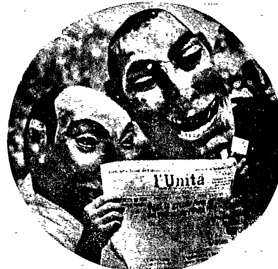
Non tutte le popolari se ne vedono di tutti i colori. Ma lei (tipi così non ne avevamo veduti mai, noi. A un certo punto un maschio ha gridato, indicando quello a sinistra: «A papà! Anvedi! Iba!». Abbiamo visto il mascherone impallidire e abbiamo temuto per un attimo che perdesse la testa.