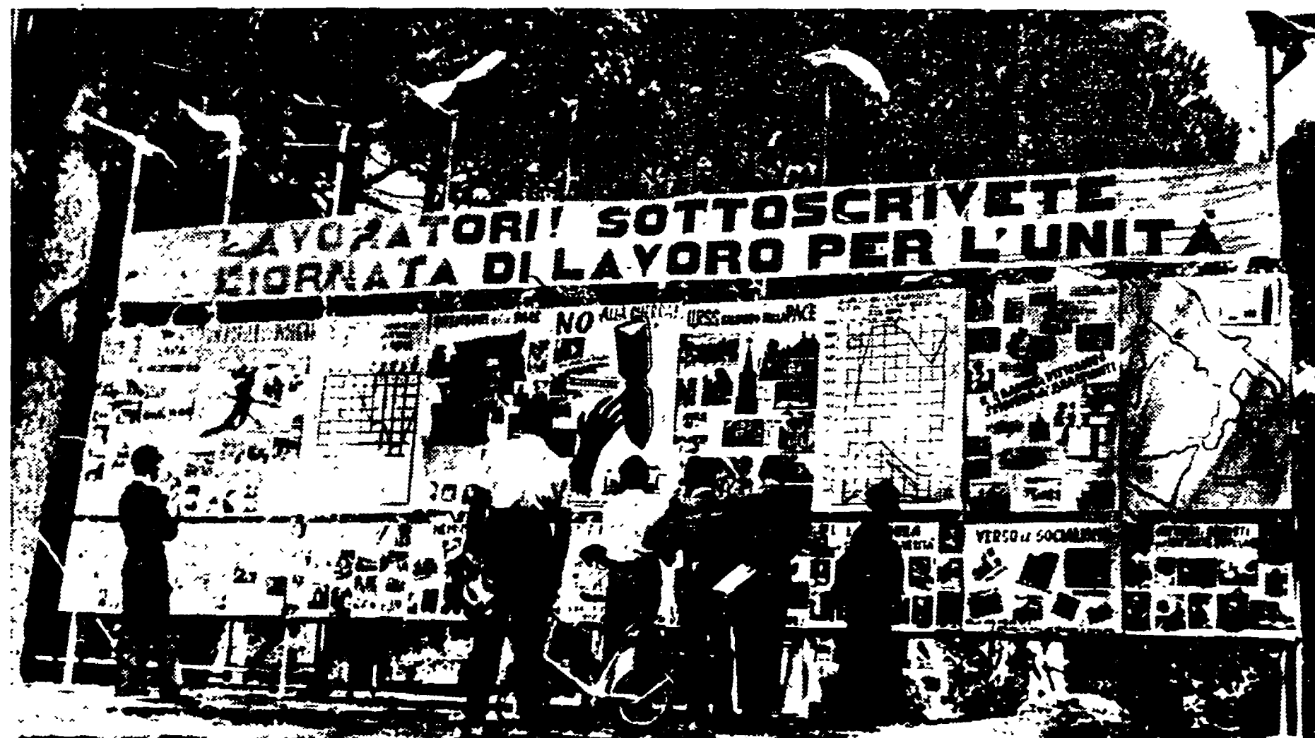
Al limite di un declivio, perfetto nella sua lineare chiarezza di colori e di armature d'acciaio, faceva spicco lo «stand» allestito da «L'Unità». Sui suoi pannelli, amorosamente preparati da un gruppo di redattori, si leggeva la lotta delle forze della pace, la lotta della stampa comunista per la verità e contro l'imperialismo.