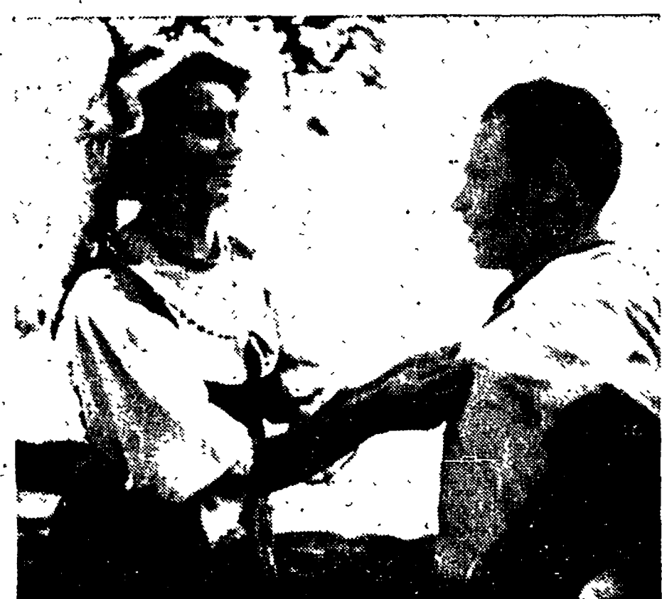
L'eroe delle belle cose non faceva nessuna fatica nel piazzare allo oculo del passante le coccarde abbinata alla lotteria. C'era anzi chi, attratto da tanta grazia femminile e dalla speranza di un ricco premio, offriva volentieri il petto al fregio, e facilmente si lasciava decorare.