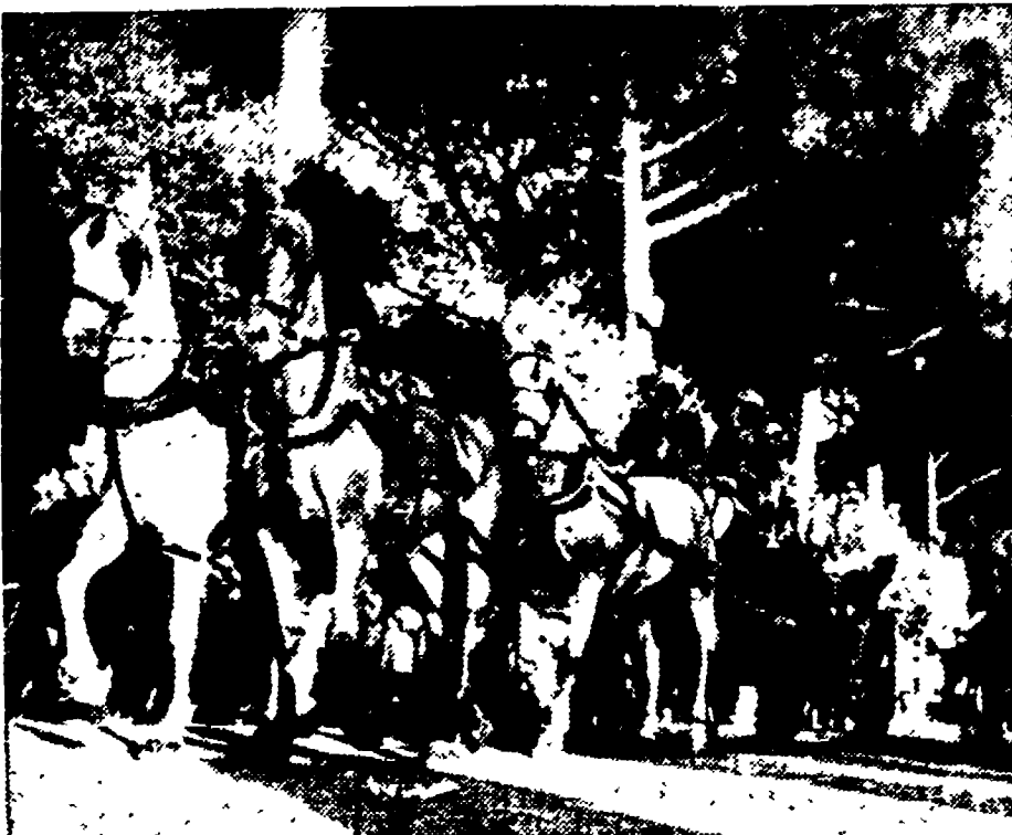
Lucresia Borgia e il Duca Valentino, con un magnifico tiro a quattro con due palafrenieri e un valletto hanno fatto la loro comparsa nei viali annunciando il prossimo romanzo d'appendice de «L'Unità».