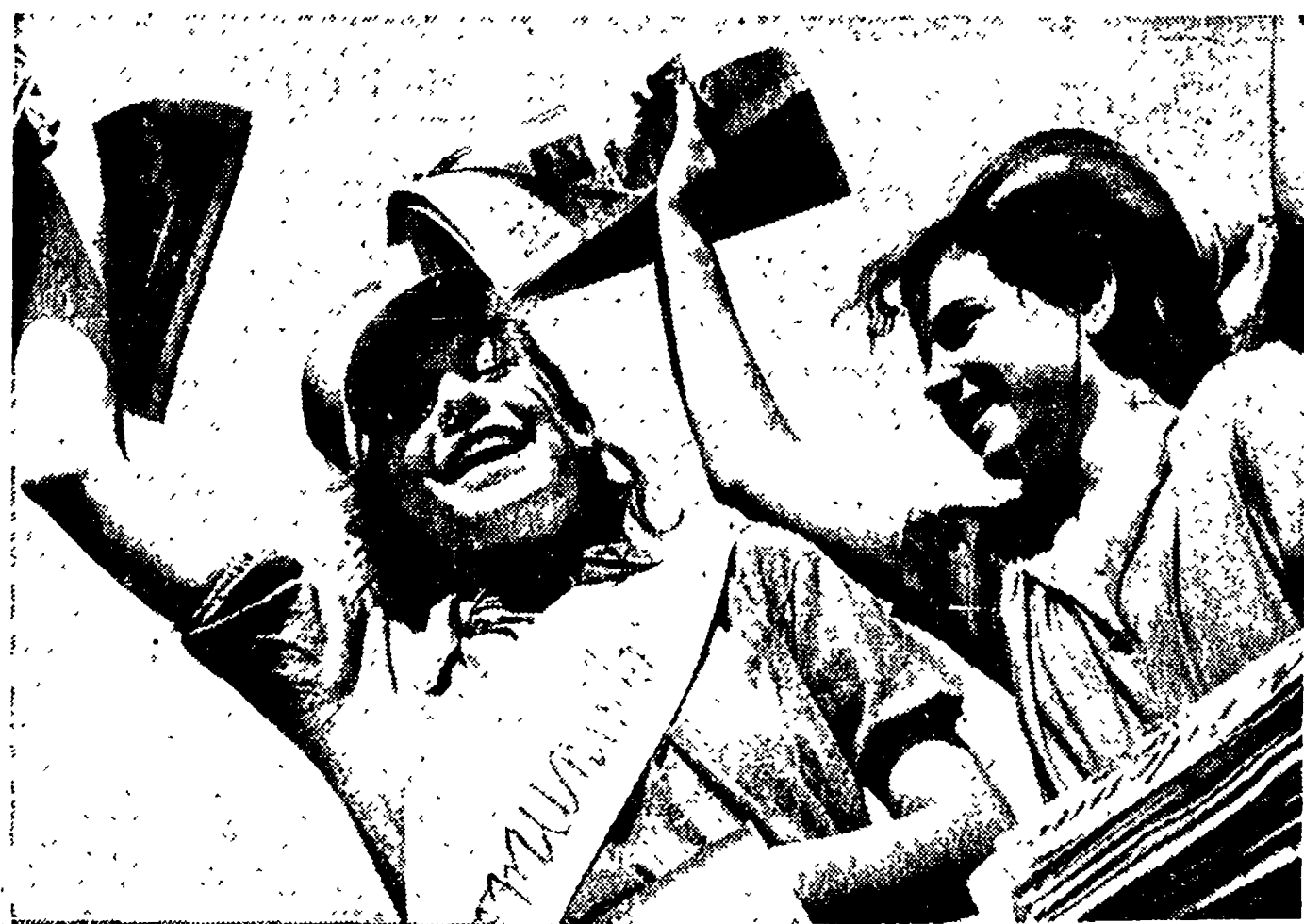
«L'Unità», «Vie Nuove», «Noi donne!», tutti i titoli della stampa comunista risaltavano, gagliardamente gridati da queste caratteristiche «strillone», che in pochi minuti davano fondo ai pacchi di copie.

Avanti verso il nuovo obiettivo di 15 milioni!