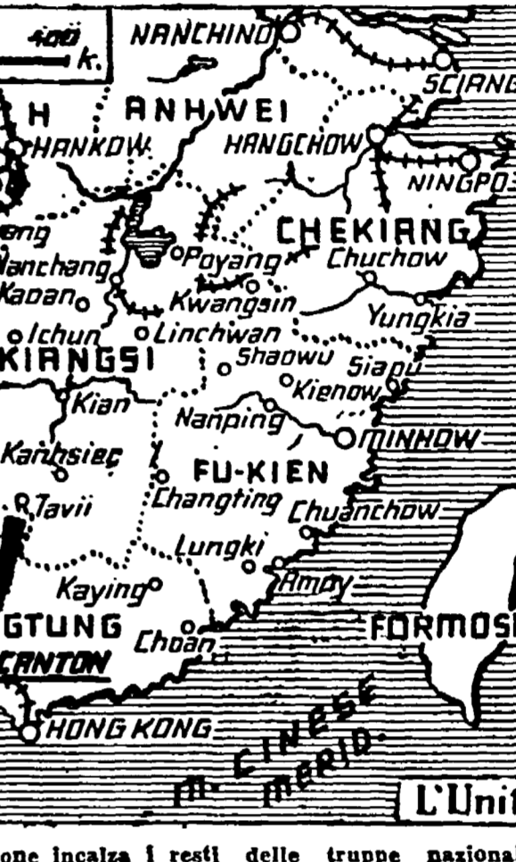
L'Esercito di liberazione incalza i resti delle truppe nazionaliste

La manovra dell'Armata popolare si svolge a tenaglia, facendo centro su Canton, il porto fluviale di Uai Chou e il porto di Suatou. I nazionalisti tentano invece, fino a questo momento, di mantenersi in un corridoio aperto per il ripiegamento verso il mare, in direzione di Hanchow, mentre una colonna forte di trecento uomini punta direttamente verso sud, in direzione di Chung King, seguendo l'alto corso dello Yang Tse Kiang.