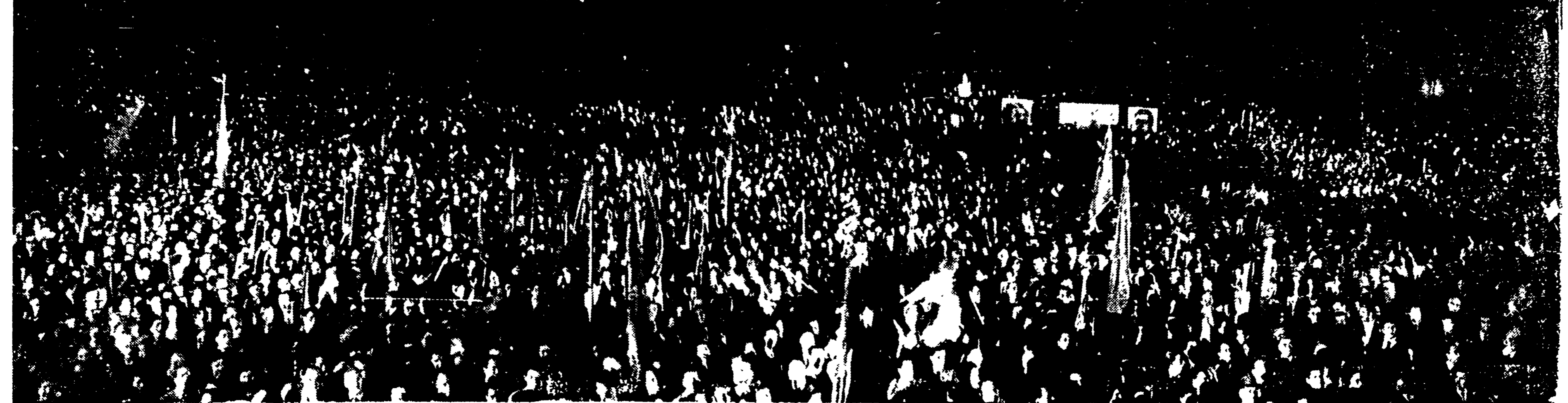
Un'eccezionale panoramica della grande manifestazione che ha visto domenica il popolo romano raccolto attorno allo Stato Maggiore della Pace

Domani pubblicheremo il testo delle RISOLUZIONI FINALI votate dal Comitato Mondiale della Pace