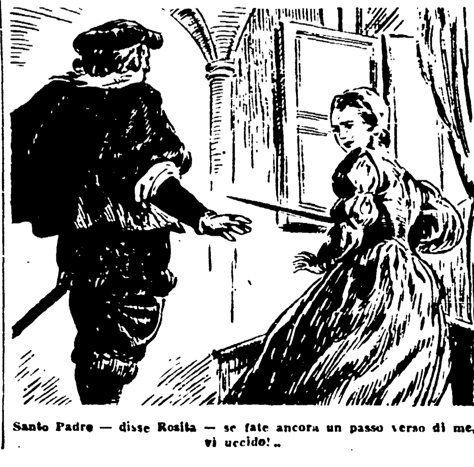
Santo Padre — disse Rosita — se fate ancora un passo verso di me, vi uccido!

«Rosita è allontana, con gli occhi spalancati, le mani giunte, pronta ad inginocchiarsi. Aveva mormorato: «Il Papa... Il Sommo Pontefice...»