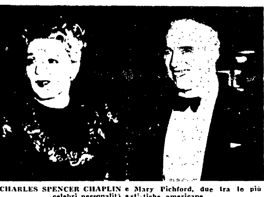
CHARLES SPENCER CHAPLIN e Mary Pickford, due tra le più celebri personalità artistiche americane