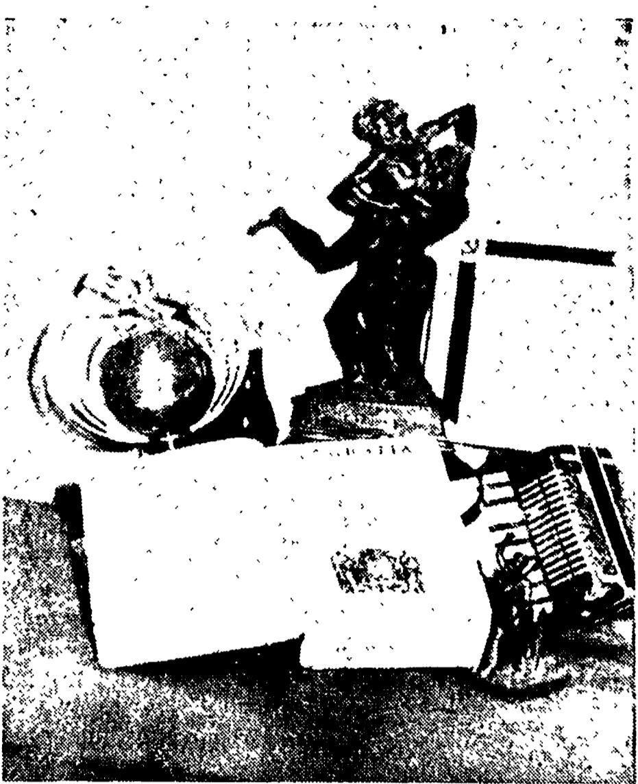
DONI PER IL 70 COMPLEANNO DI STALIN. Continuano da tutta Italia a pervenire i doni al Capo del Paese del Socialismo...