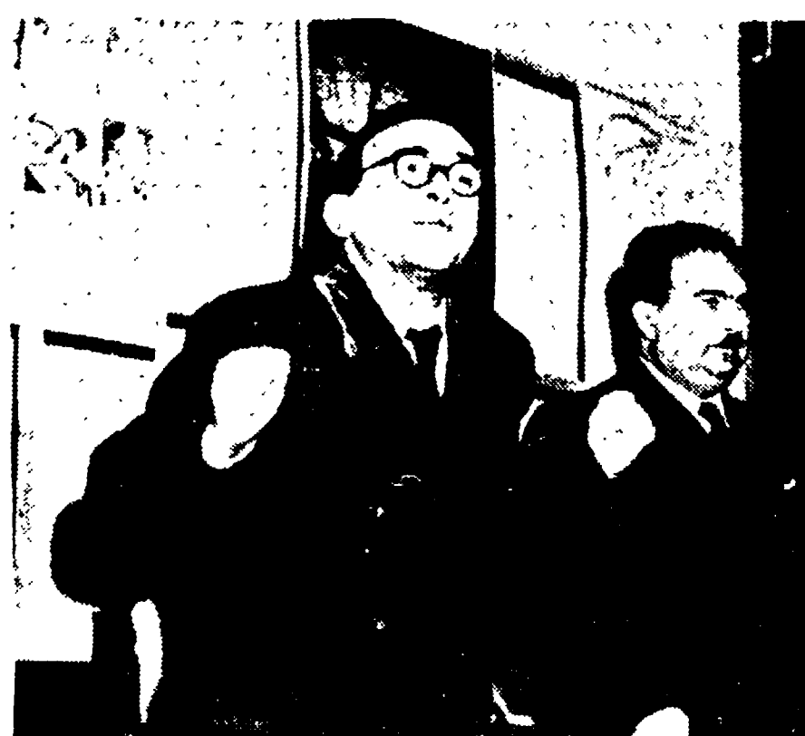
Con questo volto e con questo atteggiamento appartengono all'on. La Pira, Sottosegretario al Lavoro) il governo ha portato il suo caldo saluto all'Assemblea della Confindustria. A sinistra dell'on. La Pira, l'on. Mastino del Rho non si degnò di esprimere neppure un minimo di riconoscimento per la fatica del Sottosegretario.