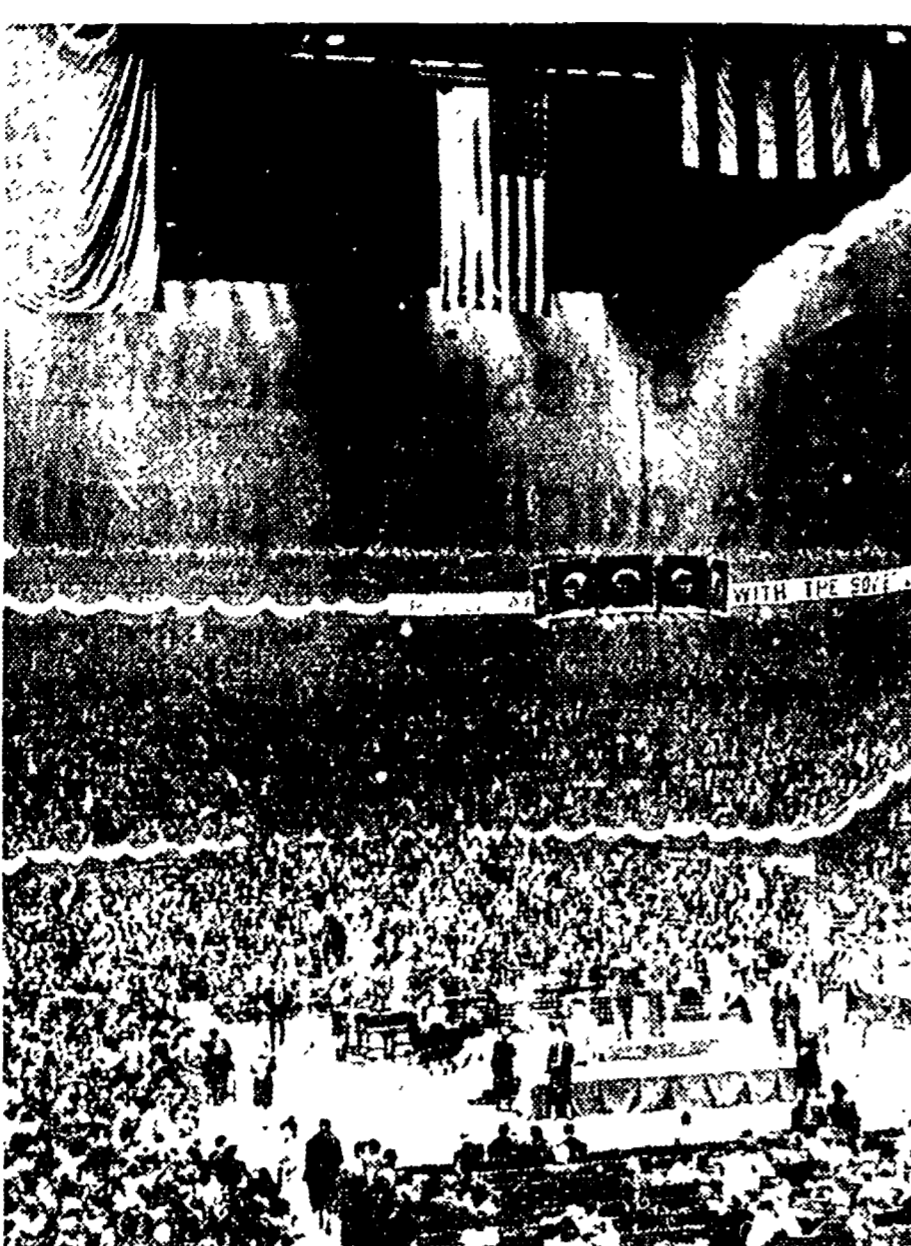
NEW YORK — Una veduta parziale di «Madison Square Garden» durante una recente manifestazione per l'amicizia con l'Unione Sovietica...