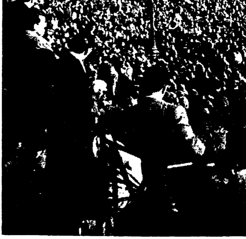
Una veduta dell'imponente comizio degli statali al Colosseo

Una veduta dell'imponente comizio degli statali al Colosseo. La mattina era tiepida. Si poteva girare in giacchetta e metà dicembre!