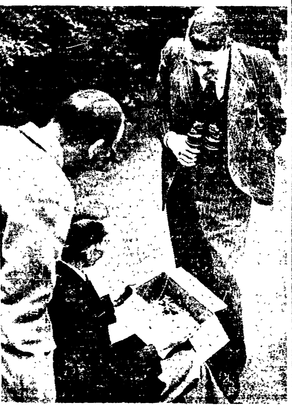
LONDRA - Nel parco di Hyde Park, uno dei giardini più noti del mondo, la vecchia inghilterra rievoca le sue tradizioni...

La borghesia inglese ha varcato la metà del secolo con malinconici bilanci e con più buie previsioni per quanto concerne il prossimo futuro