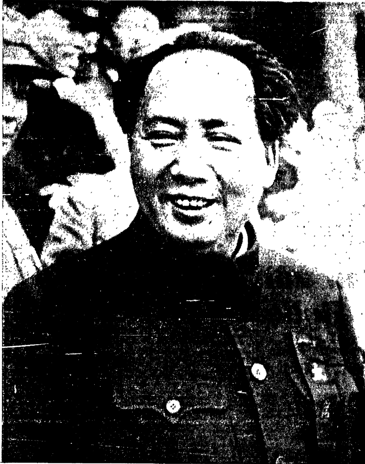
MAO TZE TUN: l'uomo che per vent'anni ha guidato la lotta per la liberazione del suo paese dall'imperialismo. 400 milioni di cinesi vedono nel suo volto sorridente la garanzia di un più felice avvenire