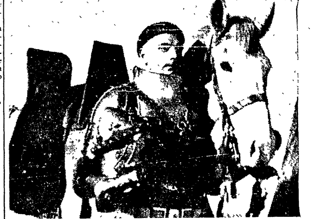
Laurence Olivier in « Enrico V » offre un saggio esemplare di recitazione cinematografica...

Il testo teatrale dell'« Enrico V » di Shakespeare è un invito al cinema: « invito enunciato fin dalle prime parole del coro, che esorta la fantasia dello spettatore a dimenticare il «trespalo da galli» del palcoscenico del teatro Globe...»