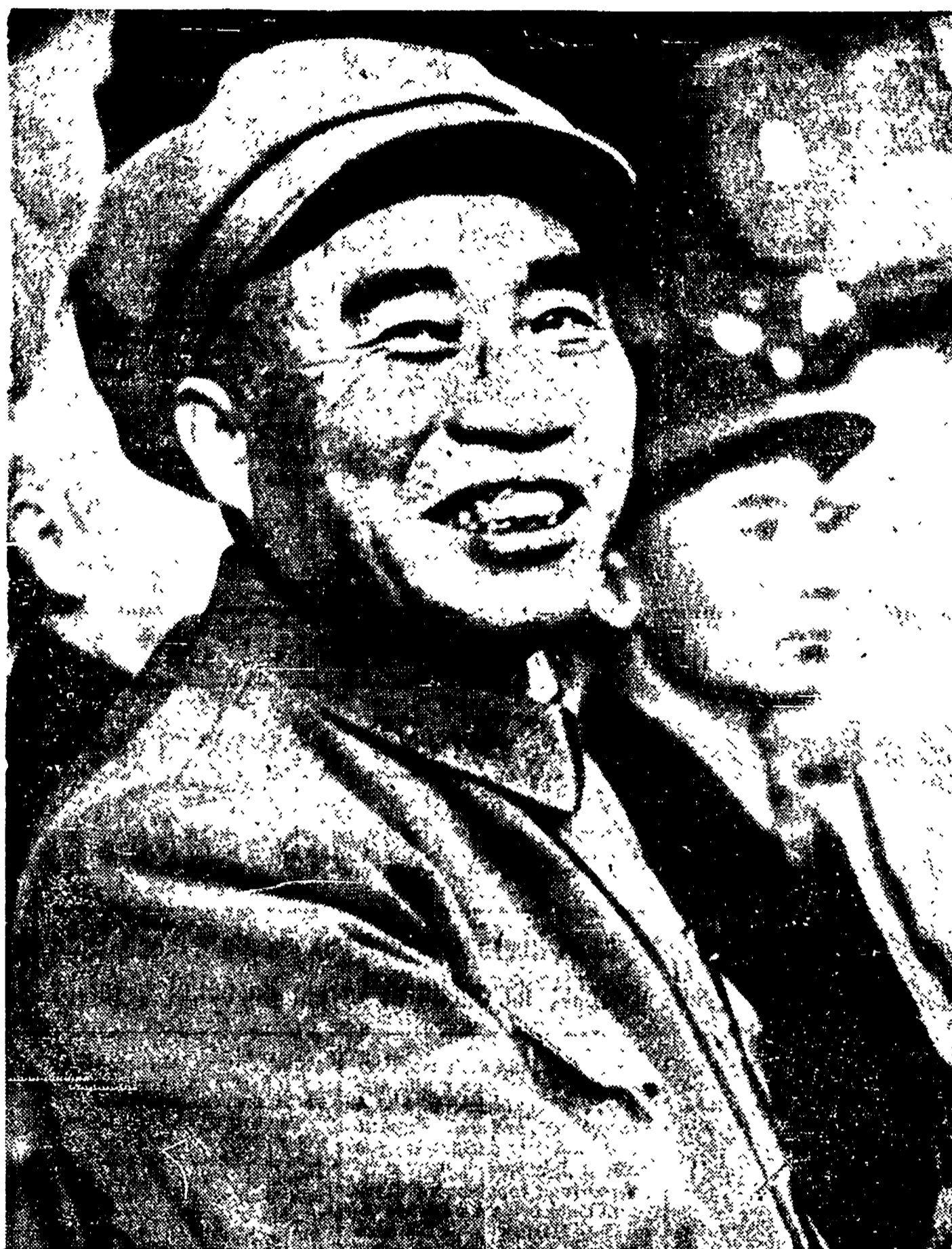
CIU' DE': il capo dell'Armata popolare di liberazione. E' uno dei più vecchi militanti del P. Comunista Cinese, venerato dai suoi soldati e dal popolo che vedono in lui il simbolo della vittoria militare