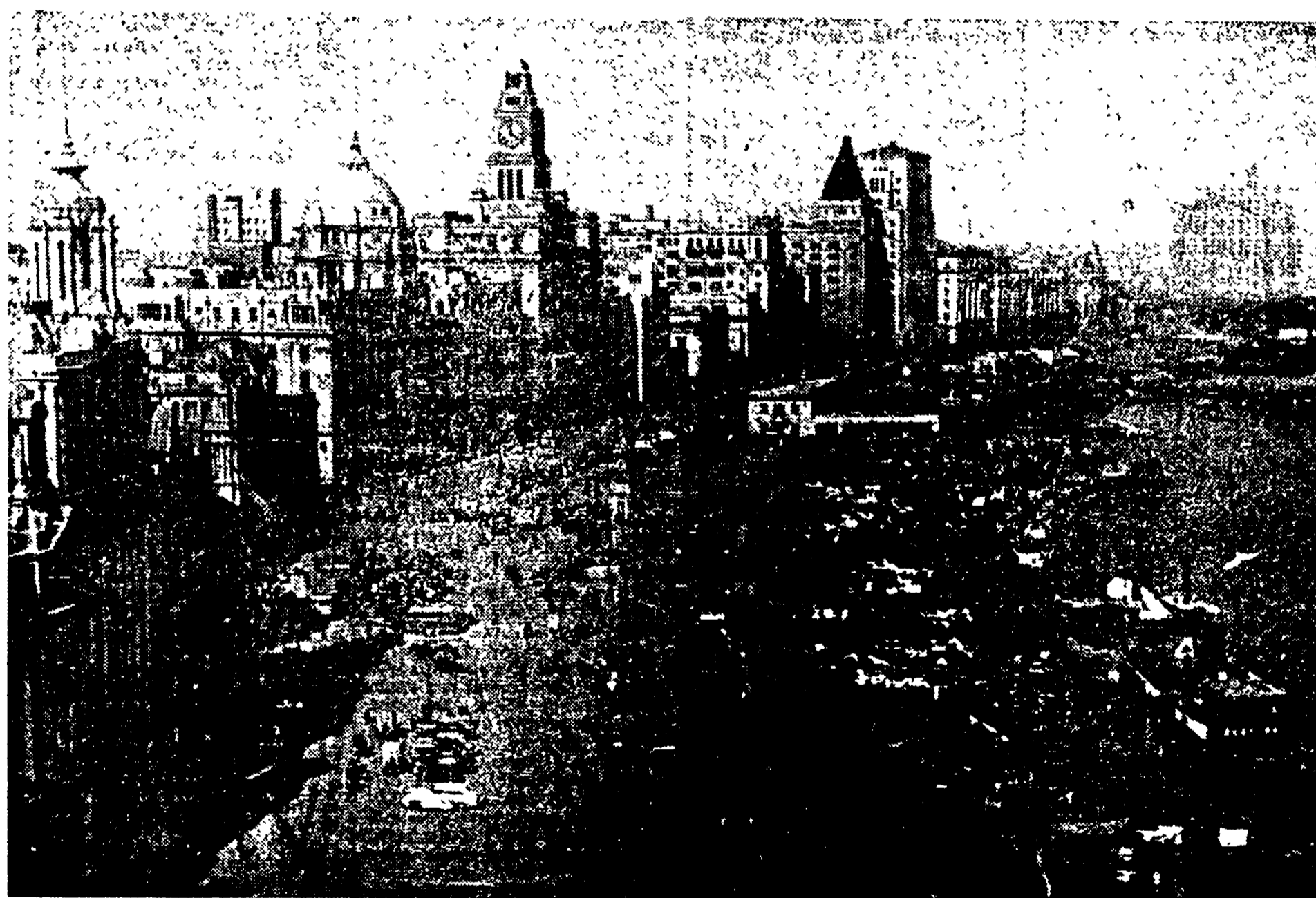
SCIANGAI: la grande città dove la corruzione dei nazionalisti e degli americani aveva trovato il crogiuolo in cui fendersi. In questa immensa strada, il Bund, avevano sede le imprese commerciali dei colonizzatori: oggi è il cuore della vita commerciale di un grande paese libero. La fotografia è stata presa nel mese di gennaio