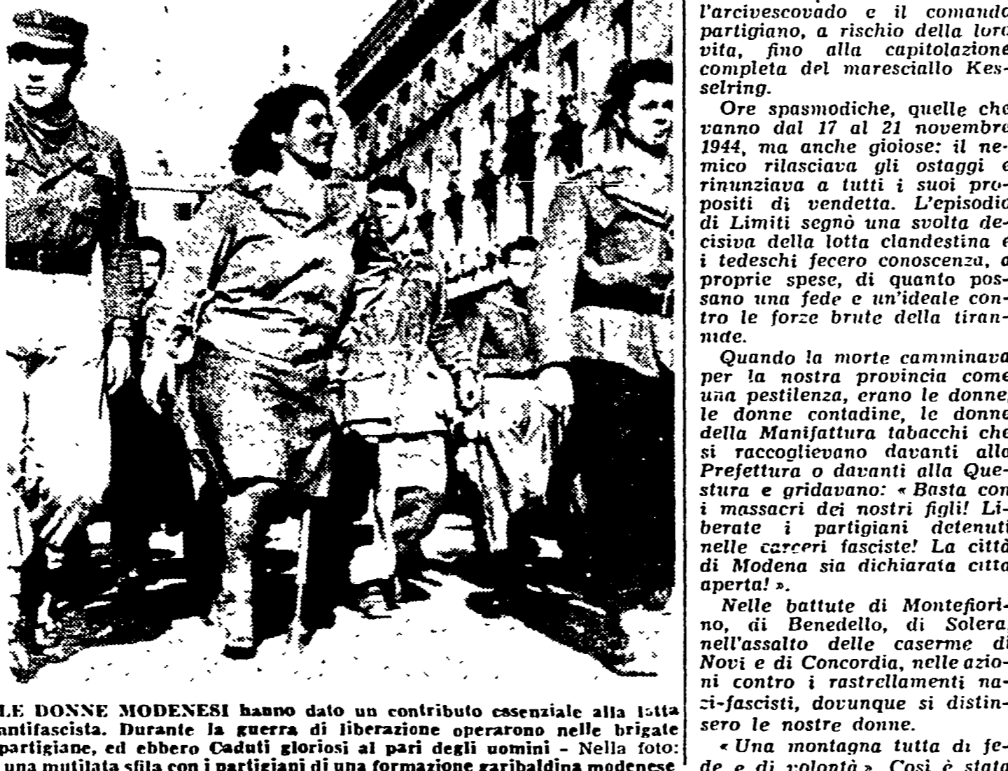
LE DONNE MODENESI HANNO DATO UN CONTRIBUTO ESSENZIALE ALLA Lotta antifascista. Durante la guerra di liberazione operarono nelle brigate partigiane, ed ebbero Caduti gloriosi ai pari degli uomini - Nella foto una mutilata sfilata con i partigiani di una formazione garibaldina modenese