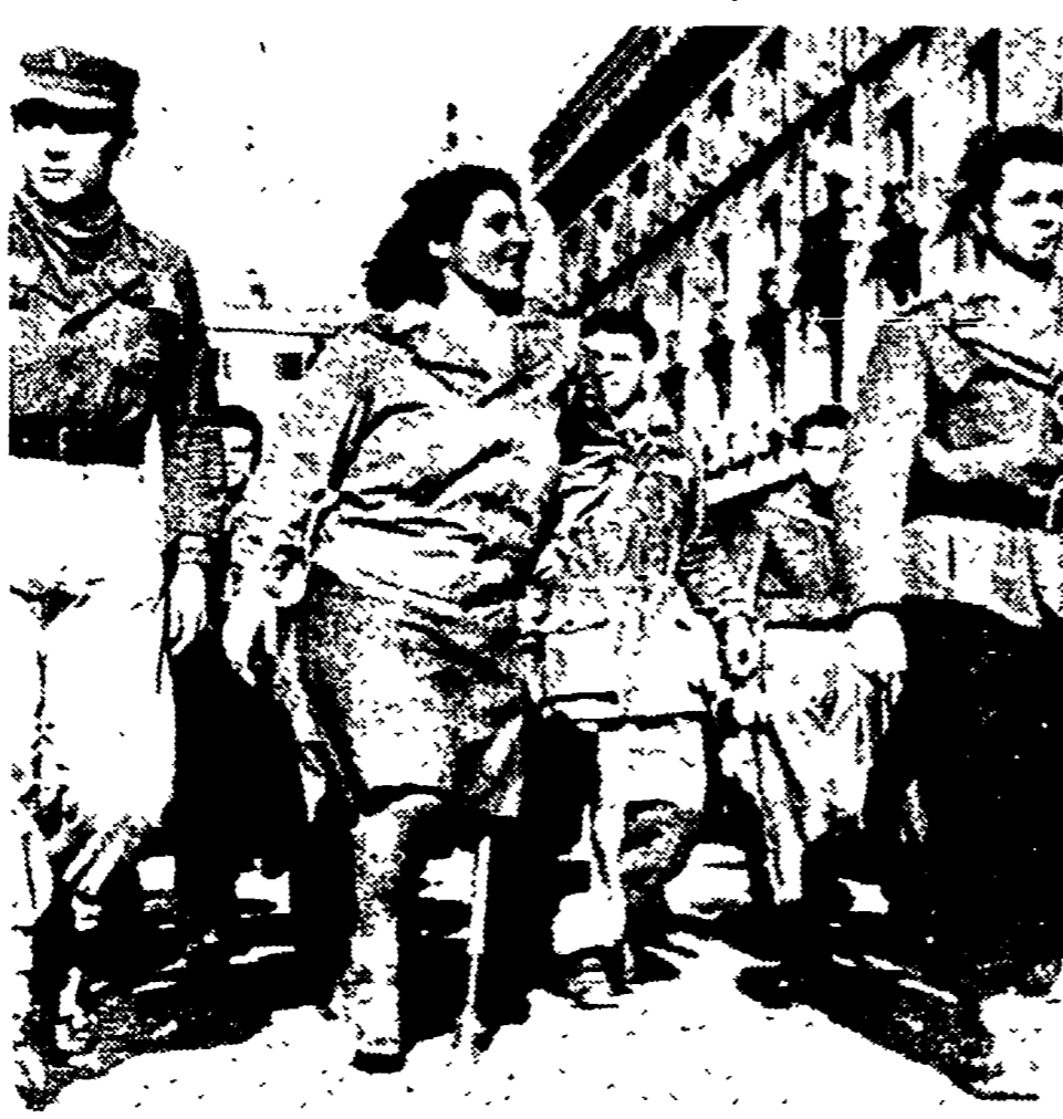
LE DONNE MODENESI hanno dato un contributo essenziale alla lotta antifascista. Durante la guerra di liberazione operarono nelle brigate partigiane, ed ebbero Caduti gloriosi ai pari degli uomini...