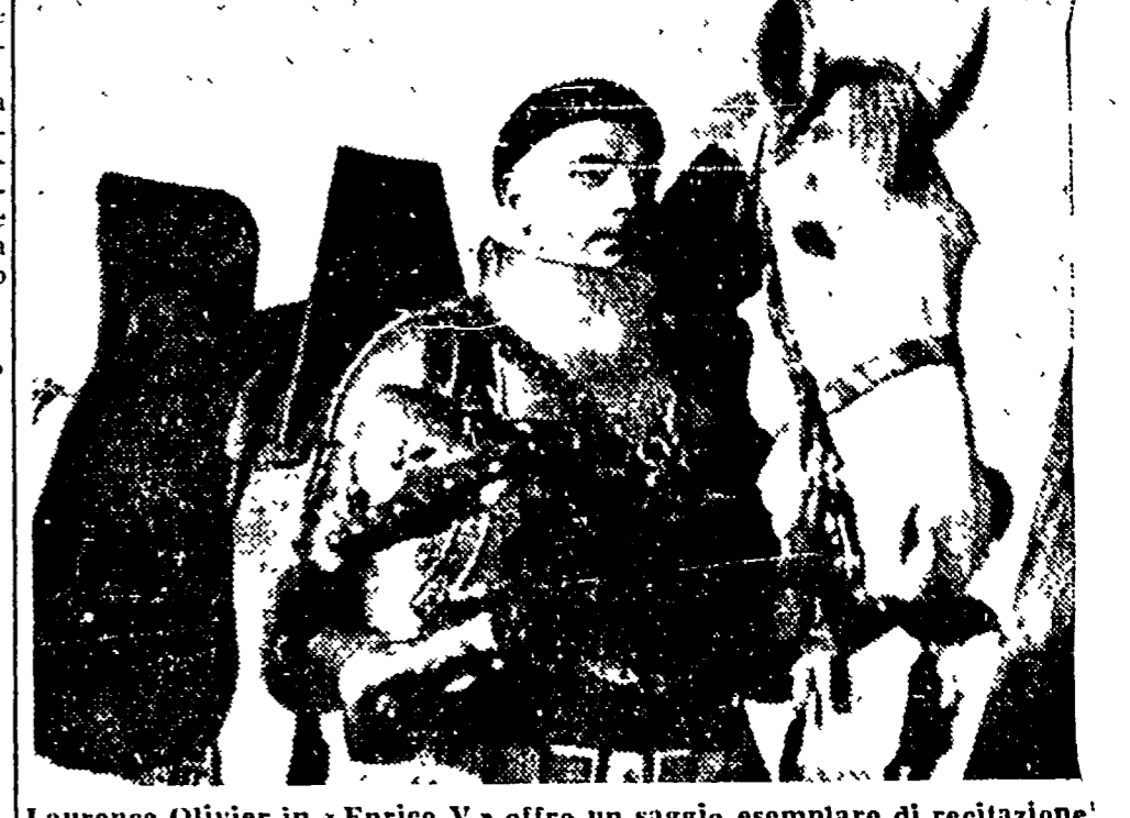
Laurence Olivier in « Enrico V » offre un saggio esemplare di recitazione cinematografica: la scena del monologo di Enrico prima della battaglia di Agincourt rivela uno dei più straordinari interpreti dello schermo

La figura di Enrico V, e il testo teatrale dell'« Enrico V ». Laurence Olivier ha prescelto la figura di Enrico V per il suo primo tentativo di tradurre cinematograficamente un dramma di Shakespeare, cui doveva seguire, questo dopo il « Enrico VIII », un altro « Enrico V », che ha ottenuto dovunque un immenso successo.