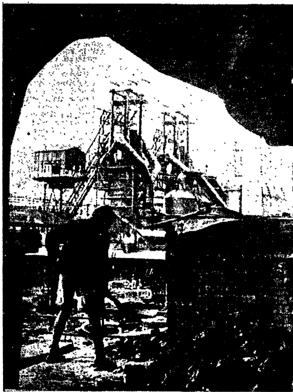
IL PRESENTE: si ricostruisce il potenziale industriale della Manciuria. A Mukden, in queste grandi acciaierie, possono trovare lavoro 250.000 operai: esse forniranno macchine per l'agricoltura e l'industria