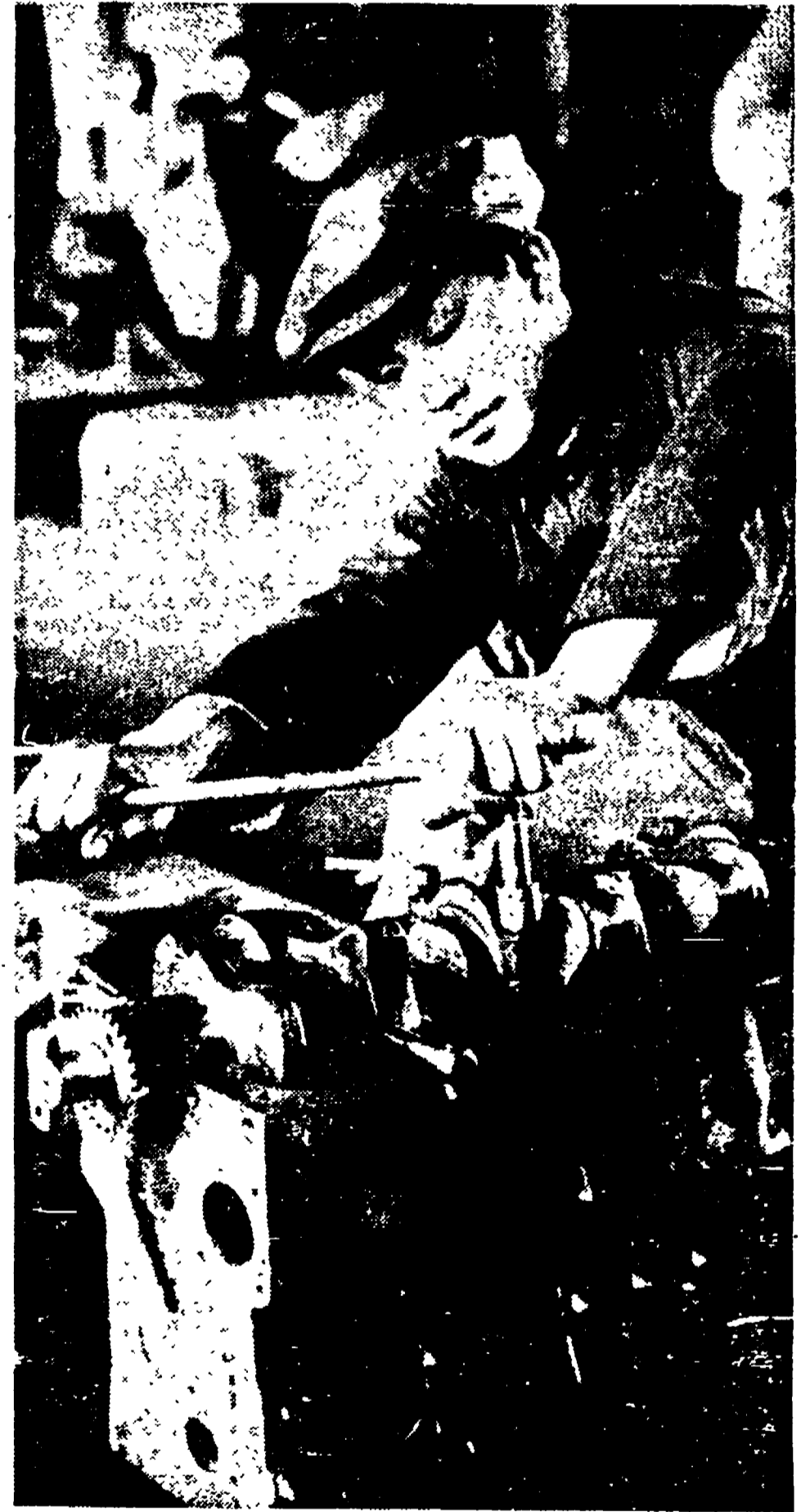
SI LAVORA alle nuove macchine. Un immenso paese sfruttato per secoli ha bisogno di milioni e milioni di nuovi strumenti di lavoro. Entro 10 anni, ha detto Mao Tze Tun, la Cina dovrà raggiungere un alto livello industriale