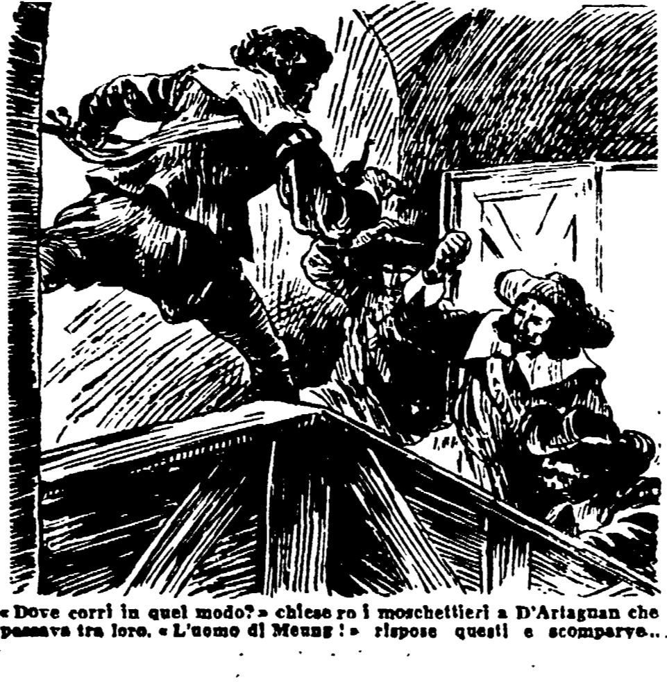
«Dove corri in quel modo?», chiese a i moschettieri a D'Artagnan che passava tra loro. «L'uomo di Meung?», rispose questi e scomparve...