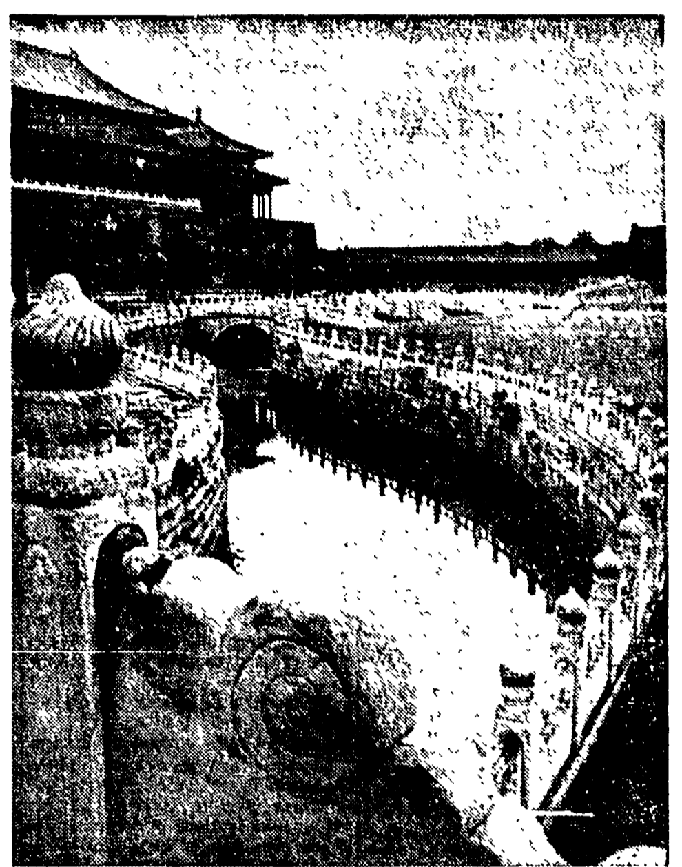
IL PASSATO: tra i ricami di questa vecchia architettura vissero per secoli gli imperatori della Cina feudale; ma qui nel 1949 sono state gettate le basi costituzionali della nuova Cina popolare