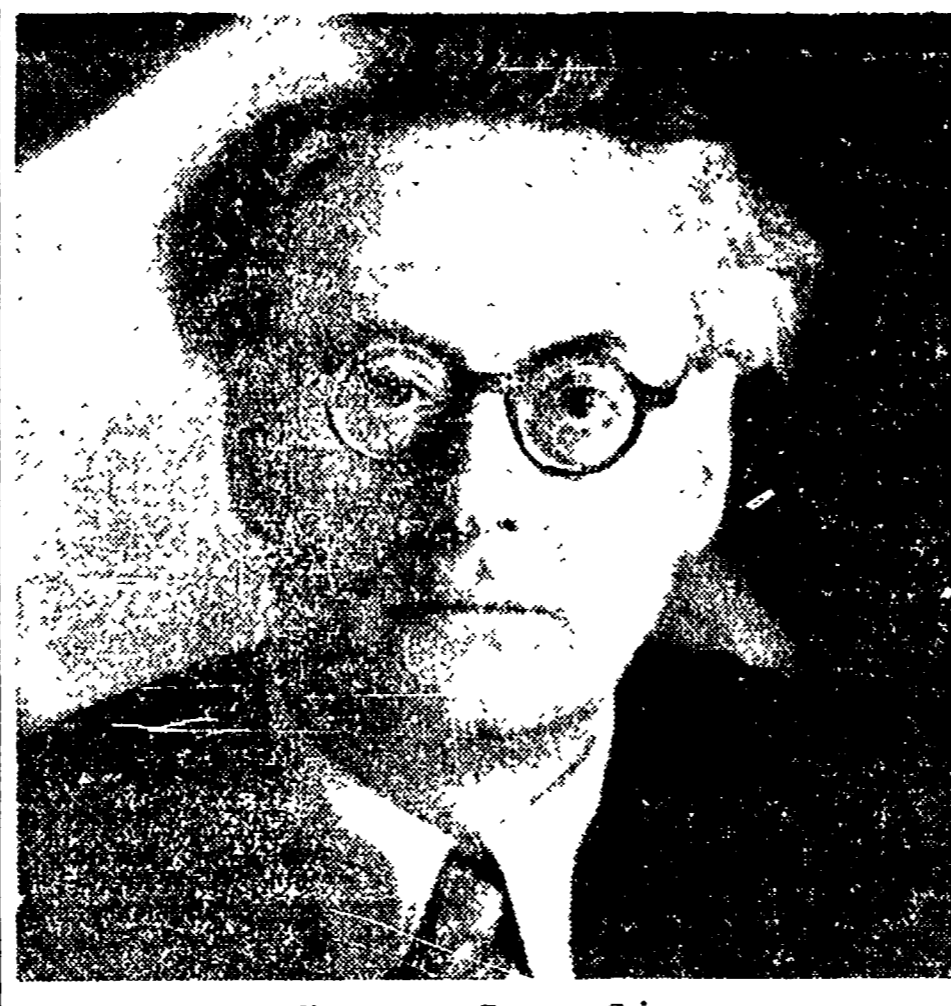
Il compagno Ruggero Grieco