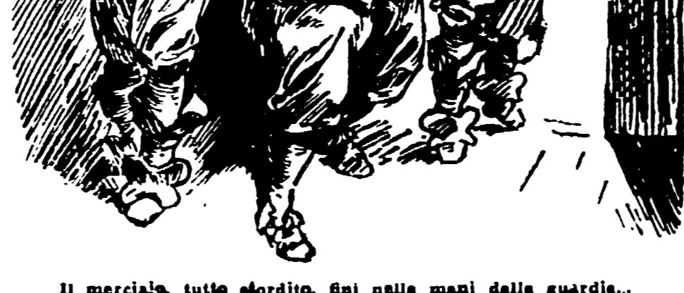
Il mercante, tutto sordido, sui nelle mani delle guardie...