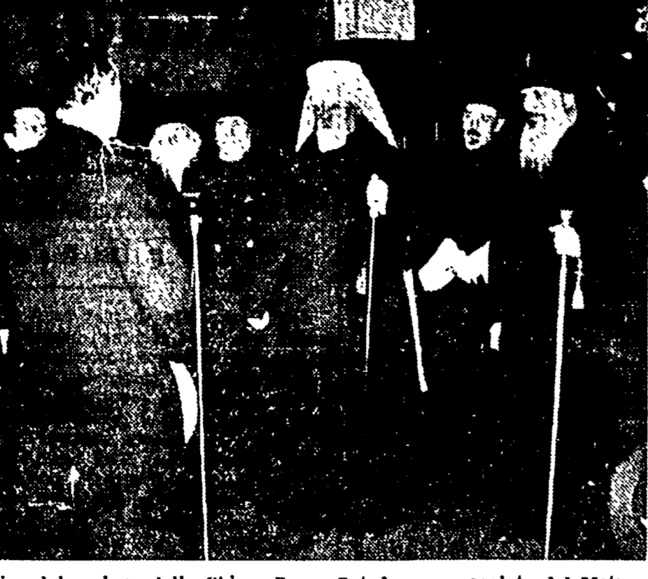
Una delegazione della Chiesa Russa Ortodossa, capeggiata dal Metropolita Nicolai, vicario del Patriarca di Mosca e di Russia, è arrivata a Praga nei primi giorni di febbraio. Ad accogliere gli ospiti alla stazione si trovavano membri del Governo Insieme all'Esarca di Cecoslovacchia e Metropolita di Praga, Xitelvi.