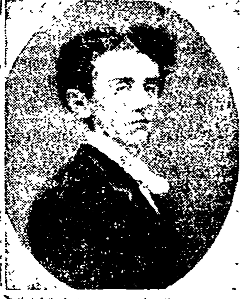
Carlo Dossi adolescente