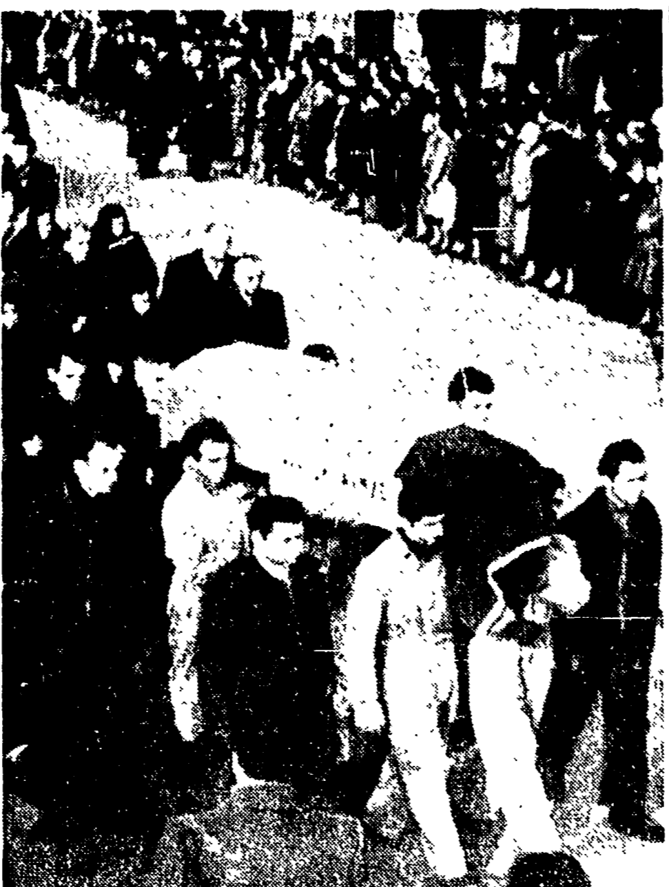
DOMANI, in occasione del trigesimo del barbaro eccidio di Modena, pubblicheremo una speciale pagina di scritti e documentazioni sui particolari della strage, sui Caduti e le loro famiglie, e sulle tradizioni di lotta delle masse popolari modenesi