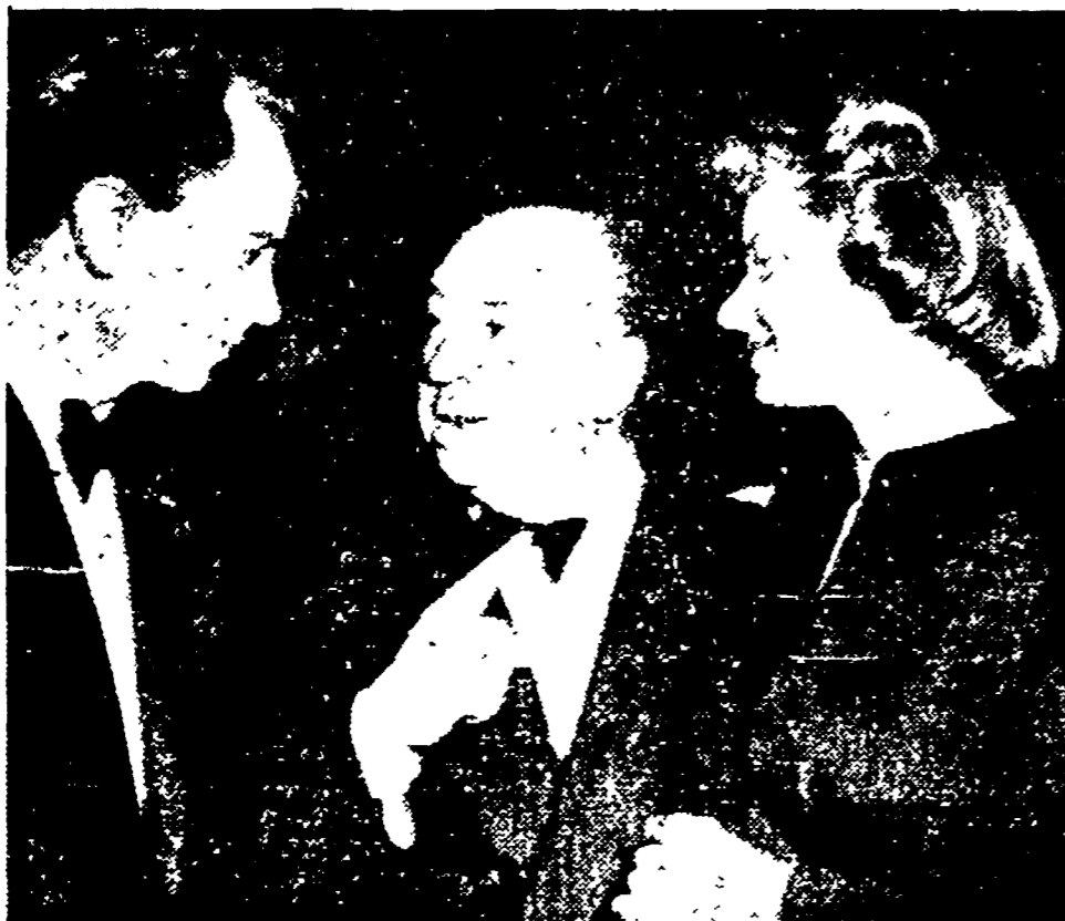
HOLLYWOOD - Una delle ultime foto americane di Ingrid Bergman con il marito Peter Lindstrom. L'attrice svedese, dopo la nascita di Roberto Rossellini jr., è oggetto di una campagna denigratoria di tipo puritano e razzista.

«La cosa c'entrì il cinematografo in tutto questo, nonché la civiltà dei costumi di cui si parla nei manuali, non è il lavoro, è un «questo» che solo un culture esperto dei valori spirituali dell'Occidente può sapientemente risolvere. L. P.