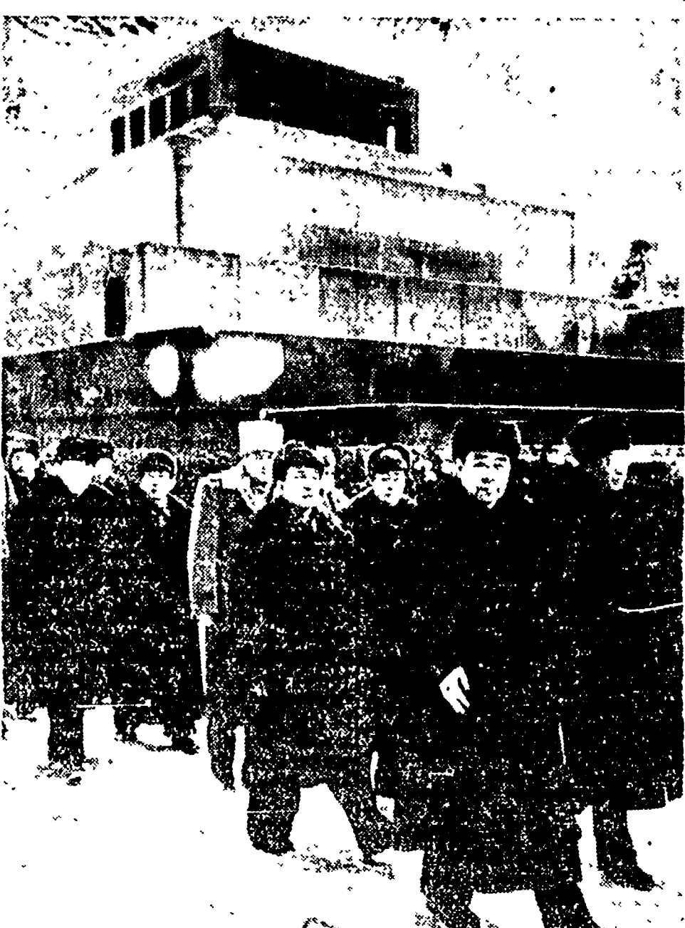
MOSCA - Giou En-Lai, Ministro degli Esteri della Repubblica Popolare Cinese, fotografato alla Piazza Rossa al ritorno dalla visita al Mausoleo di Lenin