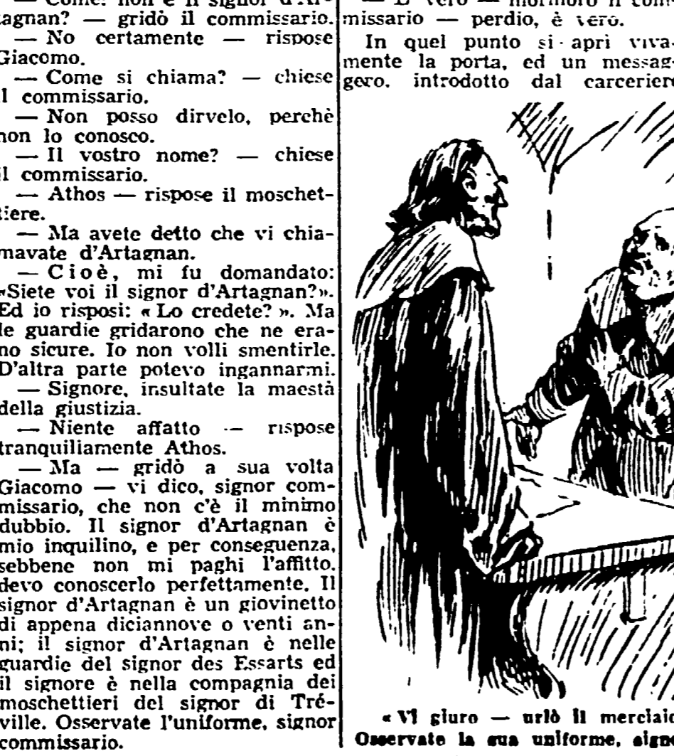
«Vi giuro — urlò il merciaio — che costui non è d'Artagnan! Osservate la sua uniforme, signor commissario...»

— Come! non è il signor d'Artagnan? — gridò il commissario. — No certamente — rispose Giacomo.