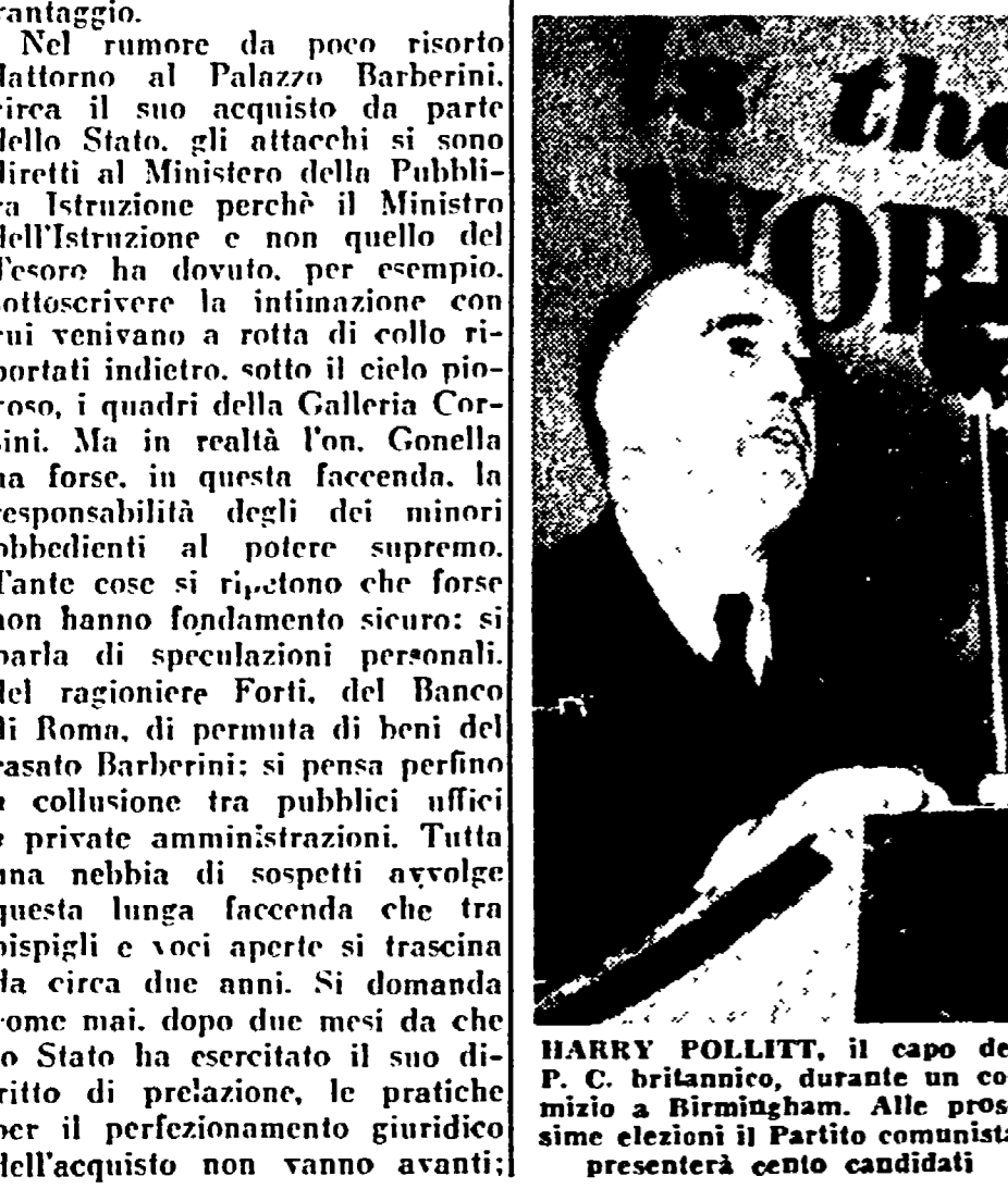
HARRY POLLITT, il capo del P. C. britannico, durante un comizio elettorale al Parlamento.