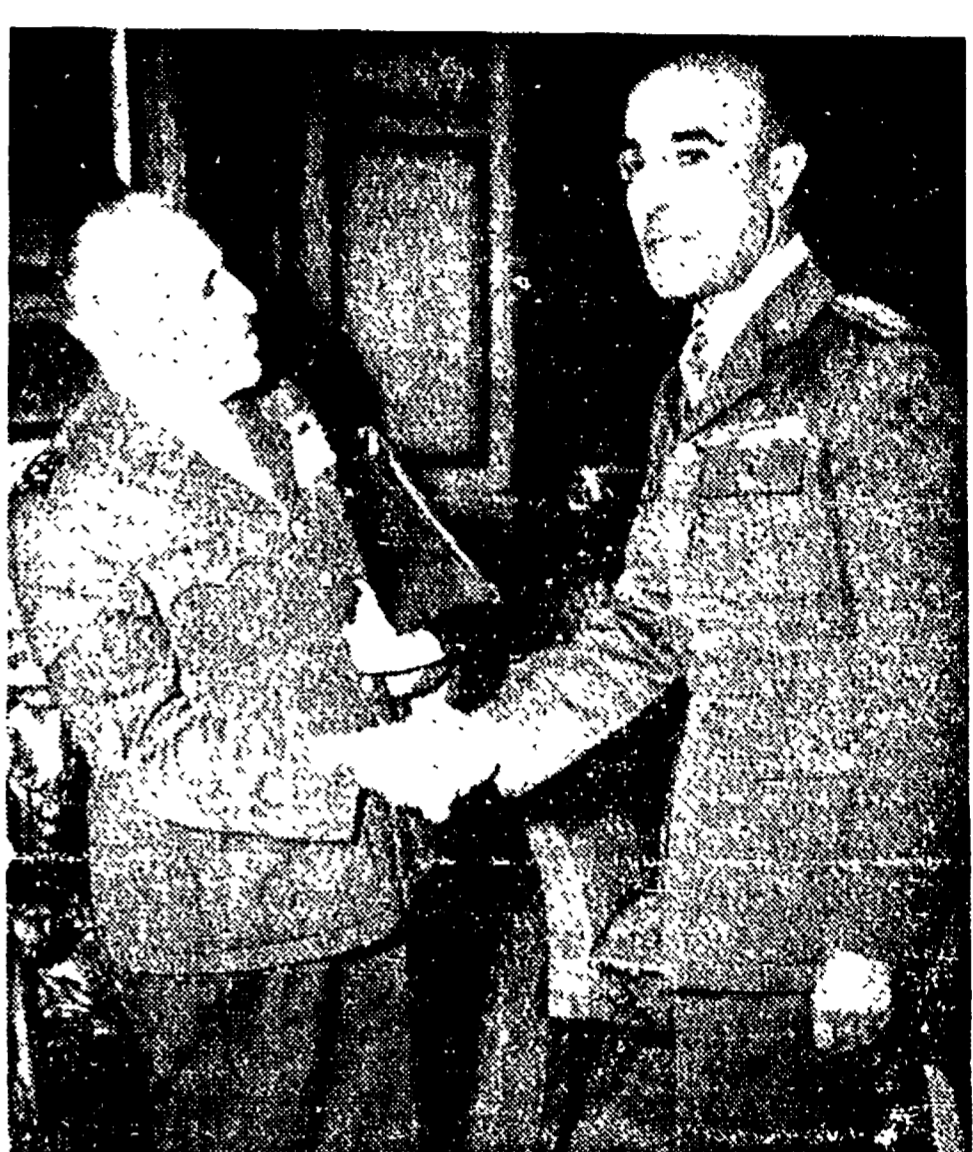
Una calorosa stretta di mano tra il gen. Elisio Marras e il generale francese Revers in occasione di un loro incontro nel settembre scorso a Parigi per la riunione dei Capì di Stato Maggiore dei paesi «alliedati». - Come è noto in questi giorni Revers è al centro di un gigantesco scandalo scoppiato in Francia per aver rivelato documenti segreti sulla guerra in Indocina.