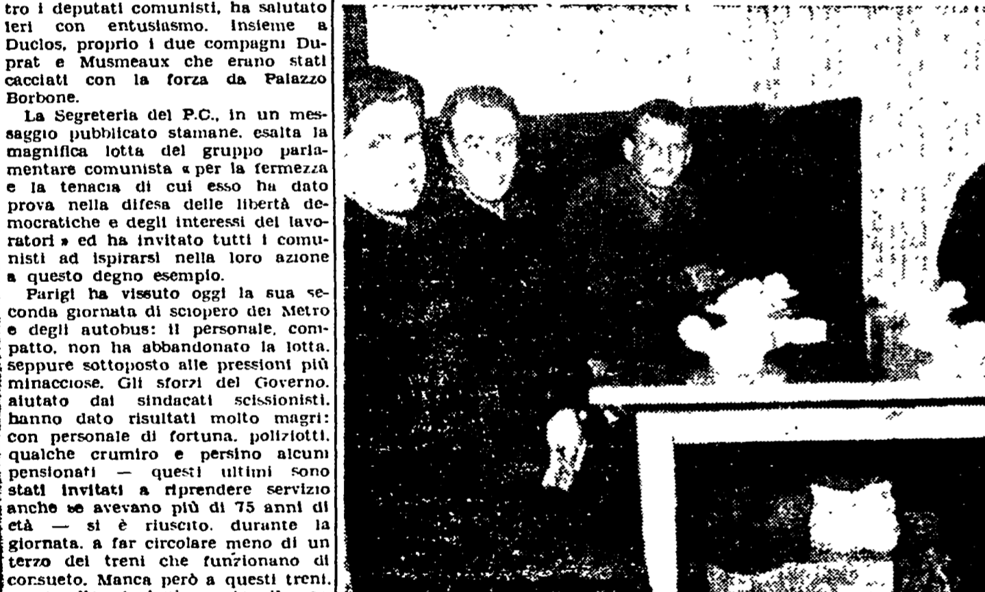
VIENNA. - Un secondo scaglione di cinquantina prigionieri alto-atesini, provenienti dall'U.R.S.S., è giunto a Vienna...