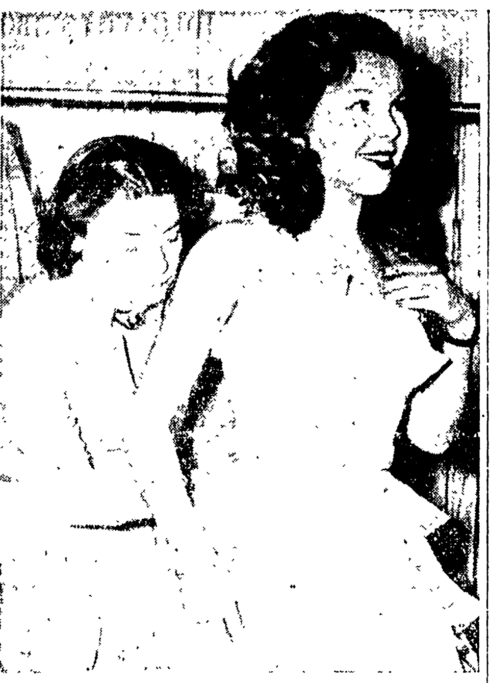
PARIGI - Cecilie Aubry, la graziosa attrice interprete di «Manon» ha lanciato per la primavera questo candido abito, ispirato alla moda delle nostre nonne

Appunto per questo la vecchia società ha volutamente trascurato di dare alla cultura popolare una organizzazione efficiente. Continua a discutere in congressi e in assemblee per farla, ma meglio si può dire che continua a convocare congressi ed assemblee per non farla. Se invece osserviamo quello che in sei o sette anni di attività legale hanno fatto - per la cultura popolare - i partiti politici, i sindacati, le varie organizzazioni dei lavoratori per migliorare il livello generale di cultura, notiamo subito da che parte sono venuti gli impulsi e anche i primi sostegni organizzativi.