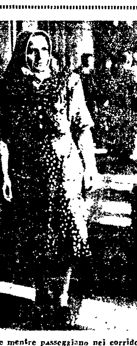
BUDAPEST - Due deputati contadini mentre passeggiano nei corridoi del Parlamento all'Ungheria democratica le masse femminili hanno fatto un gigantesco passo in avanti: 402 deputati ben 22 sono infatti donne

Il sabato degli kulak Questi sono i primi risultati, ma per raggiungerli si è dovuto superare non solo l'ostacolo immediato dell'aumento della produzione dei trattori ma l'altro ostacolo, quello politico, della diffidenza che nei villaggi si nutre verso il nuovo strumento.