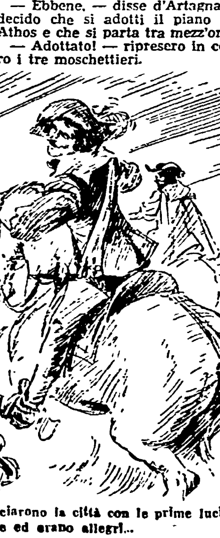
I nostri quattro avventurieri lasciarono la città con le prime luci del mattino. Parlavano ad alta voce ed erano allegri...

— Ebbene... disse d'Artagnan, decido che si adotti il piano di Athos e che si parta tra mezz'ora. Ad Athos — ripresero in coro i tre moschettieri.