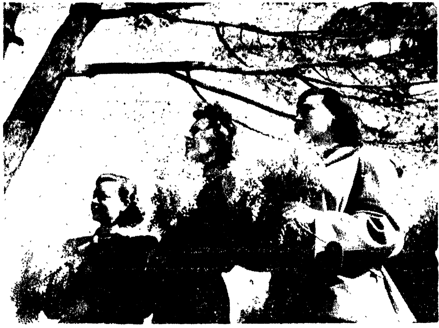
LE NOSTRE ATTRICI partecipano attivamente al movimento femminile per la difesa della pace...