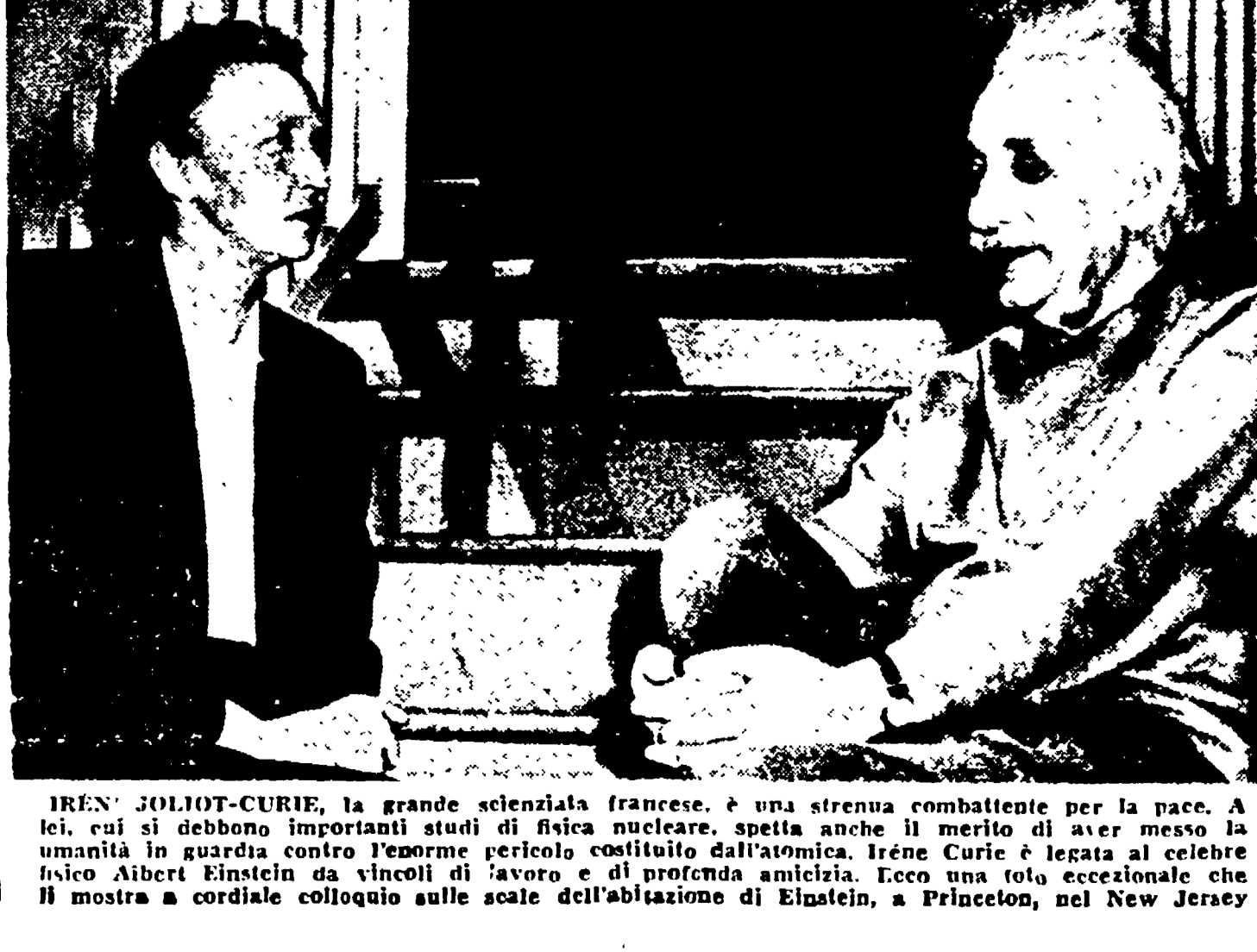
IRENE JOLIOT-CURIE, la grande scienziata francese, è una strenua combattente per la pace...