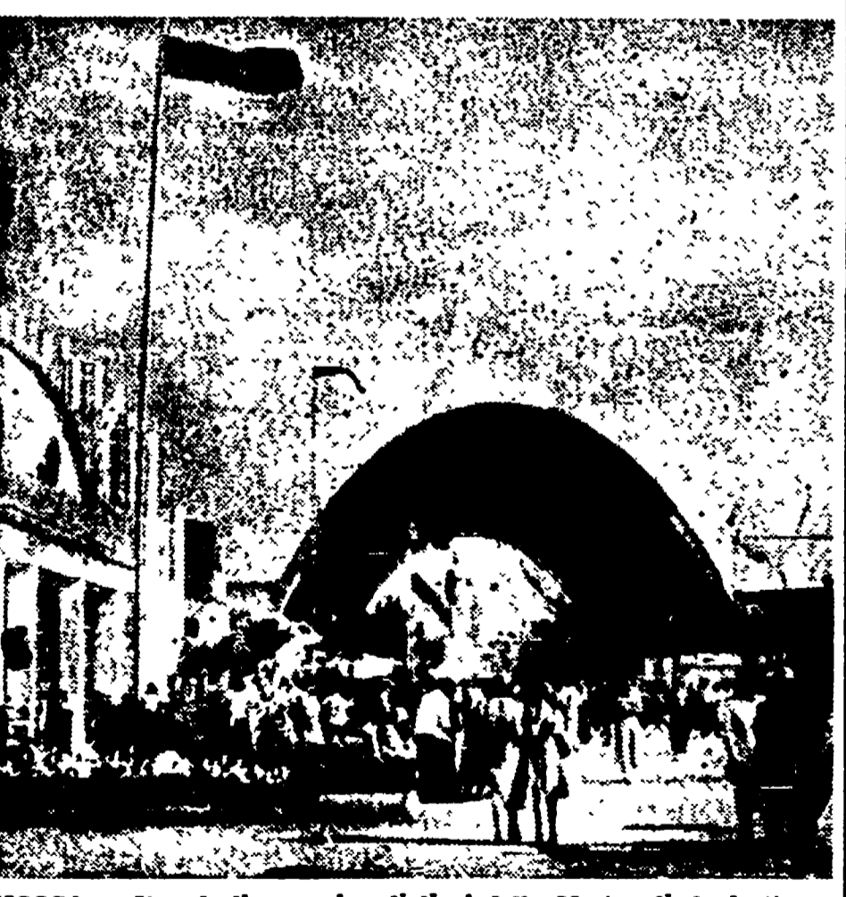
MOSCA - Uno degli enormi padiglioni della Mostra di Agricoltura...