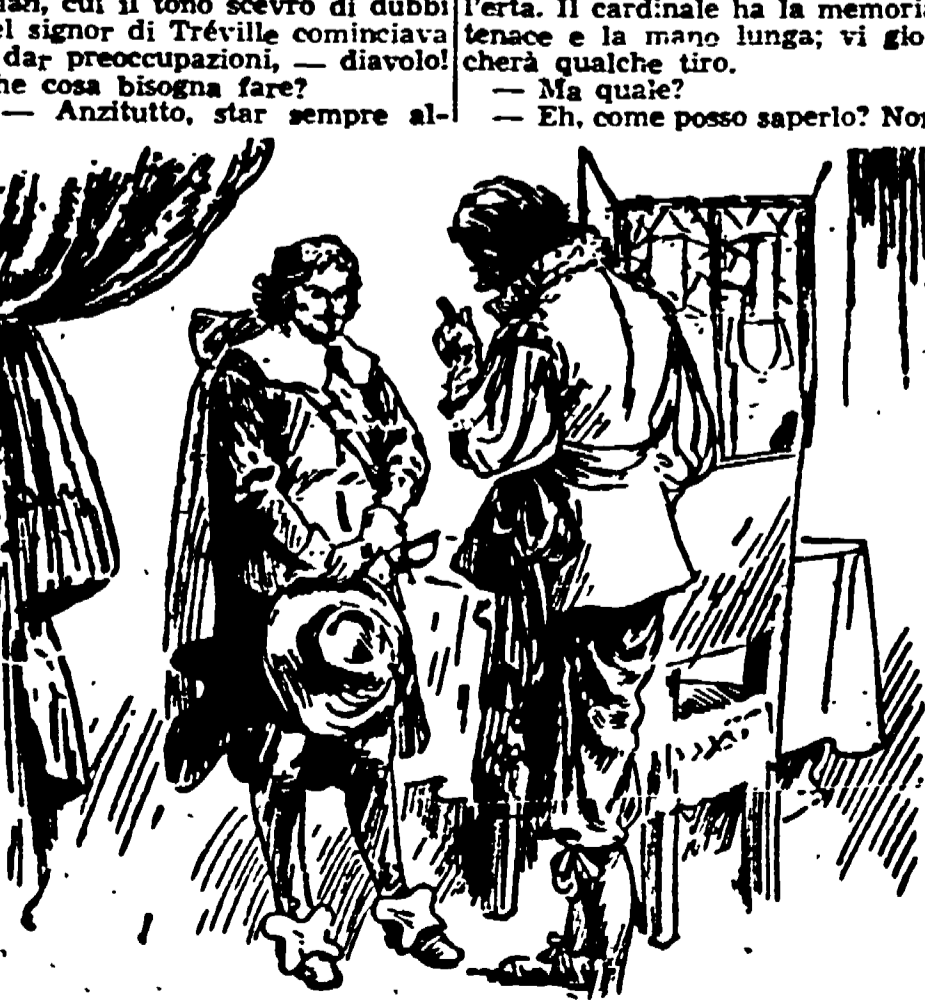
Promettetevi che partite domani - disse a D'Artagnan il signor di Tréville...