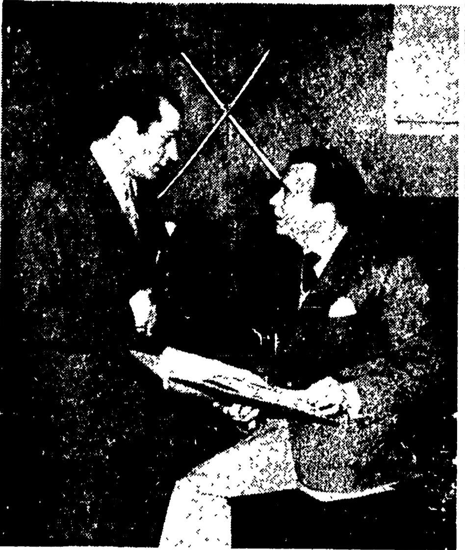
LONDRA - Il celebre attore e regista Laurence Olivier ha prodotto e diretto per il teatro «La spada di Damasco»...