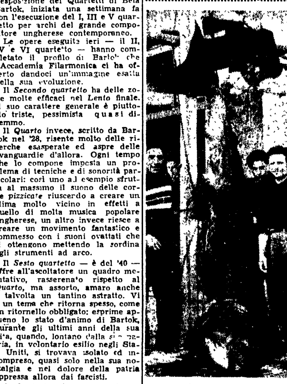
S. MARINELLA - Un enorme spettacolo di 13 metri di altezza...

«Ah, giovanotto, giovanotto! Qualche amoretto? State attento, ve lo ripeto...»