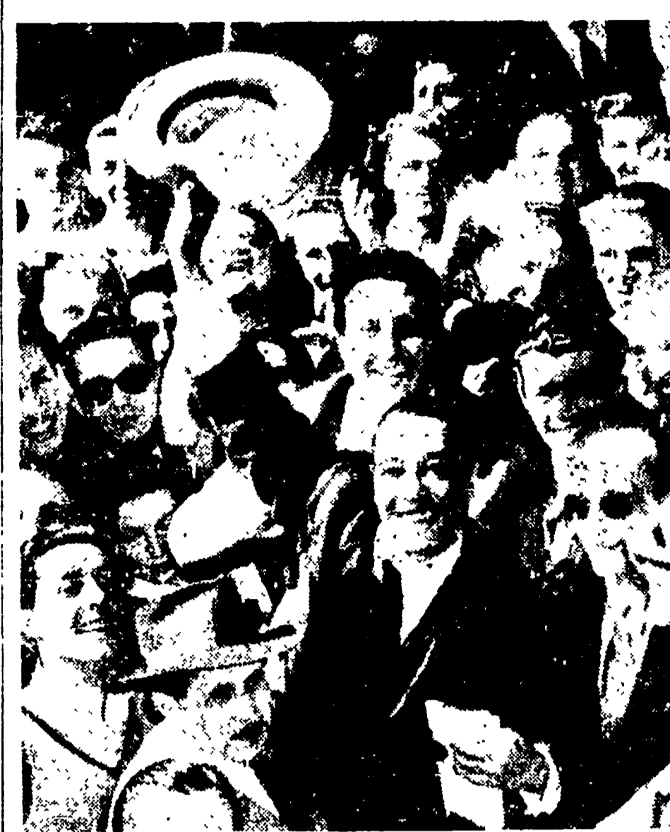
Duke Ellington, il popolare compositore e pianista negro si è dichiarato in questi giorni contro l'uso dell'atomo...