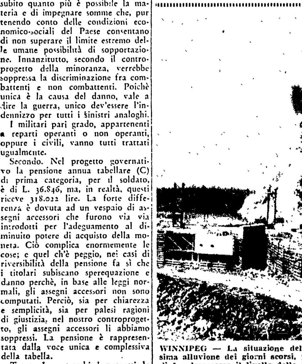
WINNIPEG - La situazione della città canadese, dopo la gravissima alluvione dei giorni scorsi, permane drammatica. Nel tentativo di far decrescere il livello delle acque che hanno invaso la zona, le autorità hanno deciso di far saltare una diga. La foto mostra il momento della gigantesca esplosione...