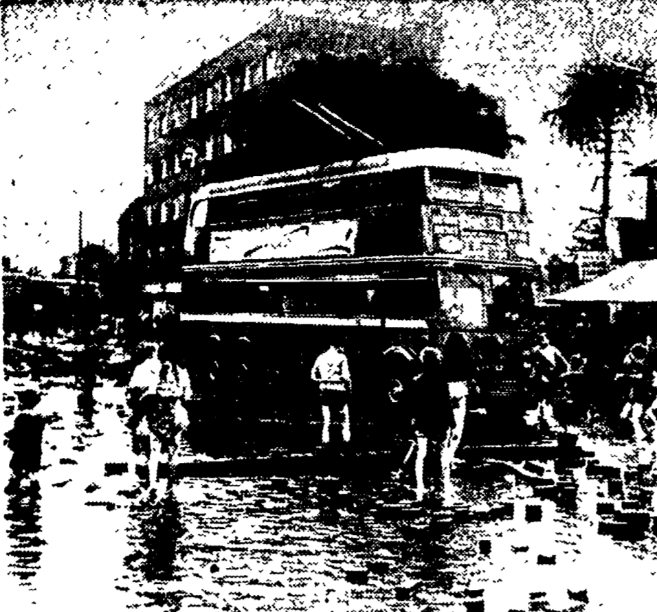
LONDRA - Un furioso temporale si è abbattuto l'altra notte sui quartieri centrali della città, causando sensibili danni agli edifici ed alla pavimentazione stradale...