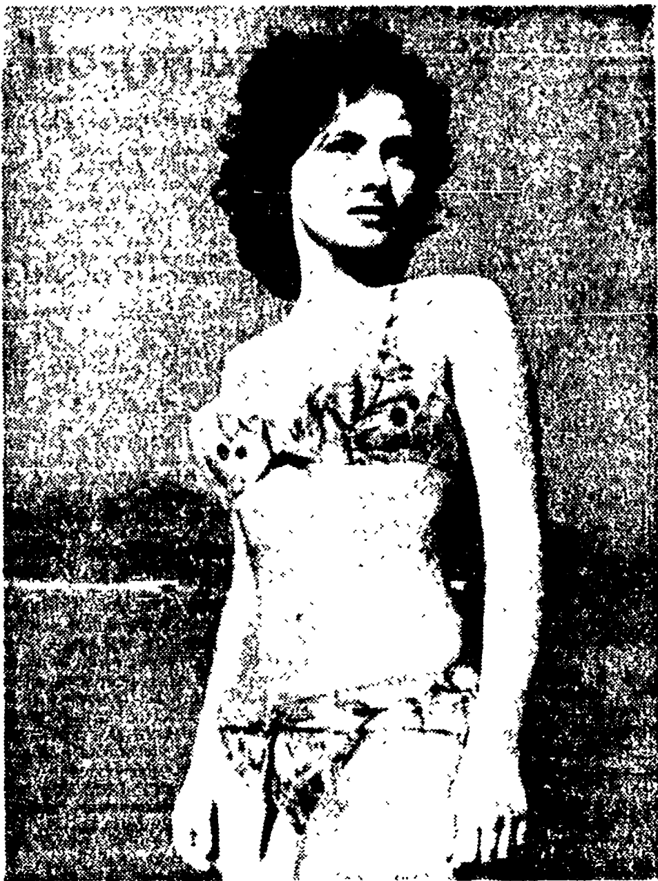
GINA LOLOBRIGIDA è la protagonista di "Miss Italia", il più recente film di Coletti, di cui presentiamo un suggestivo "esterno"