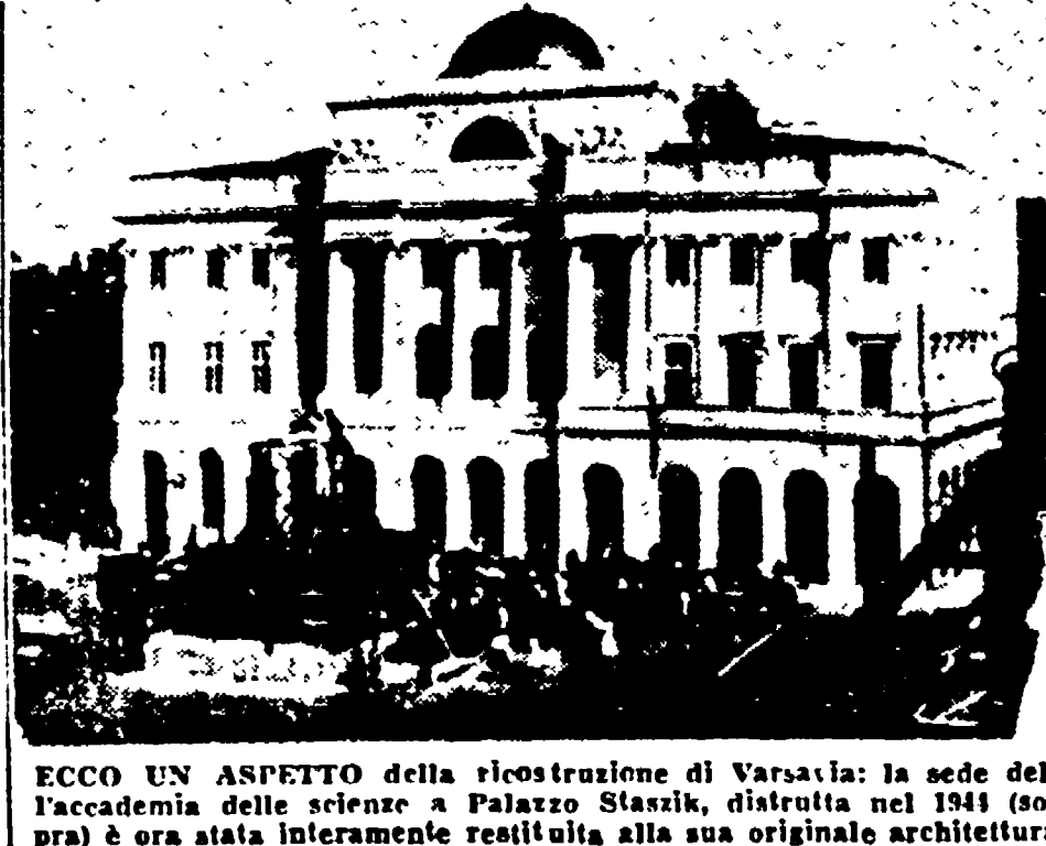
ECCO UN ASPETTO della ricostruzione di Varsavia: la sede dell'Accademia delle scienze a Palazzo Saska, distrutta nel 1944 (sopra) è ora stata interamente restituita alla sua originale architettura

Poi, quando al primo disordine di giri in taxi per la città è seguita una visita più attenta, il quadro si è completato e modificato. Se Varsavia è oggi probabilmente il cantiere edile più grande del mondo, è anche qui un cantiere di una città viva, degna capitale di un grande paese democratico. Dietro le mura non ancora intonacate dei palazzi lavorano gli uomini che dirigono il cammino del paese sulla via del socialismo; nelle fabbriche non ancora ultimata la produzione già supera la norma fissata dal piano; nelle case, sulle quali ancora s'alzano le carrucole con la calce, uffici, scuole, negozi privati e negozi di stato sono in piena attività e alla periferia, nei nuovi quartieri