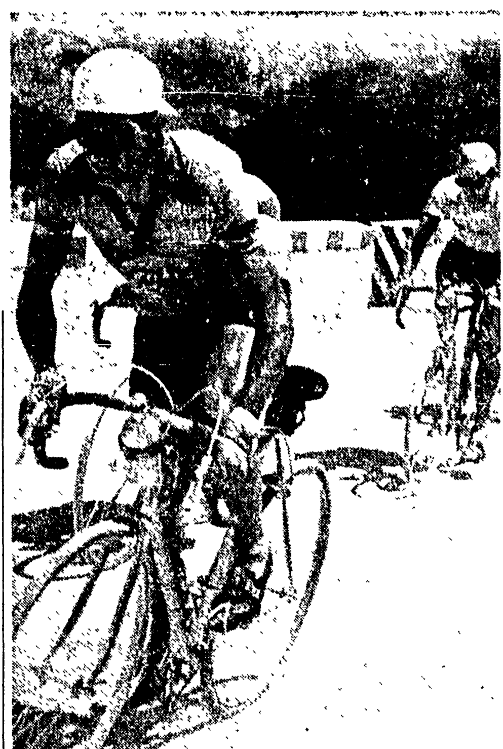
Una foto ripresa sul Macerone: Bartali attacca con molta decisione senza l'irregolarità di tante altre occasioni, e Koblet — compositissimo in sella — non fa fatica a seguirlo. In questo atteggiamento dei due primi classificati c'è un po' la sintesi di tutto il «Giro»

I numeri e i nomi della corsa, 105 i partiti, 75 gli arrivati: il 78% circa. La disgrazia più grossa: Coppi, caduto ai piedi delle Dolomiti; la cotta più cruda: Roberto nel tempo di 10 km. del traguardo di Bolzano. Maglia rosa e verde: Koblet con 117 h. 28'03" di bicicletta per «maneggiare» i 3974 km. a una buona media: 33,816; maglia bianca: Pedroni, regolare e fedele; maglia nera: Gestri con 5 h. 00'04" di ritardo. L'equipe più forte: la «Frejus»; la più