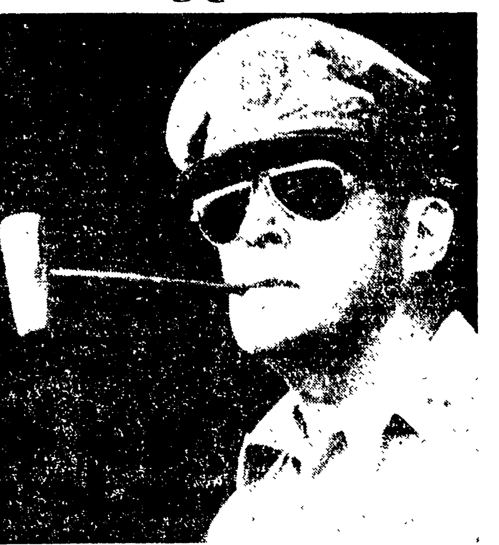
Il « nuovo imperatore del Giappone »... Così ama definirsi il generale MAC ARTHUR...