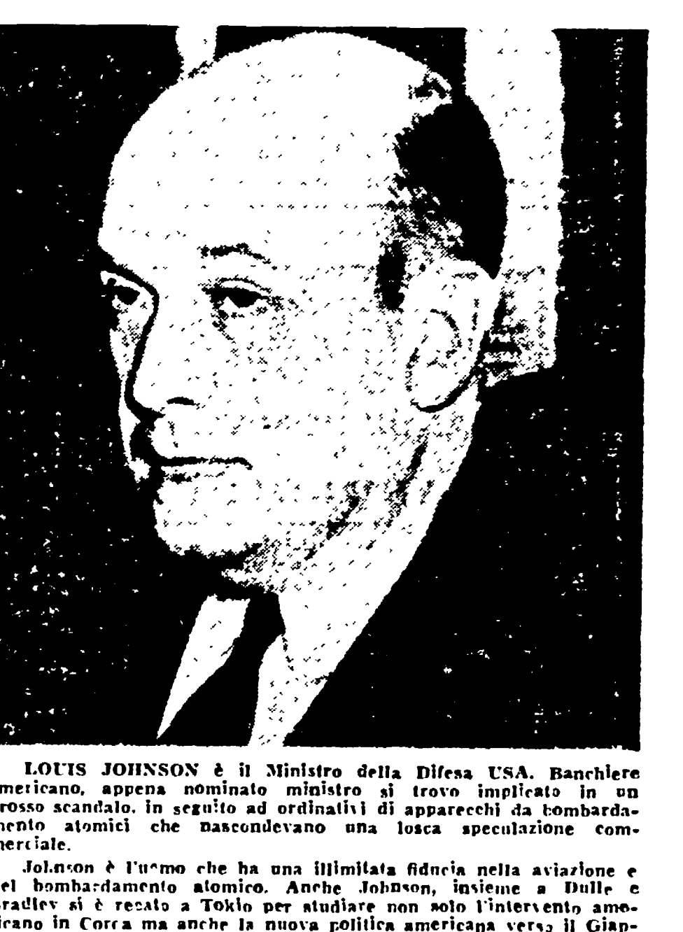
LOUIS JOHNSON è il Ministro della Difesa USA. Banchiere americano, appena nominato ministro si trovò implicato in un grosso scandalo...