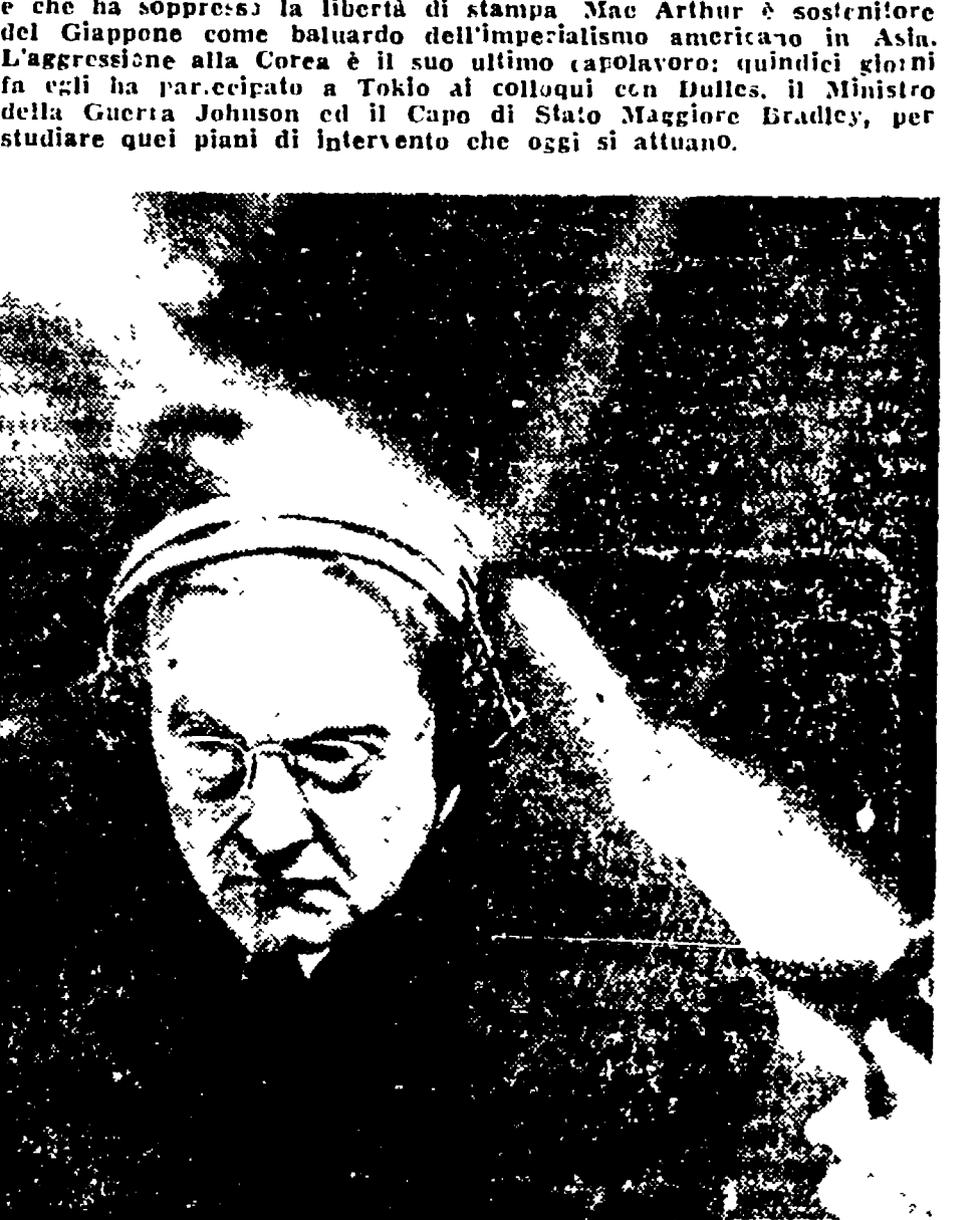
JOHN FOSTER DULLES, che Visinski definì il « guerrafondaio n. 1 » è l'assistente del segretario di Stato americano Acheson...