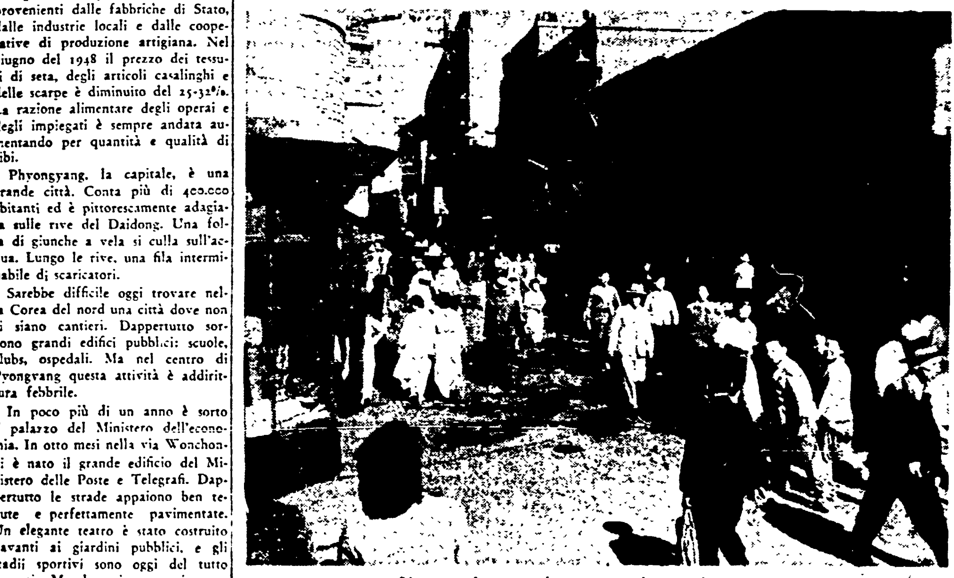
L'aspetto di un quartiere popolare in una città coreana