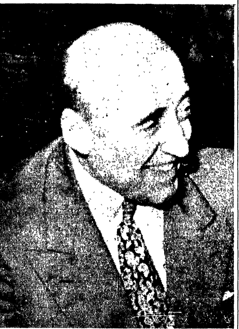
CESARE ZAVATTINI, autore di «Parliamo tanto di me» e di «Totò il buono», ha in questi giorni firmato l'appello di Stoccolma per l'interdizione delle armi atomiche