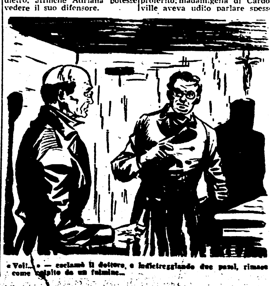
«Voi...» - esclamò il dottore, e indietreggiando due passi, rimase come colpito da un fulmine.