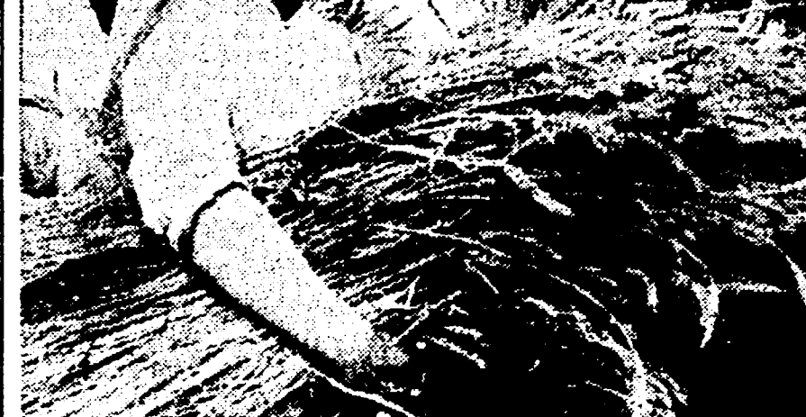
I contadini del Nord-Est hanno realizzato l'altro anno un buon raccolto di grano. E' questa una sicura garanzia per il rapido elevamento del tenore di vita del popolo.