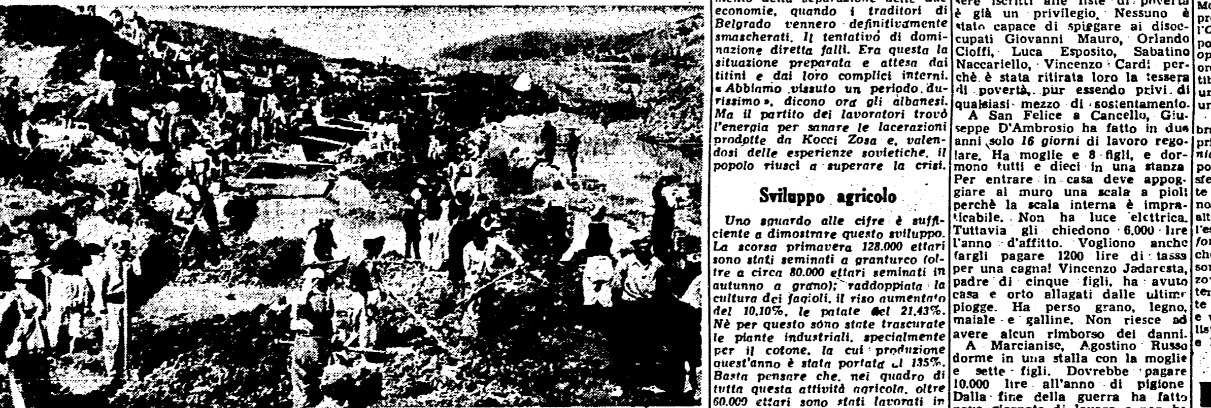
Il prosciugamento del lago di Malli ha reso coltivabili 4000 ettari di terra fertile

una grande importanza per i giovani che partecipano alla guerra contro il fascismo. Una grande importanza per i giovani che partecipano alla guerra contro il fascismo. Una grande importanza per i giovani che partecipano alla guerra contro il fascismo.