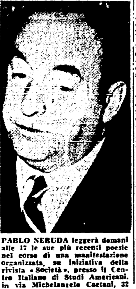
PABLO NERUDA leggerà domani alle 11 le sue più recenti poesie nel corso di una manifestazione organizzata su iniziativa della rivista «Società» presso il Centro Italiano di Studi Americani, in via Michelangelo Castaldi, 32.

Questo argomento convince l'albanese-americano. Partì e al suo arrivo a Urzuzzo presentò, nel corso della sua visita, un gran numero di documenti, in parte più o meno falsi, in parte falsi d'impressione, dove il ritmo della vita batteva veloce in un'atmosfera di grande affrettamento.