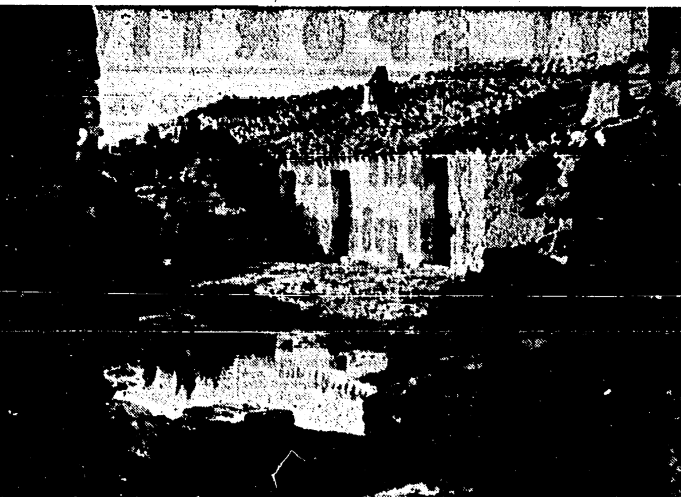
La grande inchiesta in corso sulla miseria e lo sfruttamento nel Mezzogiorno e nelle isole porta alla luce esempi clamorosi della triste condizione in cui sono costretti a vivere milioni di esseri umani nelle regioni più abbandonate d'Italia.

Andrea spalancò di colpo la porta... e insieme con lui entrò turbando il vento e con il vento, una spruzzata di pioggia gelida.