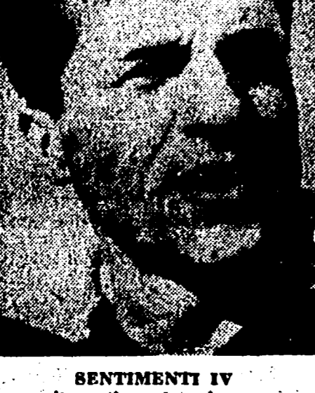
SENTIMENTI IV il portiere del giorno