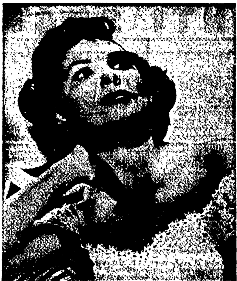
Lena Horne, la bella attrice e cantante negra, che molti ricordano interprete di «Stormy Weather», colta in una suggestiva espressione.