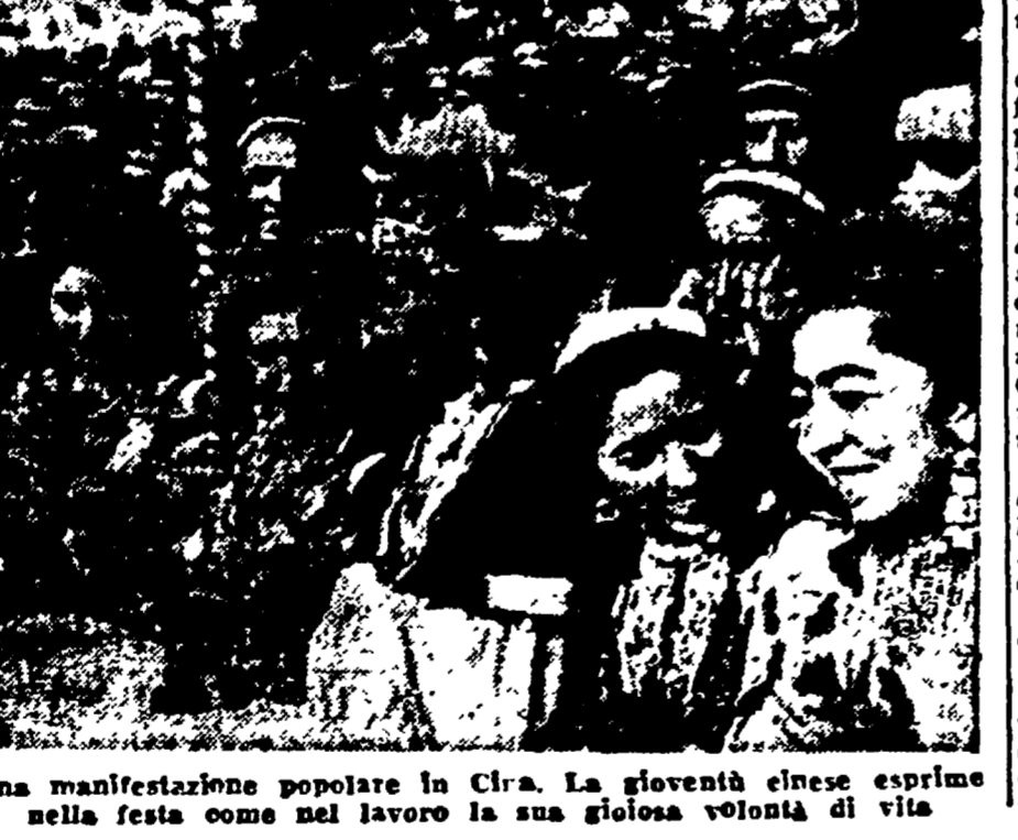
Una manifestazione popolare in Cina. La gioventù cinese esprime nella festa come nel lavoro la sua gloriosa volontà di vita.

«Eisenhower è stato messo a capo di ombre», afferma il «N. Y. Times». Il sergente di Wall Street, candidato dei trust alla Casa Bianca, si è trasformato in una rigida caserma.