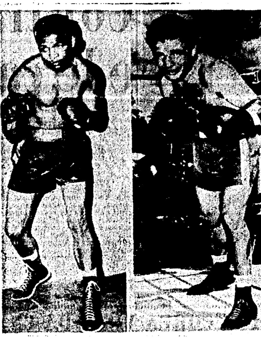
Due recenti fotografie di RAY ROBINSON e JAKE LA MOTTA