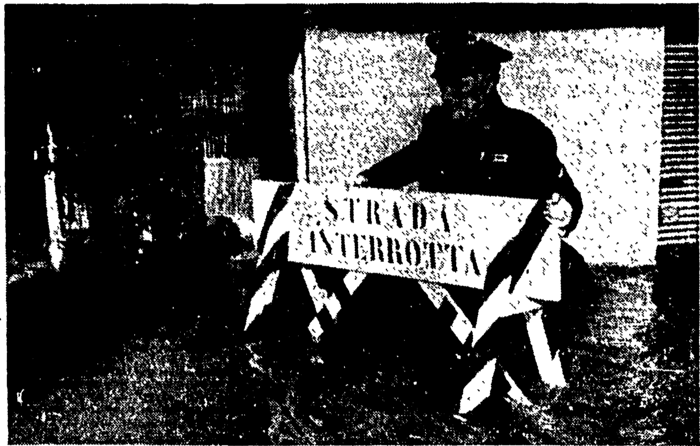
Il mal tempo che da due giorni ha ricominciato ad intorbidare nell'Italia del nord ha causato ancora vittime, danni e alluvioni. Nella foto una visione di una località invasa dalle acque.