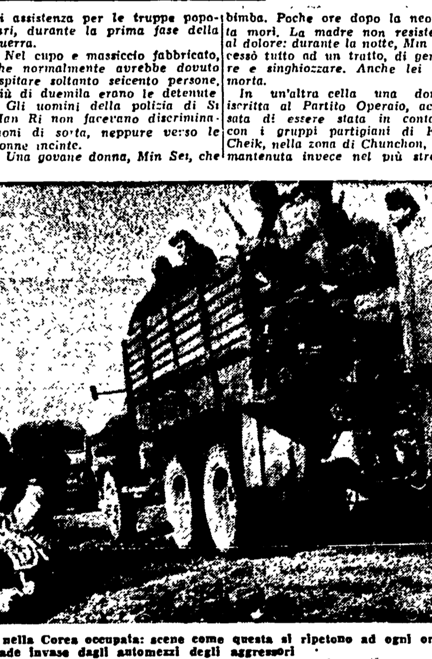
Il dramma della popolazione civile nella Corea occupata: ecco come questa si ripete ad ogni ruggine le strade lavate dagli atomizzati degli aggressori

Al termine dei suoi lavori il Congresso della Federazione Comunista di Genova ha approvato la seguente risoluzione. Il IV Congresso Provinciale della Federazione Comunista di Genova, a conclusione dei suoi lavori chiaramente e decisamente orientati secondo le precise direttive date dal compagno Togliatti per la difesa della pace, del benessere e della libertà del popolo italiano, ha approvato l'intervento del compagno Longo che ha illustrato la natura indiscutibilmente popolare, nazionale, patriottica di queste direttive e dell'azione svolta dal Partito Comunista in tutti i momenti della sua dura esistenza e della sua eroica lotta.