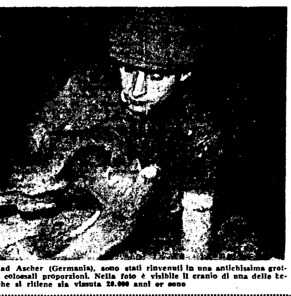
Durante alcuni scavi archeologici ad Ascher (Germania), sono stati rinvenuti in una antichissima grotta i resti di orsi, preistorici dalle colossali proporzioni...