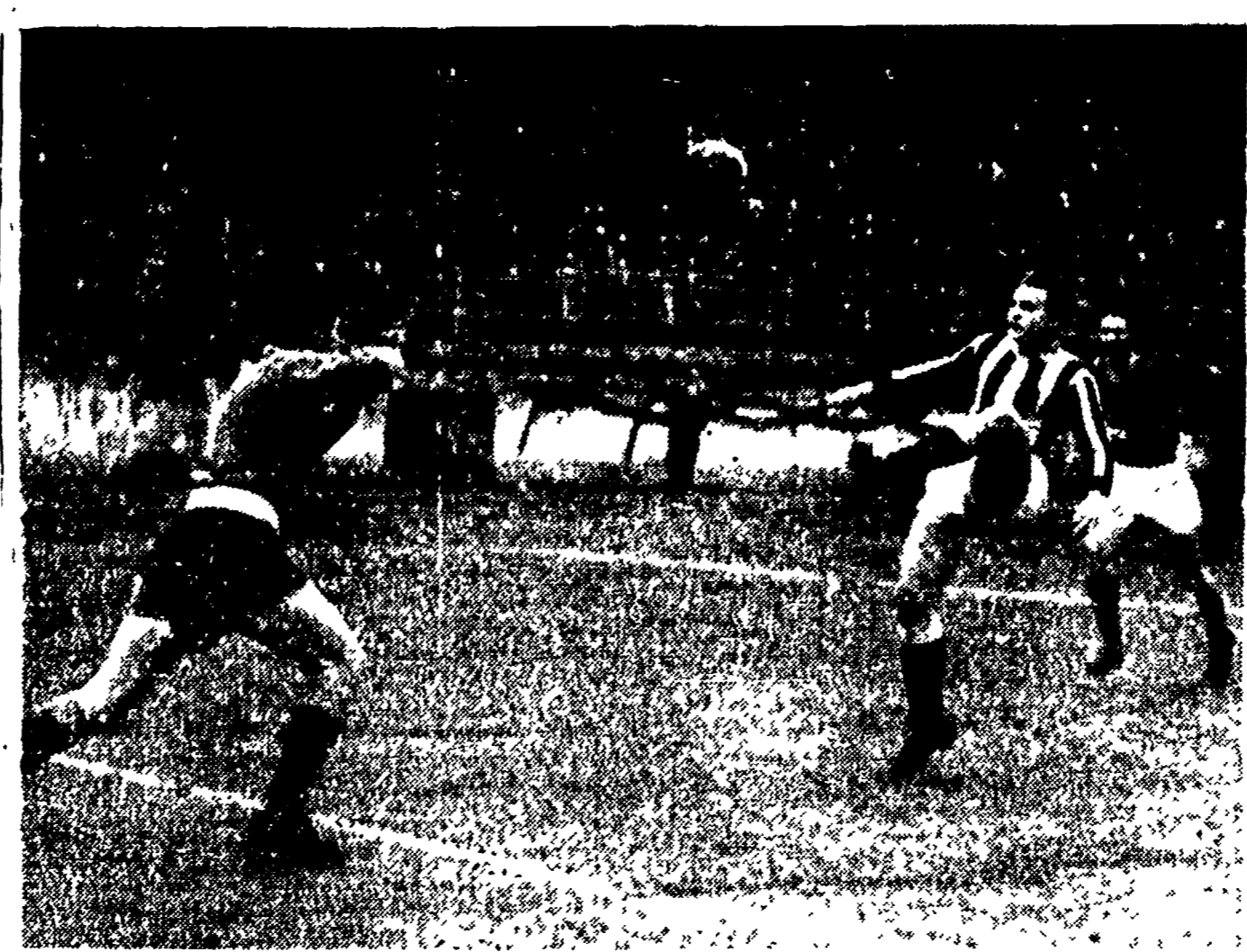
ROMA-JUVENTUS (3-0) - Questa fotografia potrebbe essere dell'ata al tifosi Juventus delusi...

questa; che il «carverismo» spin- to all'eccesso ha portato la squad-