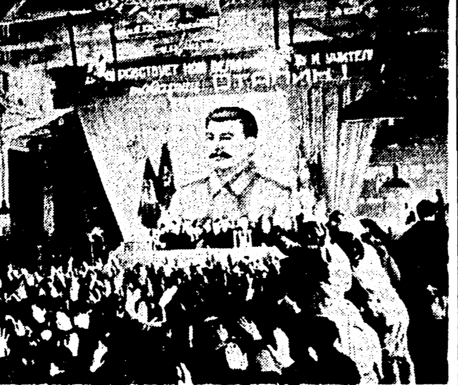
MOSCA - Un comizio elettorale in una grande fabbrica di Mosca

Stalin eletto nel collegio "Kirov", di Leningrado - Scienziati, artisti, operai e contadini stacanovisti fra i candidati - La maggioranza degli elettori ha votato prima di mezzogiorno