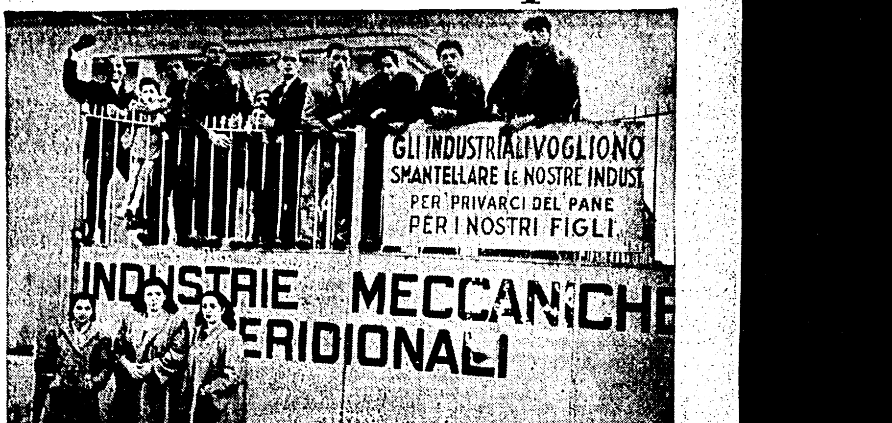
GLI INDUSTRIALI VOGLIONO SMANTELLARE LE NOSTRE INDUSTRIE PER PRIVARCI DEL PANE PER I NOSTRI FIGLI INDUSTRIE MECCANICHE MERIDIONALI

NAPOLI, 19. - Una decisione di grande importanza è stata presa ieri dalle maestranze della IMM Bufala rimaste in fabbrica dopo l'abbandono dello stabilimento da parte della direzione... IL GOVERNO IN PREDA A UN'INSTABILITÀ PERMANENTE