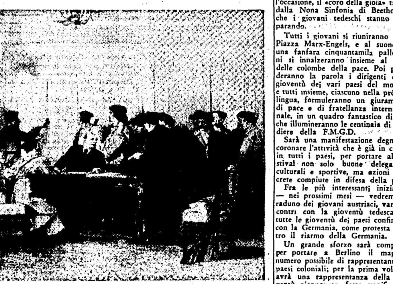
Una drammatica scena de «L'indimenticabile anno 1919»

«Il drappello del 27. Alla Prima armata di cavalleria (1929) seguì nel 1931, l'ultimo e più importante lavoro di Vishnevski, intitolato «L'indimenticabile anno 1919», nella quale l'autore ha dedicato la sua opera drammatica...»