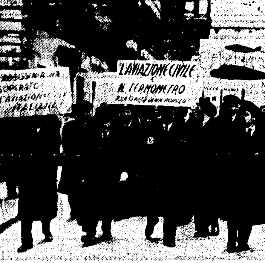
Il personale delle linee aeree civili delle società Alitalia e Alitalia e Alitalia è stato in sciopero per la mancanza di sovvenzioni da parte dello Stato...