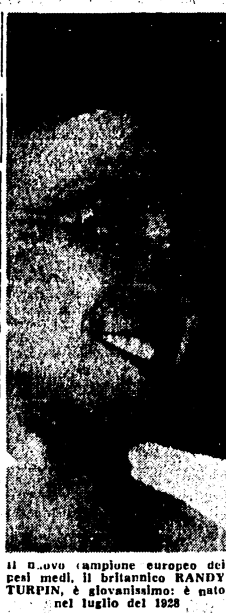
Il nuovo campione europeo del pesi medi, il britannico RANDY TURPIN, è giovanissimo: è nato nel luglio del 1928

vi caduti sui campi di battaglia, in prigioni, falciati dalla mitraglia, sui campi di gioco, nelle palestre; questo noi chiediamo per salvare lo sport ai quali essi si dedicano con amore, senza riserve, alla cui vitalità alle cui omissione di fraternità, di comprensione, di amore, noi crediamo.