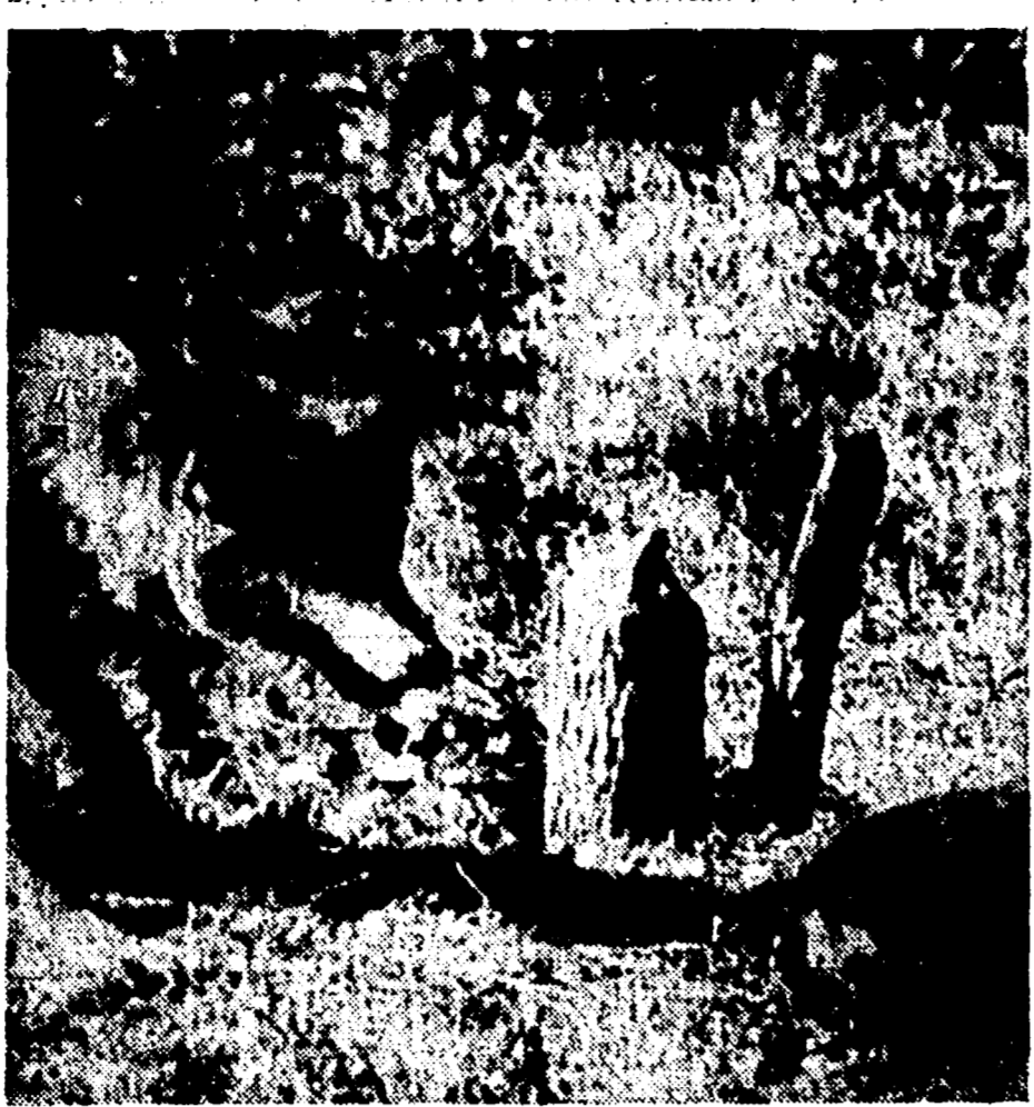
Ha inizio oggi a Roma, al Cinema Rialto, una importantissima rassegna del documentario scientifico sovietico. I documentari che saranno presentati nella prima giornata sono: «Vita nella foresta», «Caccia alla balena», «Alle sorgenti della verità».

«Nella pubblicistica borghese, si identifica la nazionalizzazione laburista con la creazione di una società socialista; si crede di suffragare ulteriormente la tesi di una «Inghilterra socialista» citando i piani di assistenza sociale o l'imposta progressiva sui redditi e sulla successione...»