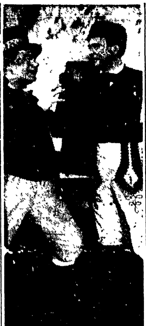
Una scena della "Sposa venduta", la popolare opera di Federico Smetana.