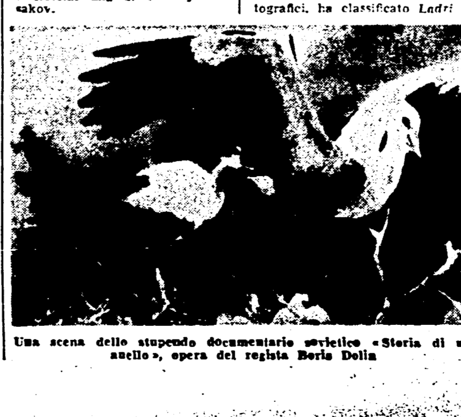
Una scena dello stupendo documentario sovietico «Storia di un'atletico», opera del regista Boris Dolin

GENOVA, 14. - Ha avuto ieri inizio all'Università, presenziato dai maggiori autorità cittadine, il Convegno internazionale di studi colombiani, nel quadro delle celebrazioni organizzate per il 500° anniversario della nascita di Colombo. Il prof. L. R. Reynolds, della Università di Wisconsin, ha parlato sul tema «Gli indiani degli Stati Uniti e del Canada». Il convegno durerà fino al 17 corrente.