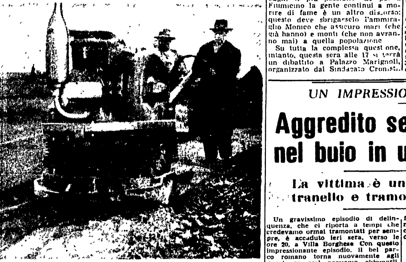
Ruba lavoro a dieci operai e ci mette di più