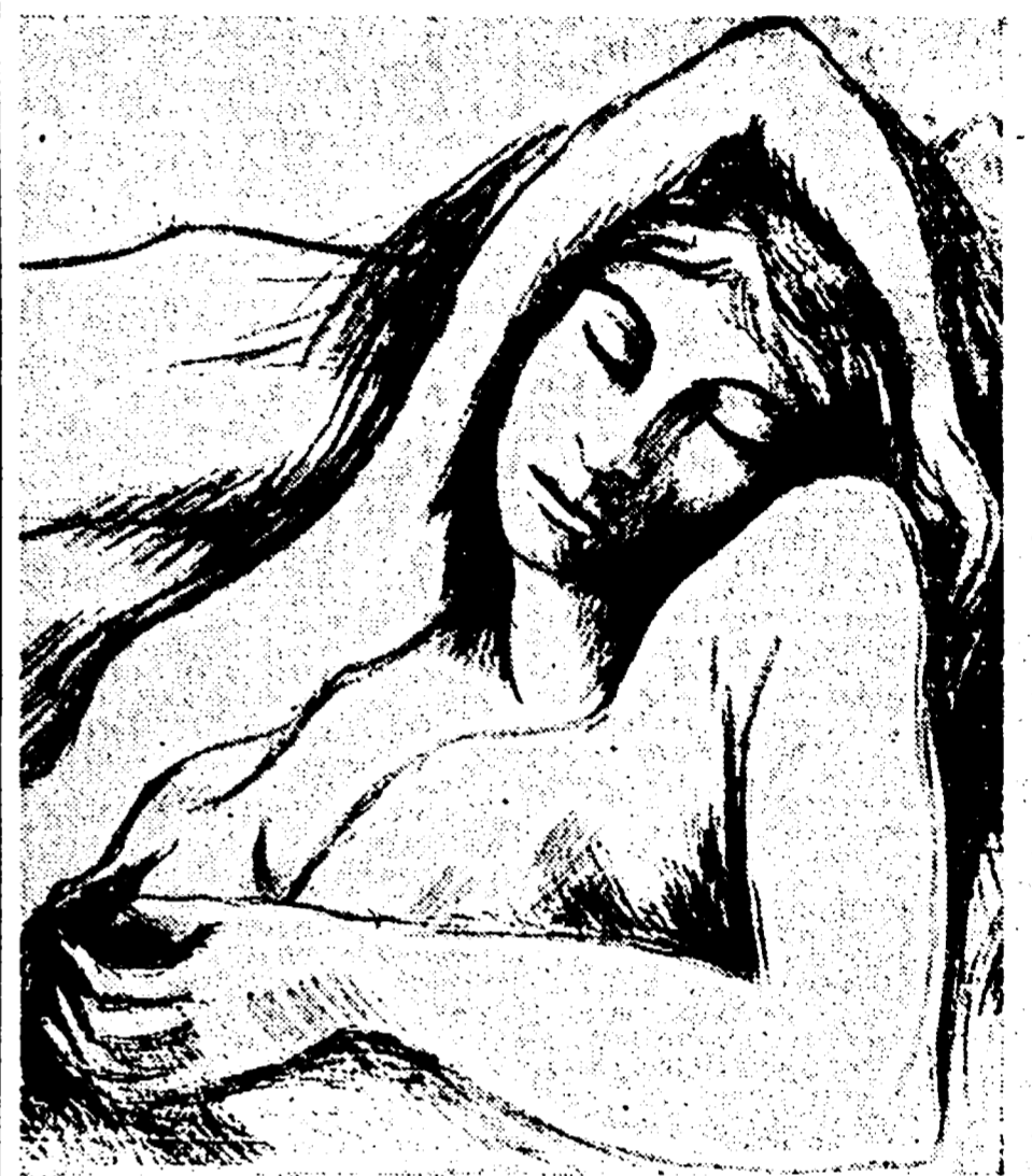
Mostra «L'arte contro la barbarie»: CARLO LEVI: «Partigiana greca ferita» (particolare) - Collezione privata

Il governo e gli improvvisati anonimi critici d'arte che tentano in questi giorni di dimostrare all'opinione pubblica la legittimità di un'opposizione senza menzogne e che la «Mostra dell'Arte contro la Barbarie» è stata vietata per motivi riguardanti la politica di guerra del Sig. De Gasperi e dei suoi collaboratori al governo.