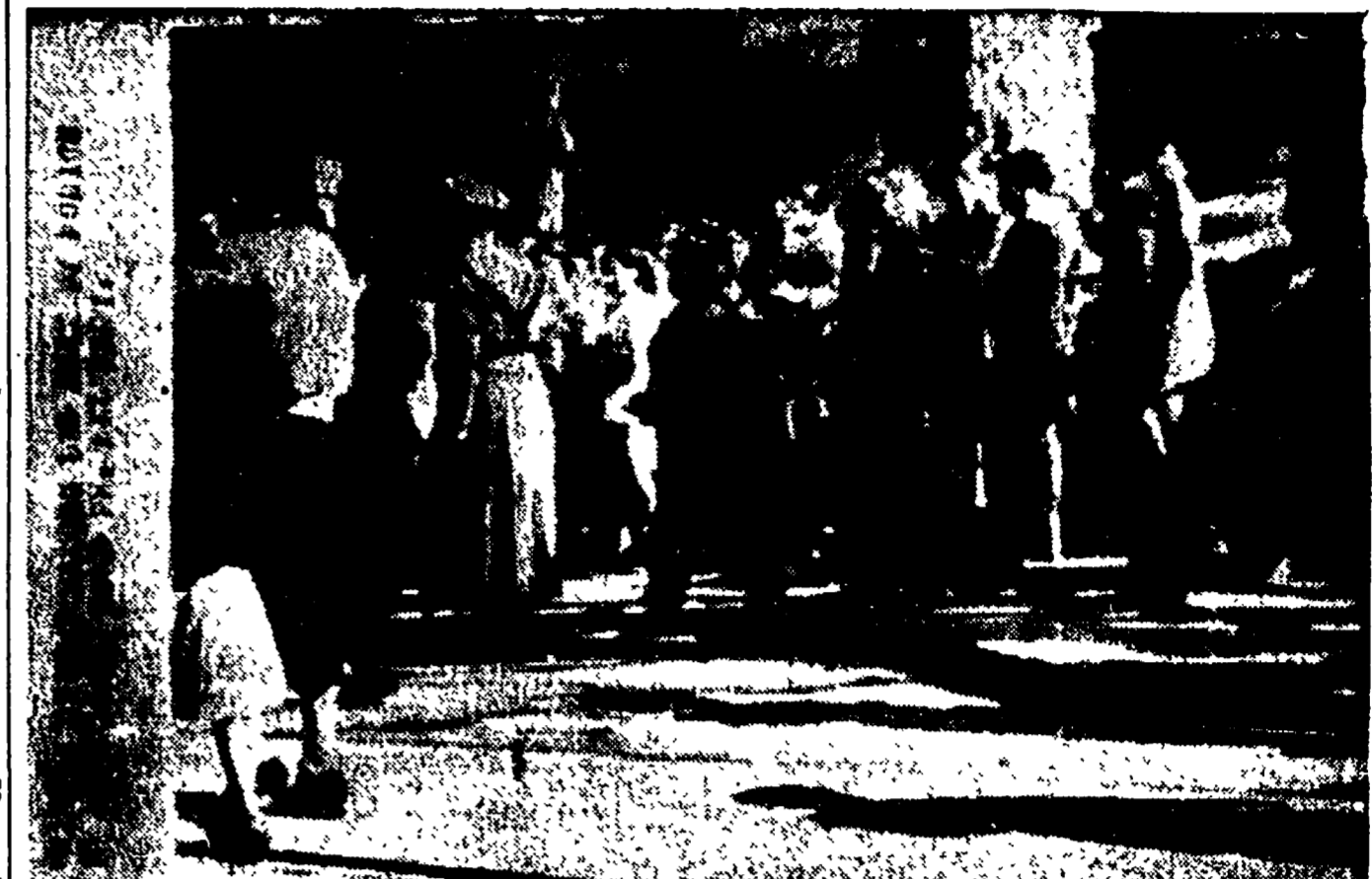
La prima telefoto degli avvenimenti di Barcellona pervenuta attraverso le maille della censura. Da lunedì, giorno in cui la fotografia è stata ripresa, la lotta dei lavoratori catalani continua. Secondo notizie dell'ultima ora nuove manifestazioni si sono avute ieri nelle vicine città, mentre lo sciopero continua nei sobborghi industriali e a Mataró e Puigiloba. Da all'opera di un'importante azienda industriale, Rocas Martin, è stato arrestato «per non aver collaborato con le autorità» contro gli scioperanti