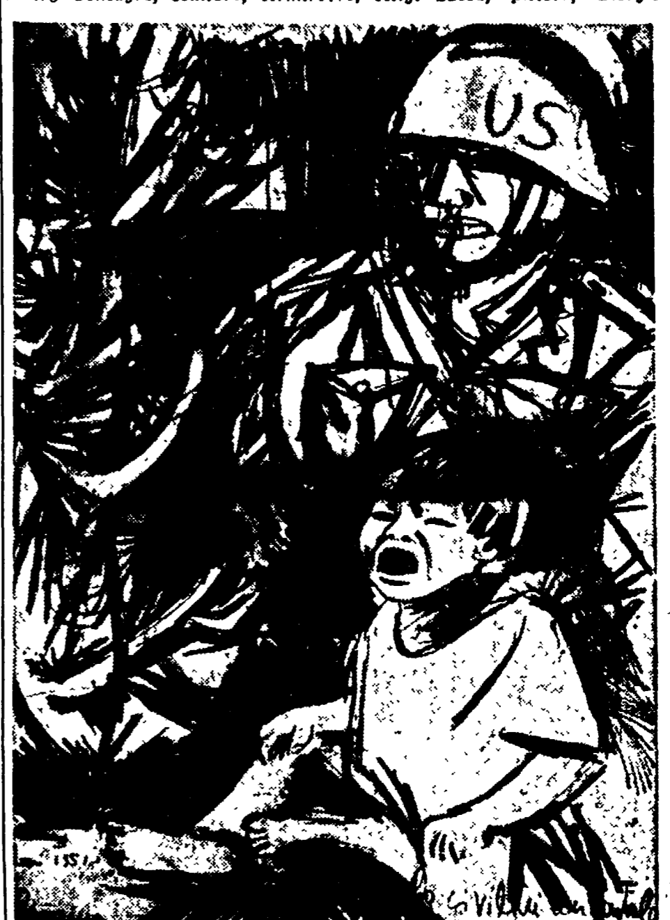
GIUSEPPE ZIGAINA - «Lo spettro della guerra» (Mostra dell'arte contro la barbarie)