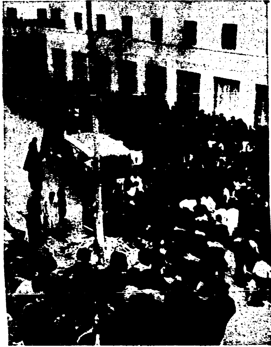
La folla di soccorsi intorno ad un'ambulanza. Un ferito è stato estratto sanguinante dalle macerie e viene trasportato all'ospedale.