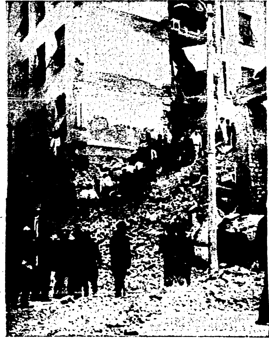
Gli operai dei cantieri edili di Monteverde hanno sospeso il lavoro per aiutare i pompieri nella rimozione della macerie.