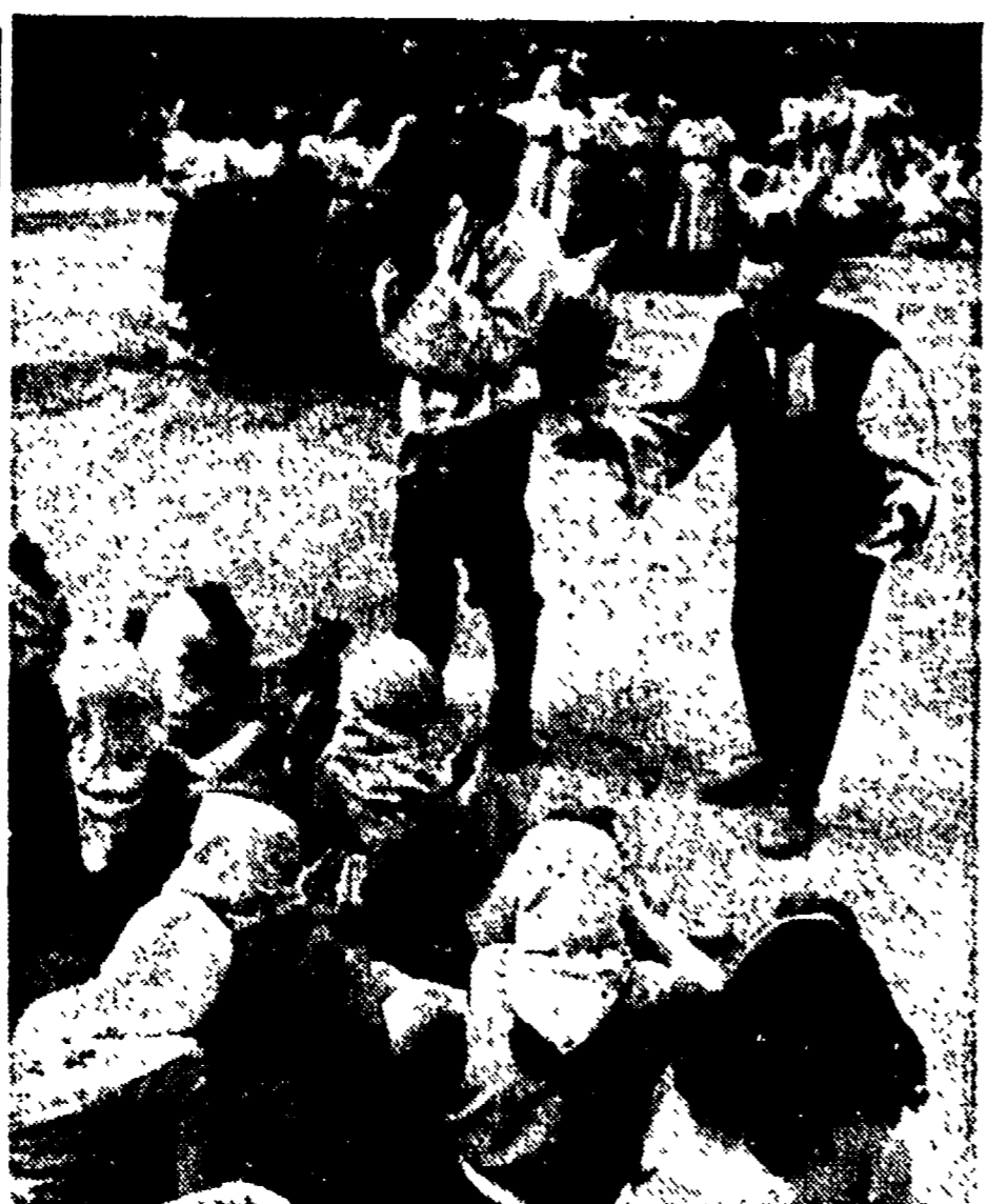
CECOSLOVACCHIA — Una gara fra la campagna organizzata da giovani e da ragazze appartenenti al « Sokol »...