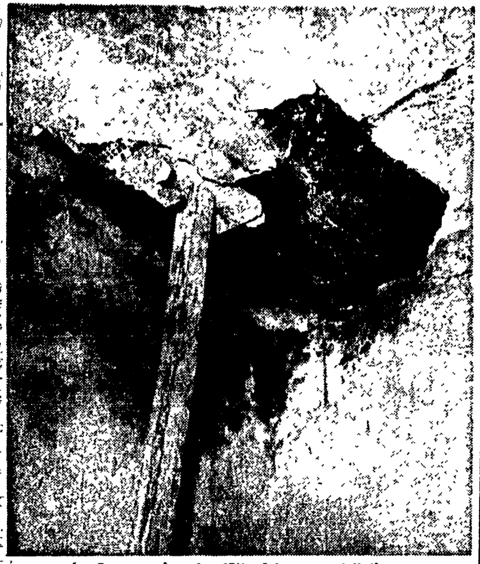
Lo squarcio nel soffitto del campo sfollati