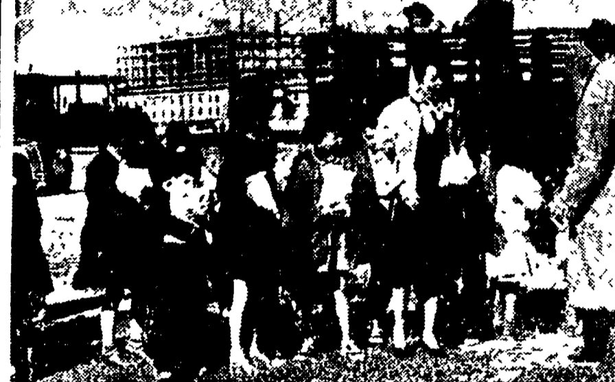
Un gruppo dei 28 bimbi di Torrancia che ieri hanno avuto offerto dalla solidarietà dei commercianti e dei comunisti del Balaro un pranzo e i dolci

Ogni ricorrenza, si sa, ha la sua stagione. Freddo, pioggia e neve per Natale, freddo ancora per Carnevale, caldo infernale per Ferragosto.