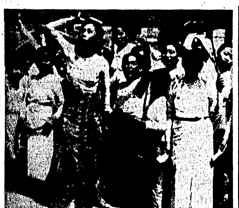
SINGAPORE, 29. — Le forze di liberazione birmane hanno celebrato il 24 marzo la Giornata della Rivoluzione birmana riprendendo con energia la lotta contro il governo di Rangoon...